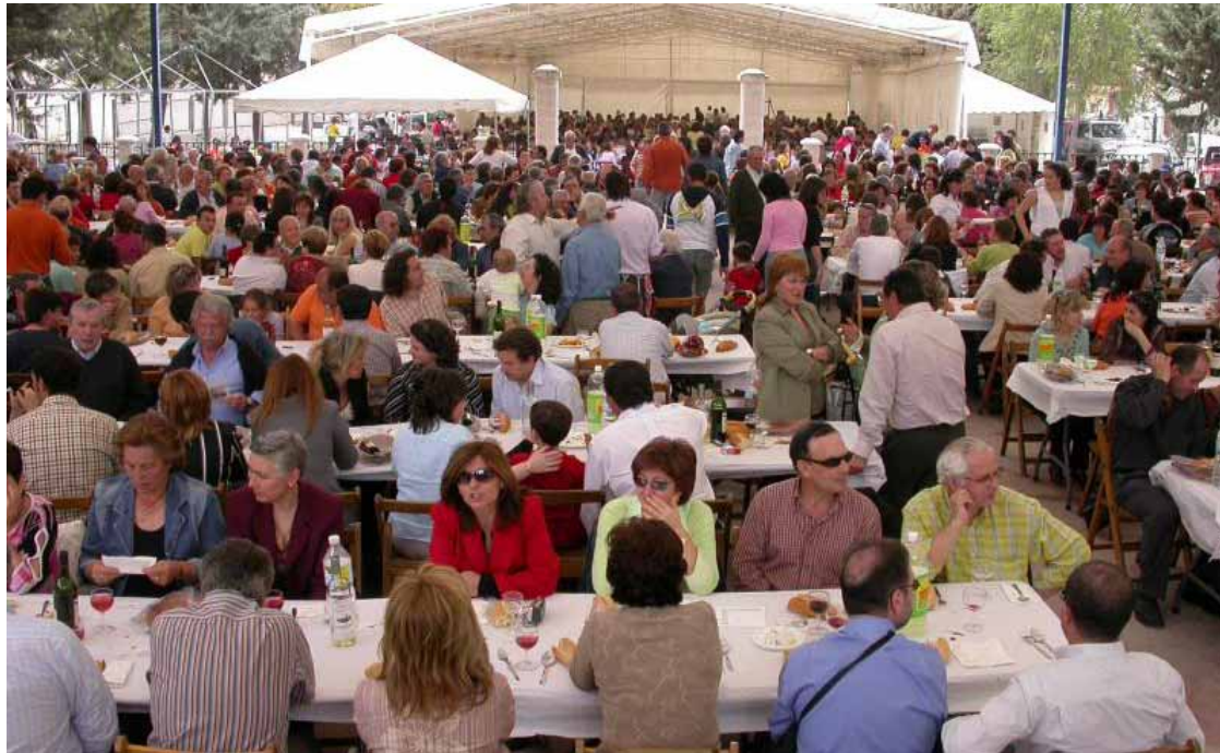
Asistentes a la Jornada del Vino, durante la comida.