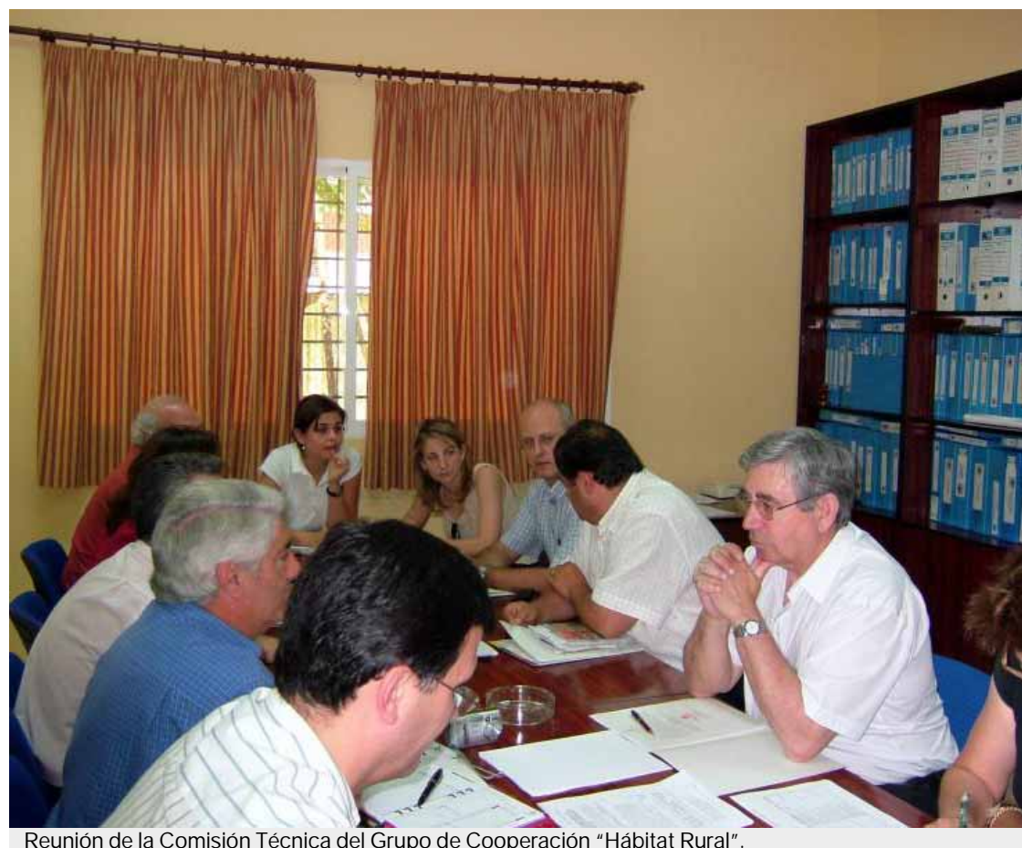
Reunión de la Comisión Técnica del Grupo de Cooperación "Hábitat Rural".

El propósito del Concurso de Ideas Empléate Two es incentivar las capacidades emprendedoras de jóvenes menores de treinta