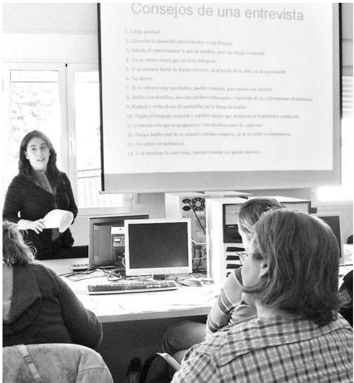
Una técnica del programa "Andalucía Orienta", en una sesión de trabajo, en Adsur.

Estos tres programas son iniciativas de la Consejería de Empleo de la Junta de Andalucía, desarrolladas por la Asociación para el Desarrollo Rural de la Sierra Sur. Su objetivo primordial es abrir una puerta al empleo para personas en situación de paro de la comarca. ■