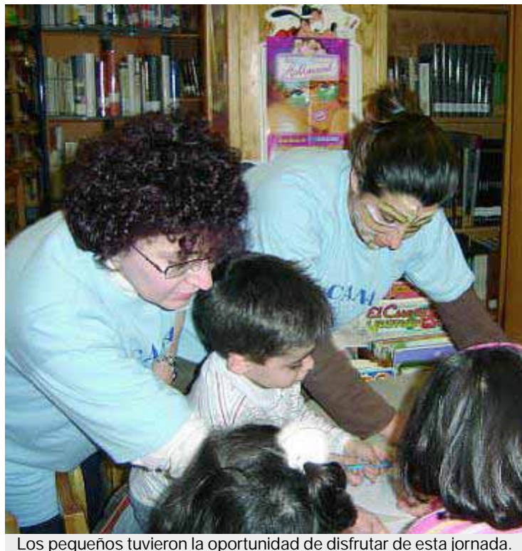
Los pequeños tuvieron la oportunidad de disfrutar de esta jornada.