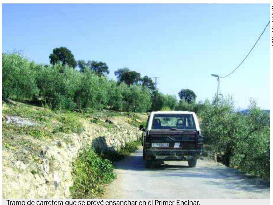
Tramo de carretera que se prevé ensanchar en el Primer Encinar.

Por otro lado, también se van a realizar mejoras en una de las vías más transitadas de la localidad y que conecta Fuensanta con las pedanías; consistirán en el ensanchamiento del tramo que va del Primer Encinar al Segundo Encinar para garantizar una mayor seguridad al conductor, sobre todo en época de recolección. ■