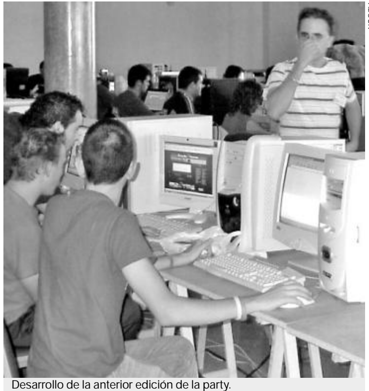
Desarrollo de la anterior edición de la party.