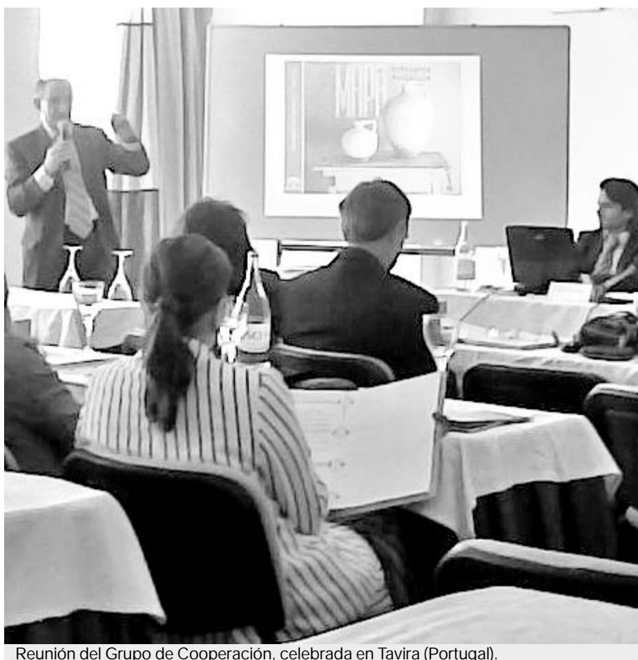
Reunión del Grupo de Cooperación, celebrada en Tavira (Portugal).

Los asistentes al encuentro de Tavira también abordaron otros asuntos, como el auge de los centros comerciales abiertos y la necesidad del comerciante de hacer frente a la competencia que encuentra en las grandes superficies. Ante esta situación, se llegó a la conclusión de que el pequeño comerciante no se puede quedar de brazos cruzados, sino que ha de hacer frente a los nuevos retos que se le presentan. Para ello es fundamental la unidad y cooperación de los empresarios. ■