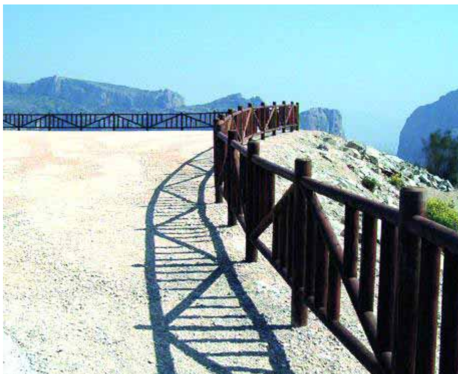
Mirador de Cabrahigos.

La nueva infraestructura turística está construida en la carretera que une Los Villares con Jaén