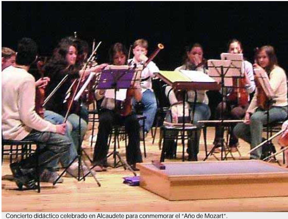
Concierto didáctico celebrado en Alcaudete para conmemorar el "Año de Mozart".

La asistencia al concierto didáctico, en algunos centros educativos que así lo demandaron, se complementó con otras actividades, como una visita cultural a la