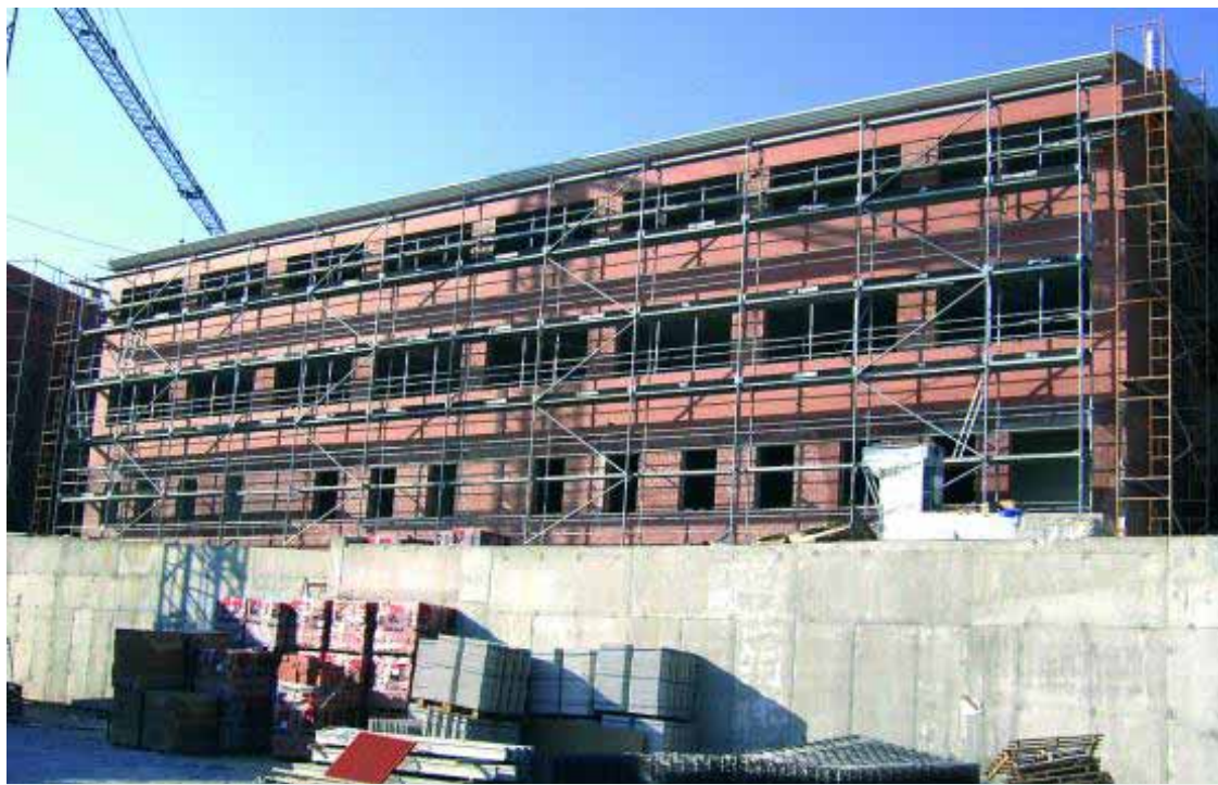
Estado de las obras de construcción del IES de Fuensanta de Martos.

INFRAESTRUCTURAS ■ Fuensanta de Martos contará con un nuevo centro de secundaria con capacidad para 240 escolares y que ha contado con un presupuesto superior a 1.800.000 euros