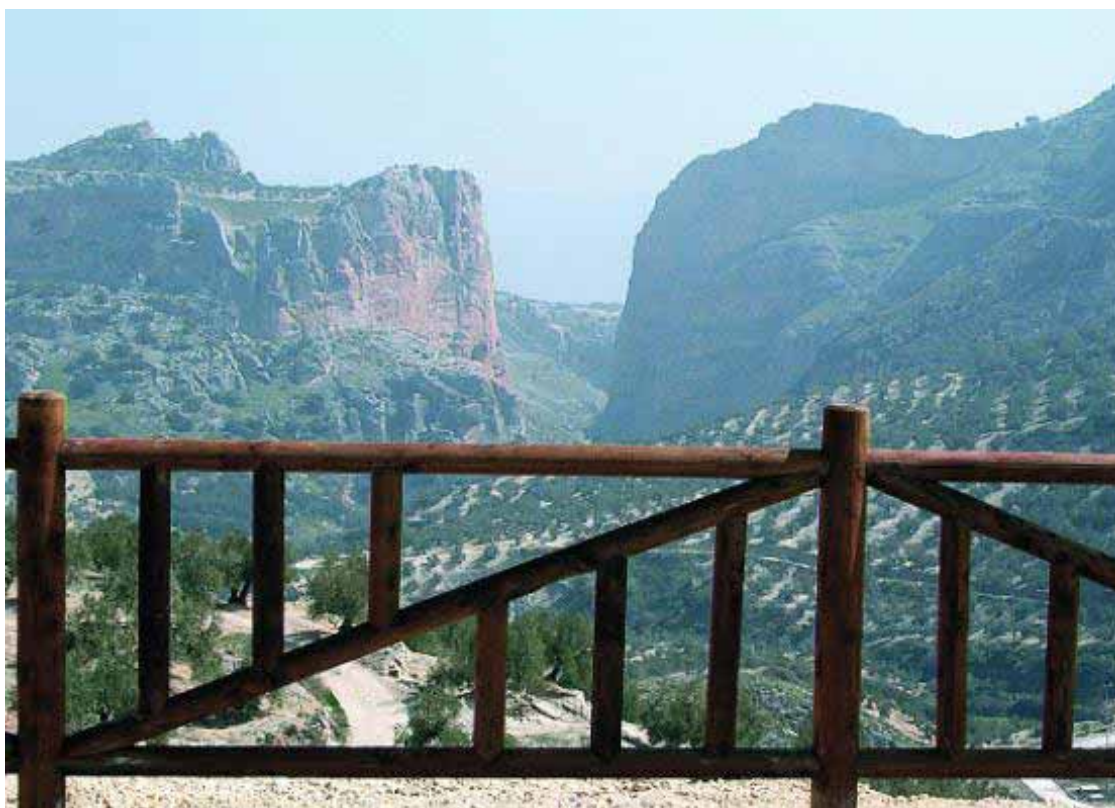
Panorámica de Los Villares desde el Mirador de Cabrahigos.

El nombre con el que se ha bautizado a este nuevo mirador, desde el que se ven unas magníficas panorámicas del municipio, le viene dado por encontrarse muy cerca de una higuera silvestre, "cabrahigo". ■