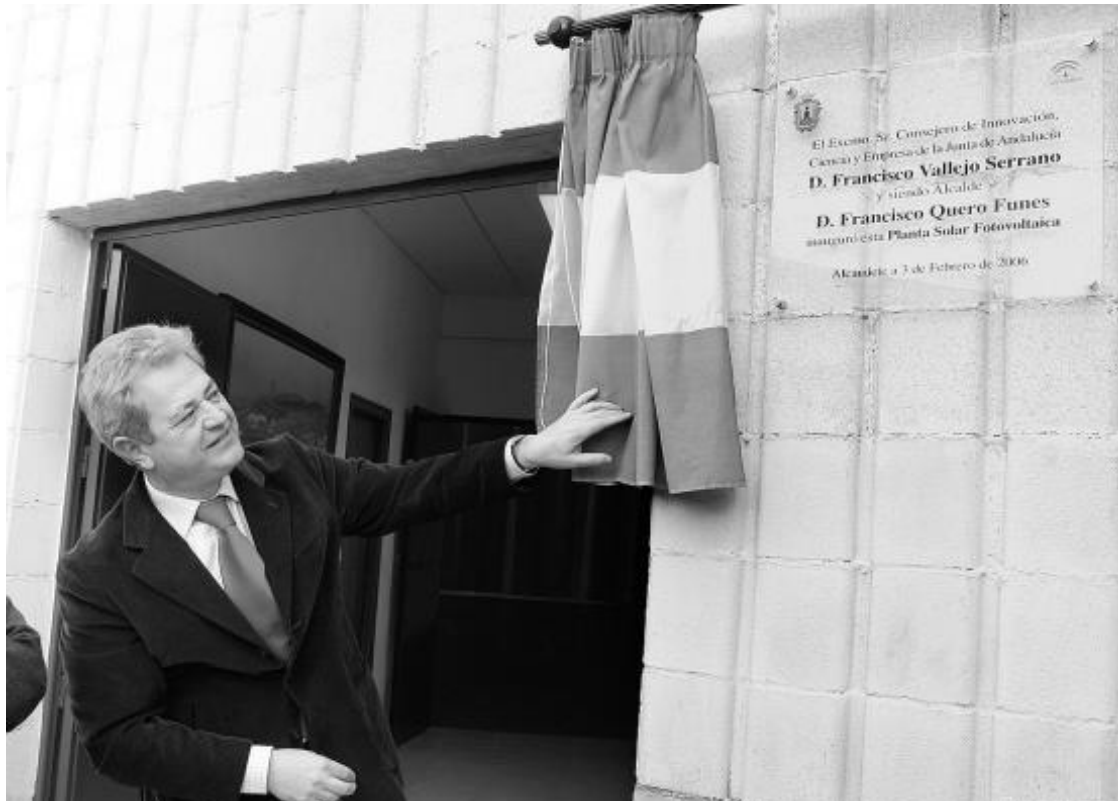
Inauguración de la planta fotovoltaica por el consejero de Innovación, Ciencia y Empresa.

A esta potencia se suma ahora la que aportará la nueva planta fotovoltaica, instalada en el polideportivo "José Enrique Vallejo" de Alcaudete y promovida por el Ayuntamiento con el respaldo de