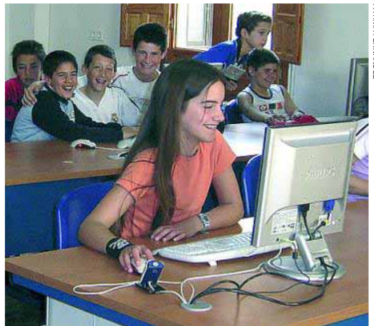
Centro Guadalinfo en Fuensanta de Martos.

Las reuniones con los jóvenes comenzarán próximamente con el objetivo de que el programa comience a funcionar en breve, coincidiendo con la llegada del buen tiempo y con una intensificación del denominado botellón en la localidad. ■