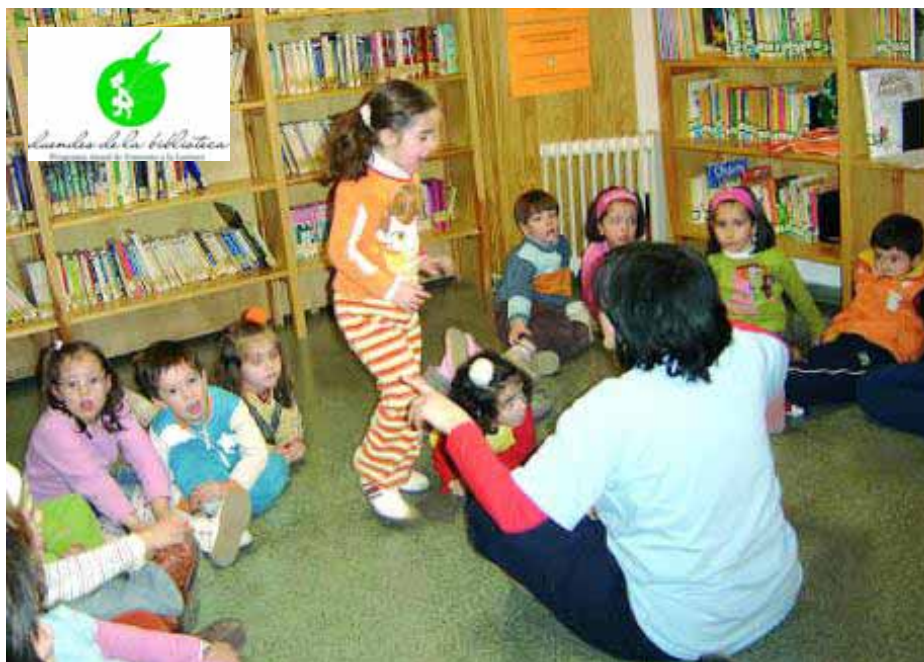
Sesión de cuentacuentos en la biblioteca.

tividades de música en la lectura completan el amplio repertorio previsto dentro de este plan anual de fomento de la lectura que persigue, ante todo que la población de Valdepeñas se acerque más a los libros de una manera divertida y principalmente gratificante. ■