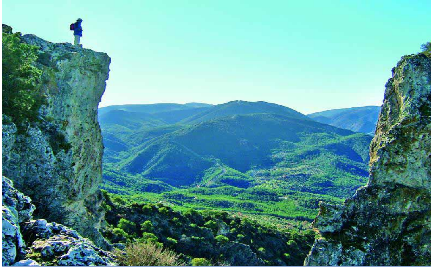
Panorámica de un paisaje de la Sierra Sur de Jaén.

TURISMO ■ Uno de los objetivos que persigue Adsur es el impulso de la actividad turística de la comarca ■ Se ha configurado el Plan de Dinamización, con el que se ha definido un eslogan para representar los diez municipios: "Sierra Sur de Jaén. Tierras de Romance y Leyendas"