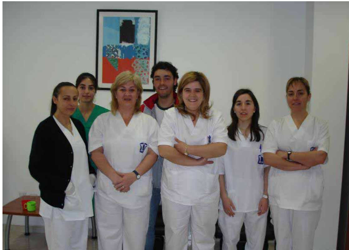
Personal que presta los servicios en la unidad de estancia diurna.

Desde las nueve de la mañana hasta las cinco y media de la tarde, estos mayores tienen a sus disposición un servicio de comedor, desayuno, almuerzo y merienda, que se alternan con actividades que propician la convivencia entre los propios mayores y el desarrollo de la au-