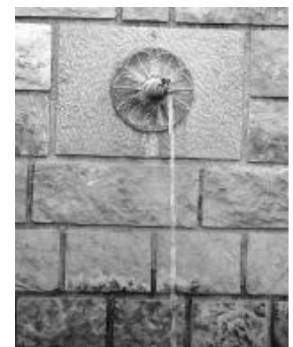
Fuente de Jamilena.

El Servicio Municipal de Aguas, que fue asumido directamente por el Ayuntamiento el pasado 1 de enero, tiene un buen funcionamiento. Sus instalaciones se encuentran en el nuevo edificio municipal, ubicado en la Urbanización Padre Rejas, y su horario de atención al público es de nueve de la mañana a una de la tarde, de lunes a viernes. El Consistorio jamilenense ha retomado este año la gestión directa del agua como una forma de acercarse más al ciudadano y a los problemas cotidianos que puede presentar este servicio básico.