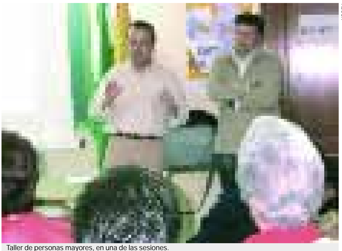
Taller de personas mayores, en una de las sesiones.

A lo largo de las doce sesiones se abordarán asuntos que interesan a la población mayor, como el régimen jurídico y financiero de la jubilación, la sexualidad en la tercera edad, las habilidades sociales y resolución de conflictos, los estereotipos sobre la vejez o la psicología de las personas mayores, entre otras cuestiones que preocupan a este colectivo. ■