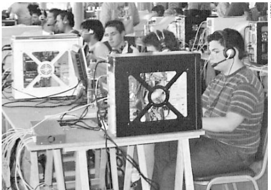
Participantes en la party celebrada el pasado año en Castillo de Locubín.

Finalmente, los asistentes a la party podrán resultar ganadores de alguno de los premios establecidos, cuya cuantía oscila entre 50 y 600 euros y material informático. Se han establecido tres modalidades: "Diseño Logo Party 2007", "Pro-Evolution Soccer" y "Counter-Strike". ■