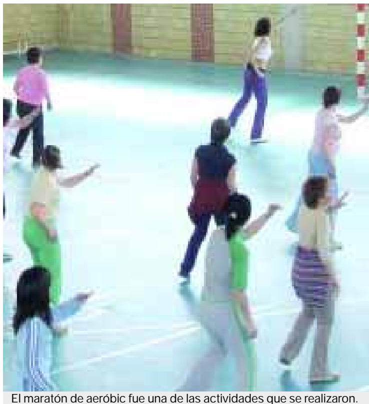
El maratón de aeróbic fue una de las actividades que se realizaron.

Ya el día 8 y con la colaboración de la asociación de mujeres de valdepeñas, tuvo lugar el acto conmemorativo del 8 de marzo con la lectura de un manifiesto y la degustación de chocolate y dulces por parte de un centenar de mujeres que asistió al acto. Finalmente, en el pabellón polideportivo municipal tuvo lugar un ma-