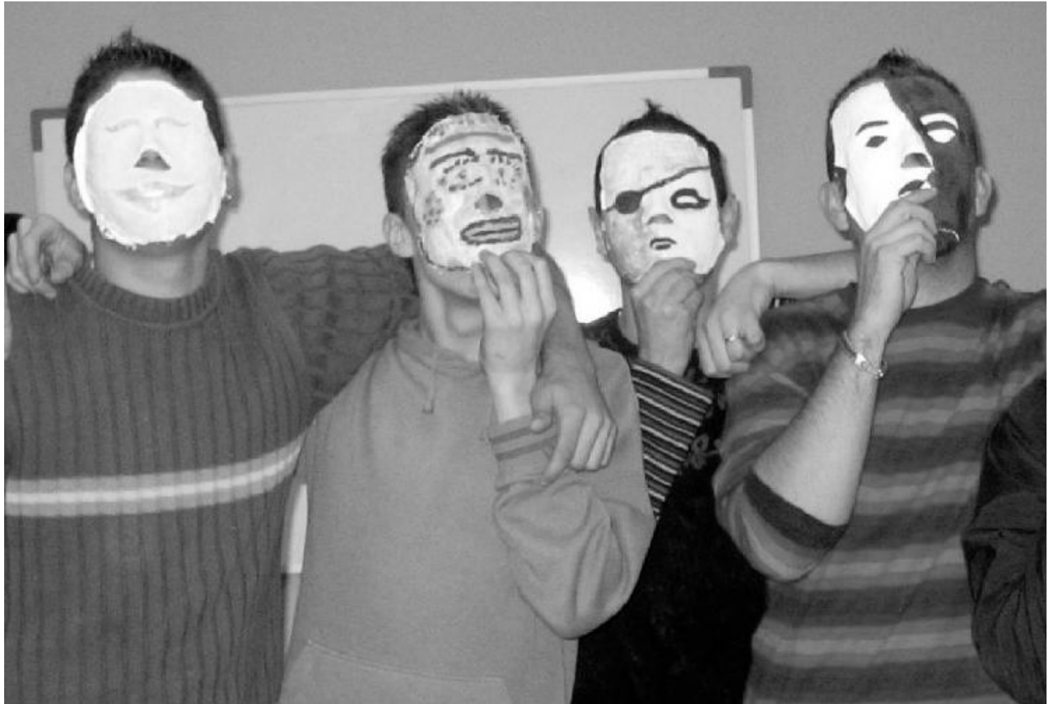
Jóvenes atendidos por la Fundación Ángaro-Proyecto Hombre de Jaén.

Básicamente Proyecto hombre es un programa terapéutico educativo, de deshabituación, rehabilitación y reinserción de las personas adictas. Con ellas se trabaja en tres áreas fundamentales, la individual, la familiar y el entorno social. Aunque los mayores