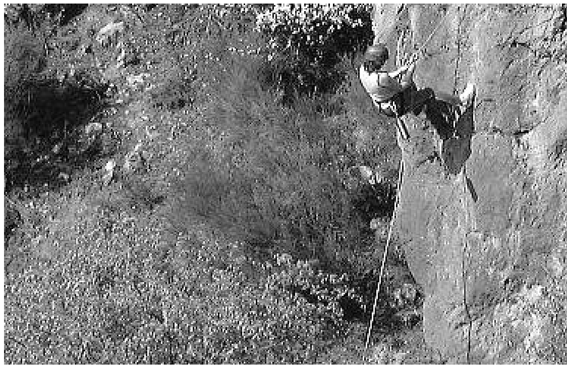
Desarrollo de una de las actividades al aire libre, organizadas por Adsur en un paraje de la Sierra Sur.

También se quiere fomentar la práctica de la captura y suelta, ya que todas las piezas pescadas serán devueltas nuevamente al pantano. ■