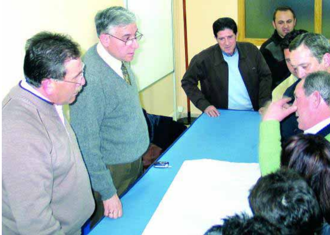
Responsables municipales analizan el proyecto con los vecinos.