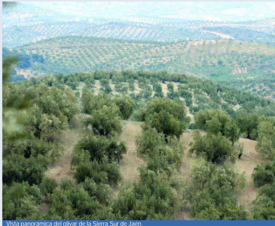
Vista panorámica del olivar de la Sierra Sur de Jaén.

Parte de esta tendencia reposa sobre la búsqueda del valor añadido a través de propiedades que multiplican el precio de un mismo producto en función de la calidad. Por ejemplo, una cualidad ambiental asociada a una cualidad sanitaria convierte a los productos ecológicos en productos más caros, de tal manera que una forma de producción deseable genera un alimento más caro. Del mismo modo, en el caso del aceite, una calidad organoléptica mayor multiplica el precio del aceite virgen y virgen extra, que cada vez más se incorporan a las lógicas de la alta gastronomía y se convierten en productos de lujo, en un momento en que buena parte de los sectores productivos evolucionan hacia esta especialización. También las protecciones jurídicas (denominaciones de origen, indicaciones geográficas protegidas) actúan, al mismo tiempo, como impulsores de esta dinámica, funcionando