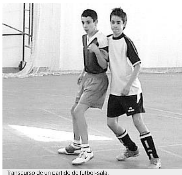
Transcurso de un partido de fútbol-sala.

En fútbol-sala, el sistema de competición es el de liga a doble vuelta, en las categorías de alevín e infantil. En la modalidad de cadete también se utiliza este sistema, pero se añade una jornada más, en la que jugarán el primer y segundo clasificado (para el primer y segundo puesto) y el tercero y cuarto, que se disputarán el tercer y cuarto puesto de la clasificación general. ■