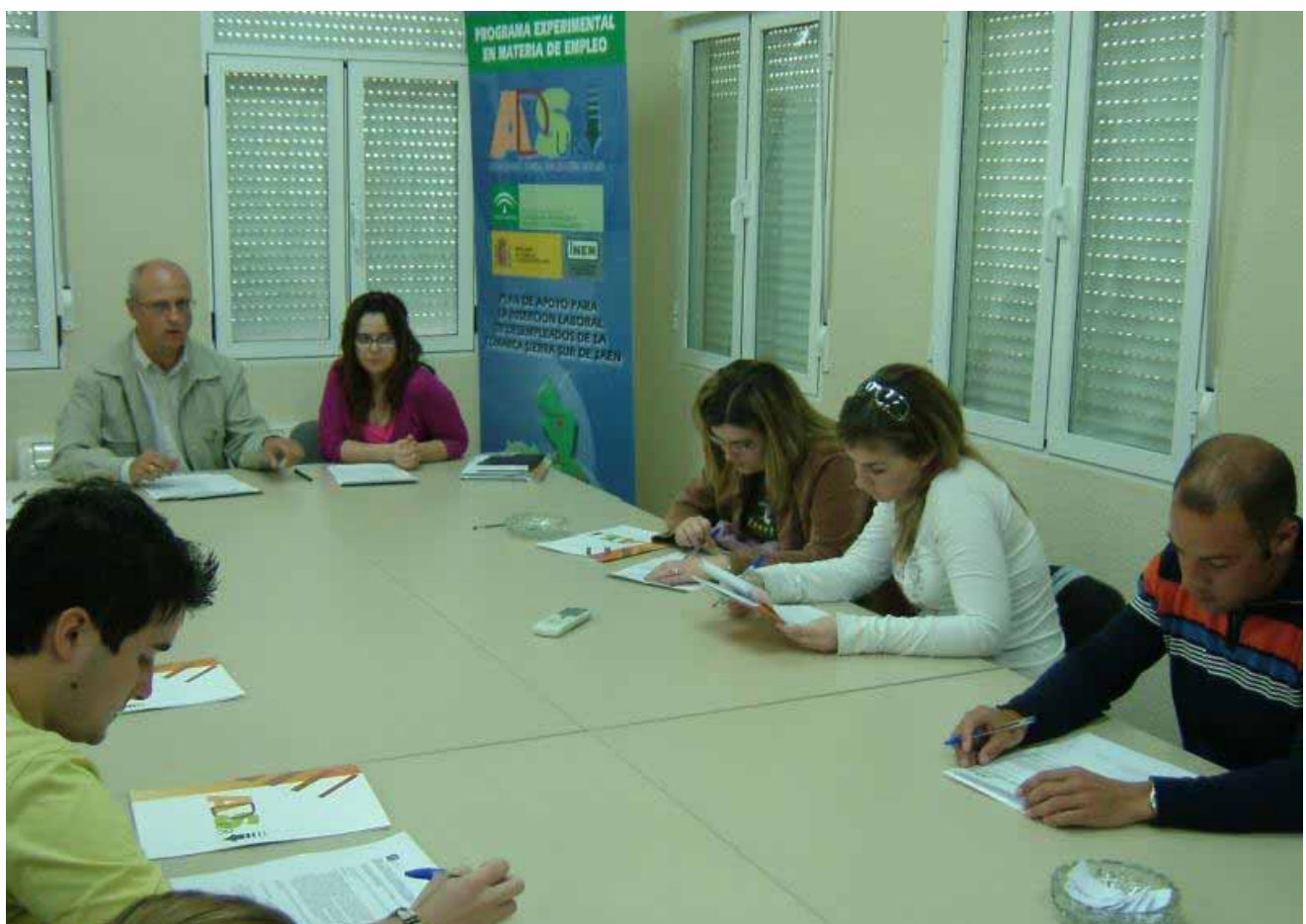
Firma de convenios para la realización de prácticas en la empresa Euroseper.