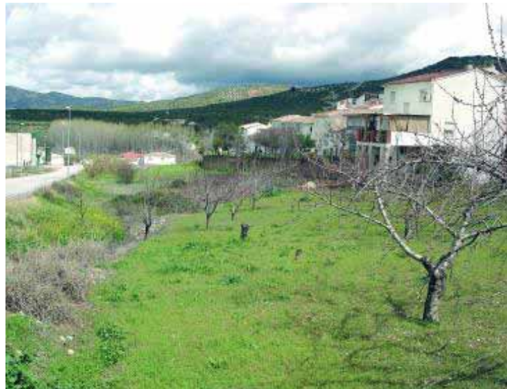
Solar donde se construirán las viviendas

Se trata de un proyecto ambicioso, dada la dificultad para encontrar terrenos edificables en la localidad. Actualmente, la Oficina Técnica Municipal ultima el proyecto, pero lo que hay previsto es que el Consistorio aporte para la construcción, el suelo, que ya ha sido adquirido, y termine la estructura básica de las viviendas: el tejado, fachada, puertas y tabiques interiores. A partir de ahí, la segunda fase correrá a cargo de