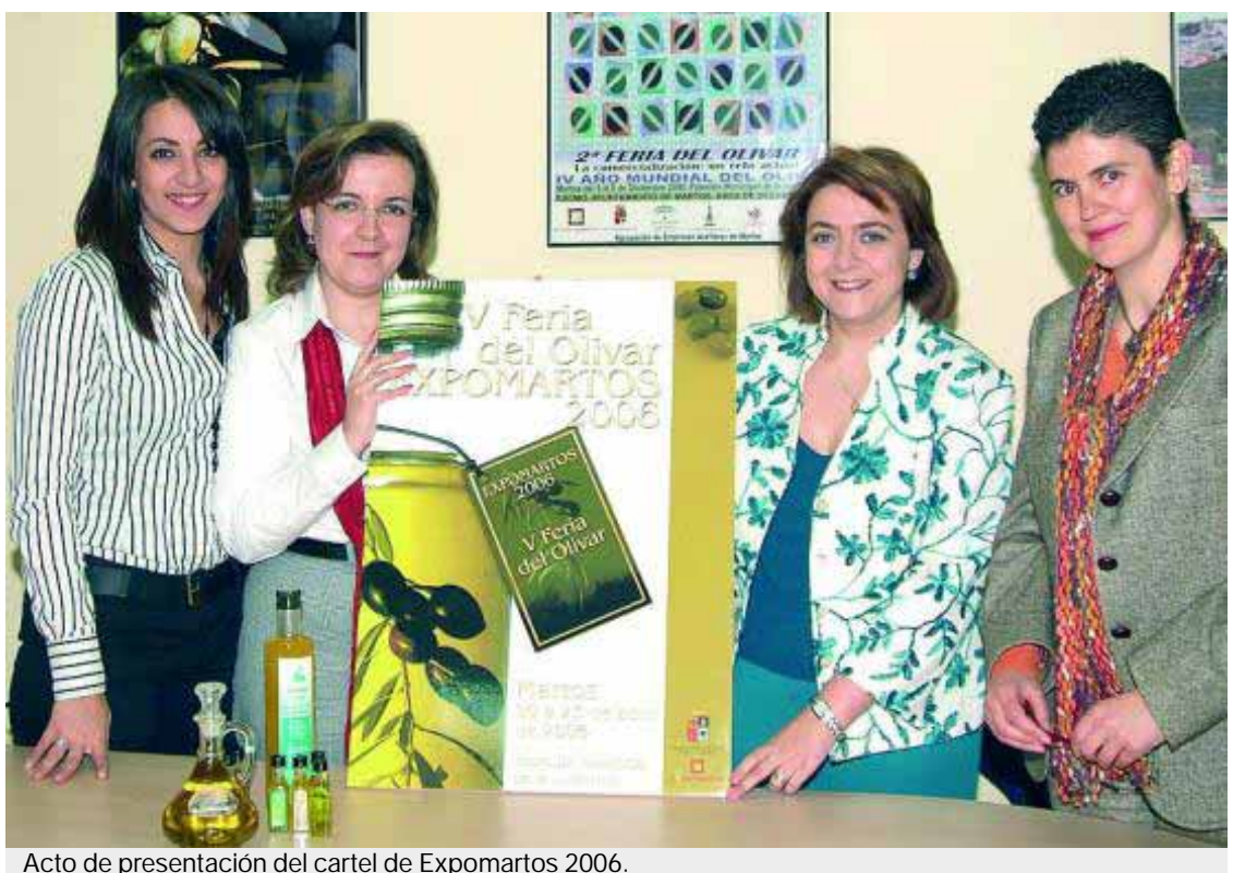
Acto de presentación del cartel de Expomartos 2006.

La programación, incluirá la celebración de unas jornadas técnicas y un amplio catálogo de actividades gastronómicas, culturales y divulgativas que complementarán la feria. ■