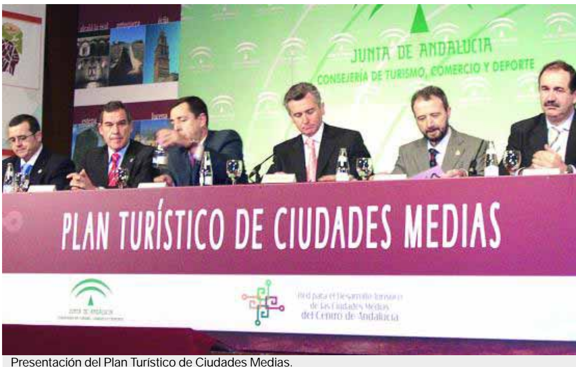
Presentación del Plan Turístico de Ciudades Medias.

El Plan contempla para Alcalá la Real la creación de un Centro Temático para el municipio, instalado en la Fortaleza de la Mota, así como la puesta en marcha de un itinerario turístico tematizado, que llevará por sobre nombre "La ciudad como frontera". En este último se incluirán tres puntos como ejes fundamentales: el Castillo de la Mota, la iglesia de San Juan y el Palacio Abacial. Por otro lado, se hará una señalización tematizada del itinerario. ■