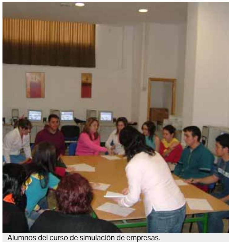
Alumnos del curso de simulación de empresas.

Técnicos de Adsur se encargarán de impartir las clases, con el apoyo de una prestigiosa empresa consultora. El Sefed es un programa que combina una metodología innovadora de aprendizaje, como es el caso de la simulación de empresas, con la amplitud de posibilidades que el perfil administrativo ofrece a los alumnos y a las empresas que contratan posteriormente. La metodología que utiliza el Sefed es la reproducción de situaciones reales por vía de la