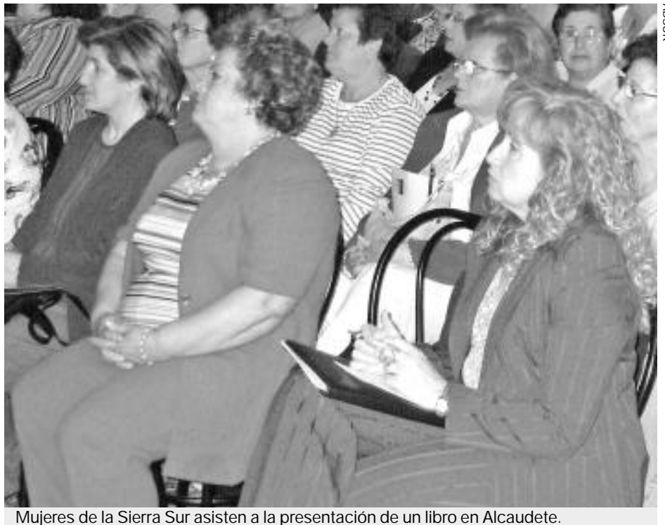
Mujeres de la Sierra Sur asisten a la presentación de un libro en Alcaudete.

Adsur propone la organización del I Concurso de Relato Corto Comarcal, dirigido a mujeres