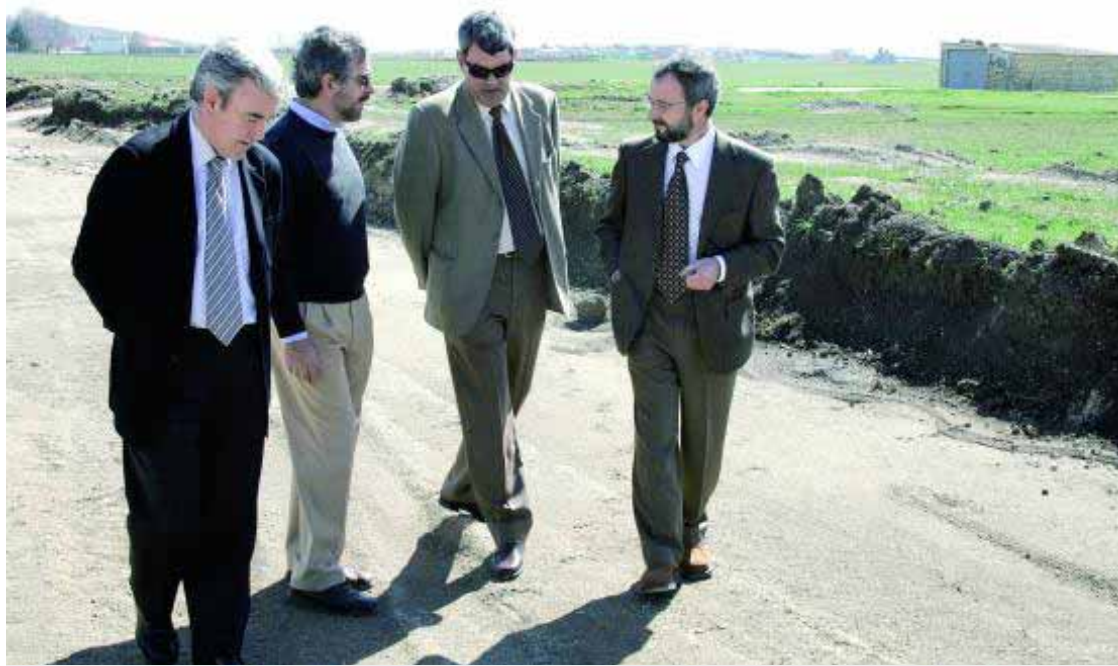
Visita de autoridades al Polígono Industrial Llano Mazuelos

El nuevo Plan recoge el carácter disperso de la población alcalaína, diseminada en 17 núcleos y con unas previsiones para los próximos ocho años de alcanzar los 23.437 habitantes. En cuanto a suelo urbano, se refleja la creación de 235 hectáreas con 12 unidades de ejecución, dos de ellas para uso industrial. Asimismo, se garantizan 220 hectáreas de suelo urbanizables. En cuanto a infraestructuras viarias, el PGOU prevé la conexión viaria entre la N-432 y la A-340 para mejorar la accesibilidad al nuevo polígono industrial. Por otra parte, se destaca que Alcalá la Real es un municipio declarado Conjunto Histórico Artístico desde 1967 y se relacionan 116 construcciones y elementos a proteger en el núcleo principal y 52 en las aldeas, junto a 86 sitios arqueológicos. De otro lado, se prevé la construcción de numerosas zonas verdes y espacios libres. ■