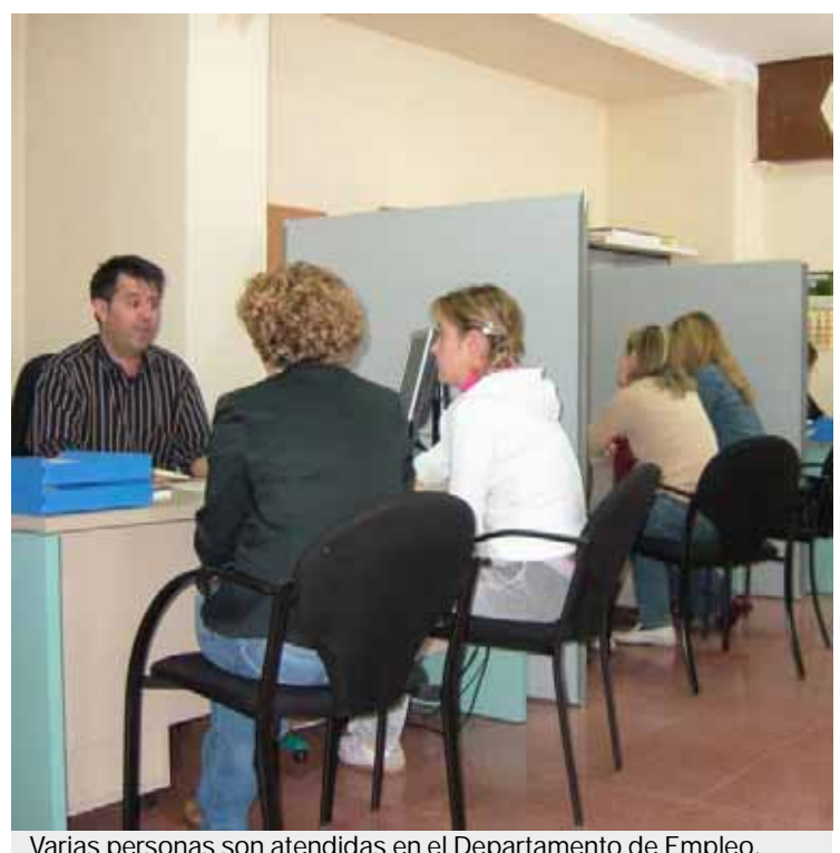
Varias personas son atendidas en el Departamento de Empleo.