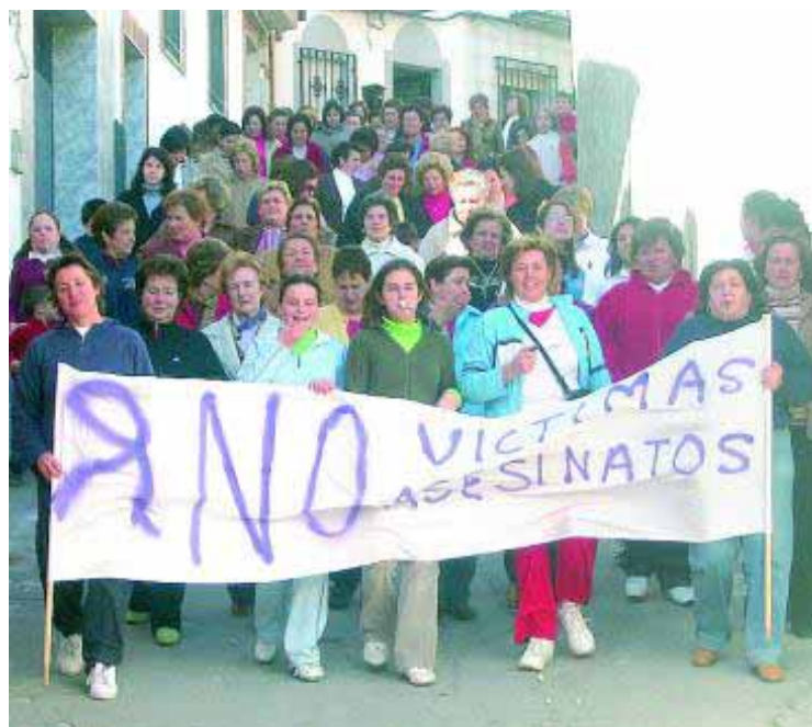
Manifestación del 8 de marzo por las calles de Los Villares.

También se han celebrado mesas redondas en las que se han abordado las desigualdades laborales y los yacimientos de empleo. El día 6 tuvo lugar la tradicional marcha por las calles de la localidad en contra de la violencia de género. Finalmente, el día 8, se celebró la "Gran Fiesta de la Mujer", en la Caseta Municipal. ■