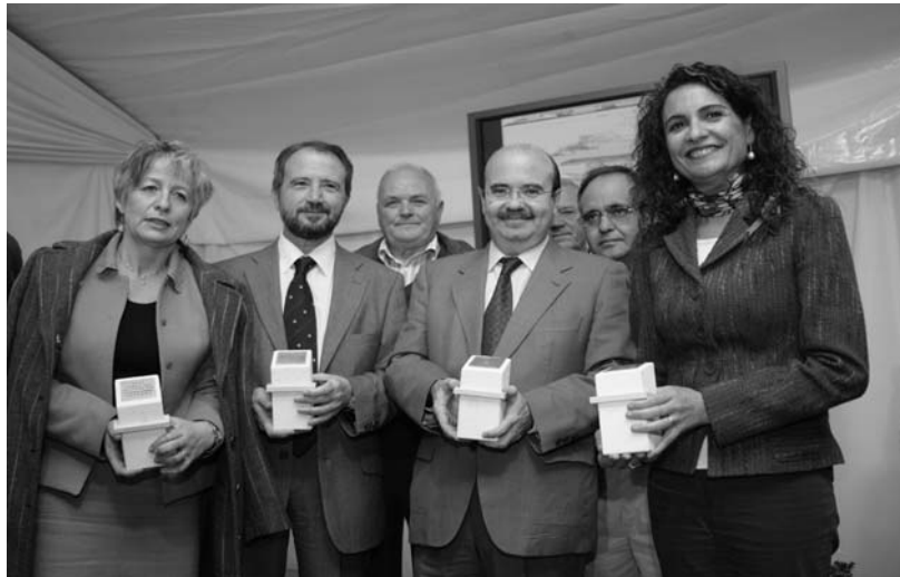
Autoridades, en el acto de colocación de la primera piedra.

El Hospital tendrá catorce consultas externas de las especialidades de medicina interna, cardiología, digestiva, neumología, cirugía general, traumatología y ortopedia, urología, oftalmología, otorrinolaringología, ginecología y dermatología. A ello hay que sumar rehabilitación y fisioterapia, análisis clínico, cuidados críticos y urgencias, y radiología.