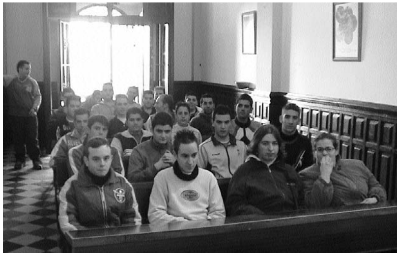
Presentación de la Escuela Taller de Jamilena.

En materia de vivienda, el alcalde también ha resaltado que en los últimos cuatro años la localidad se ha beneficiado del programa de rehabilitación de viviendas de la Junta de Andalucía, del que se han beneficiado numerosos vecinos de Jamilena. ■