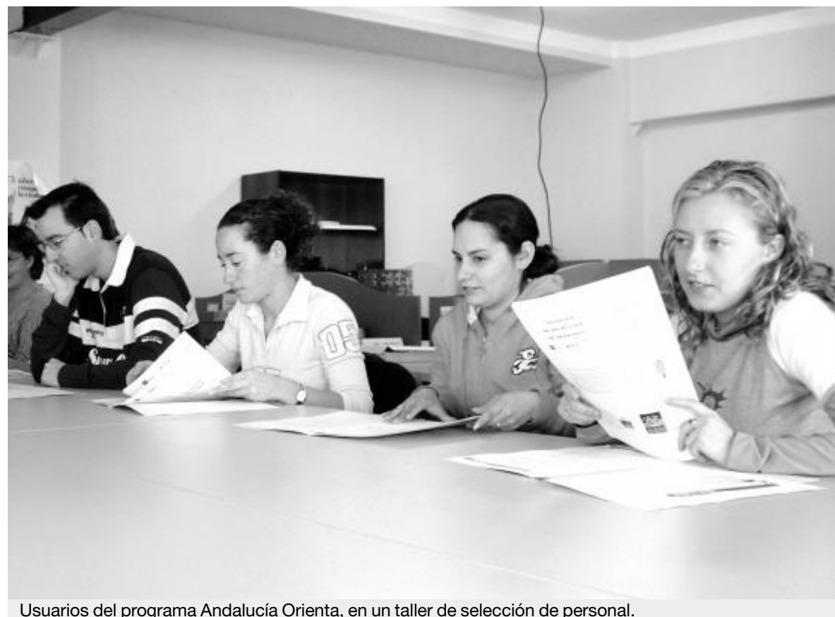
Usuarios del programa Andalucía Orienta, en un taller de selección de personal.

Numerosos empresarios de la zona se interesan por la contratación de usuarios en prácticas