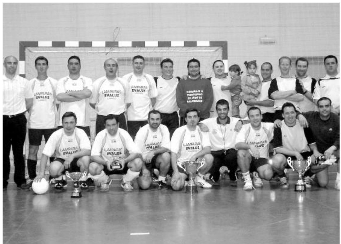
Equipos finalistas de la Liga de Veteranos: Inforcopy y Los Koleguitas.

Por otro lado, desde el mes de marzo, se desarrolla un curso de yoga en el que 25 alumnos tienen la oportunidad de aprender técnicas de relajación, estiramientos y meditación. ■