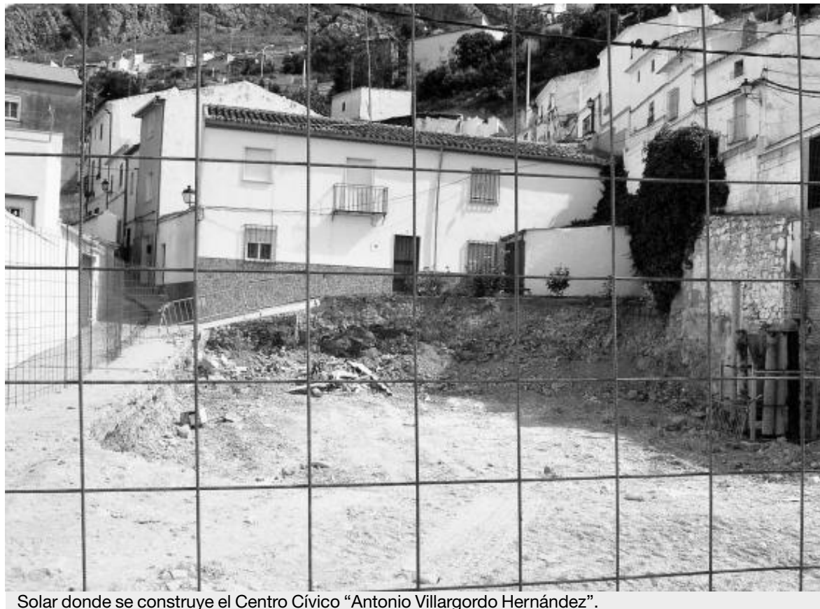
Solar donde se construye el Centro Cívico "Antonio Villargordo Hernández".

La planta baja albergará el centro de personas mayores. En el primer piso se espera poder contar en un futuro con una Unidad de Estancia Diurna y, en el segundo se instalará la futura sede de la Asociación de Vecinos "Fuente de la Villa San Amador". A esto se podría añadir una terraza y todo lo