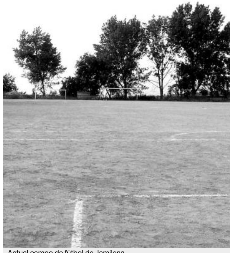
Actual campo de fútbol de Jamilena.

El nuevo convenio supondrá también la organización de varios eventos deportivos de primer nivel en la provincia de Jaén y la inversión de 18 millones de euros para el periodo 2006-2008, con acciones en materia deportiva que beneficiarán a 46 municipios de la provincia. Esa es la propuesta firmada el pasado 21 de abril y con ella se dará un valor añadido