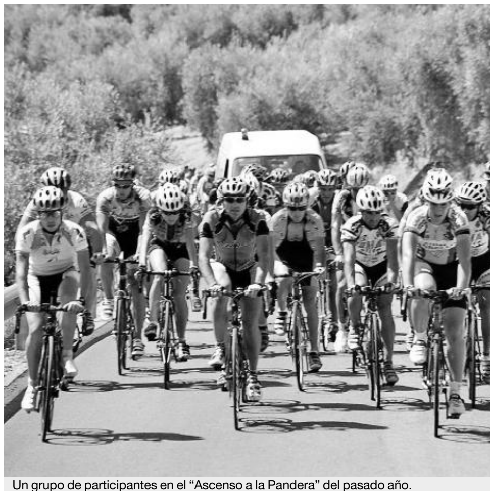
Un grupo de participantes en el “Ascenso a la Pandera” del pasado año.

mero de participantes que hagan todo el recorrido y al club desplazado desde mayor distancia con un mínimo de cinco participantes, que también realice el trayecto en su totalidad. Asimismo, recibirán un trofeo el participante de mayor edad de la comarca de la Sierra Sur de Jaén y el club o asociación de la zona con mayor número de participantes.