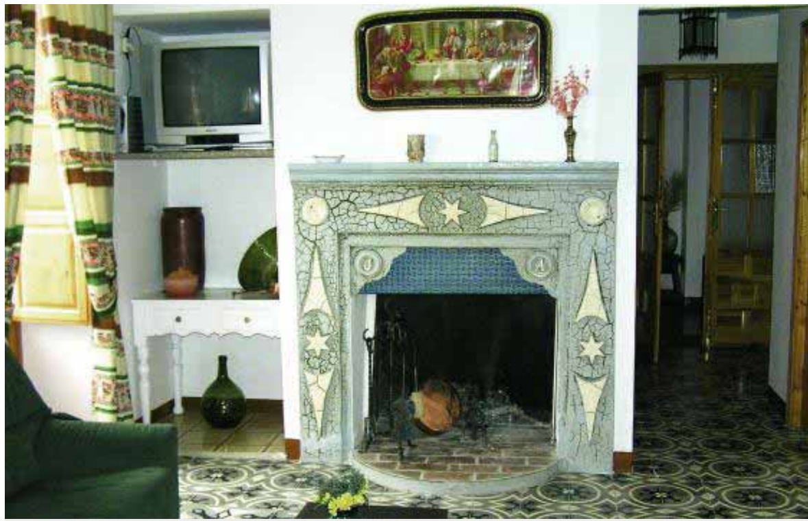
Vista de la chimenea situada en uno de los salones del alojamiento rural de Ribera Baja.

La comarca, en su conjunto, se promocionará bajo el mismo eslogan. Se pretende que entren a formar parte de este producto turístico sólo aquellos establecimientos que cumplan unas exigencias en cuanto a superficie, infraestructuras, equipamientos, capacidad de alojamiento, limpieza, seguridad y tarifas, entre otros aspectos. Unos requisitos que deberán comenzar por la inscripción en el Registro de Turismo. El objetivo último es ofrecer la máxima calidad a quienes elijan la Sierra Sur como destino turístico. ■