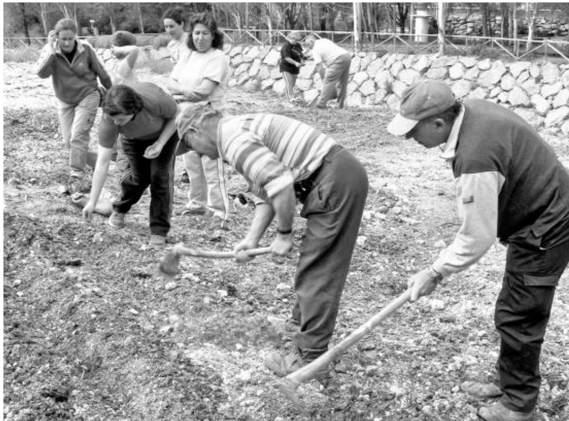
Alumnos del curso de Horticultura Ecológica, que se celebra en Castillo de Locubín.

A lo largo de los tres días que dura la feria podrán realizarse otras actividades, como talleres de extracción de semillas, injertos, producción local de semillas y agroecología. En el marco de este evento tendrán lugar las IV Jornadas Técnicas sobre Semillas y Recursos Genéticos en la Agri-