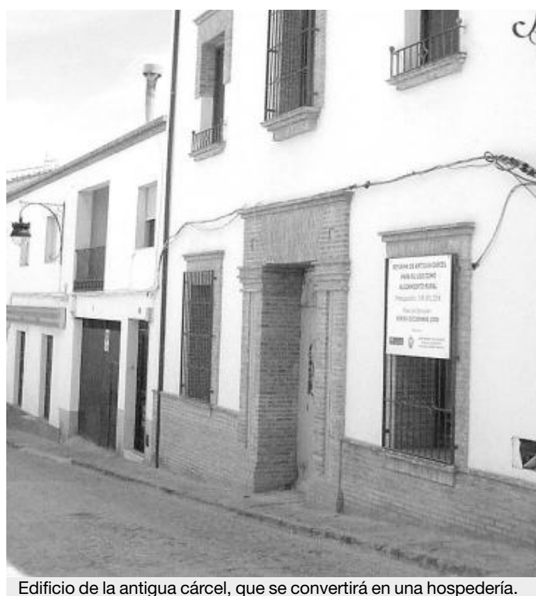
Edificio de la antigua cárcel, que se convertirá en una hospedería.

La capacidad del restaurante será de unas 50 personas en el comedor cerrado y de unas 80, si se añade la terraza de verano. La hospedería ofertará 18 plazas de alojamiento en total, distribuidas en habitaciones dobles e individuales. ■