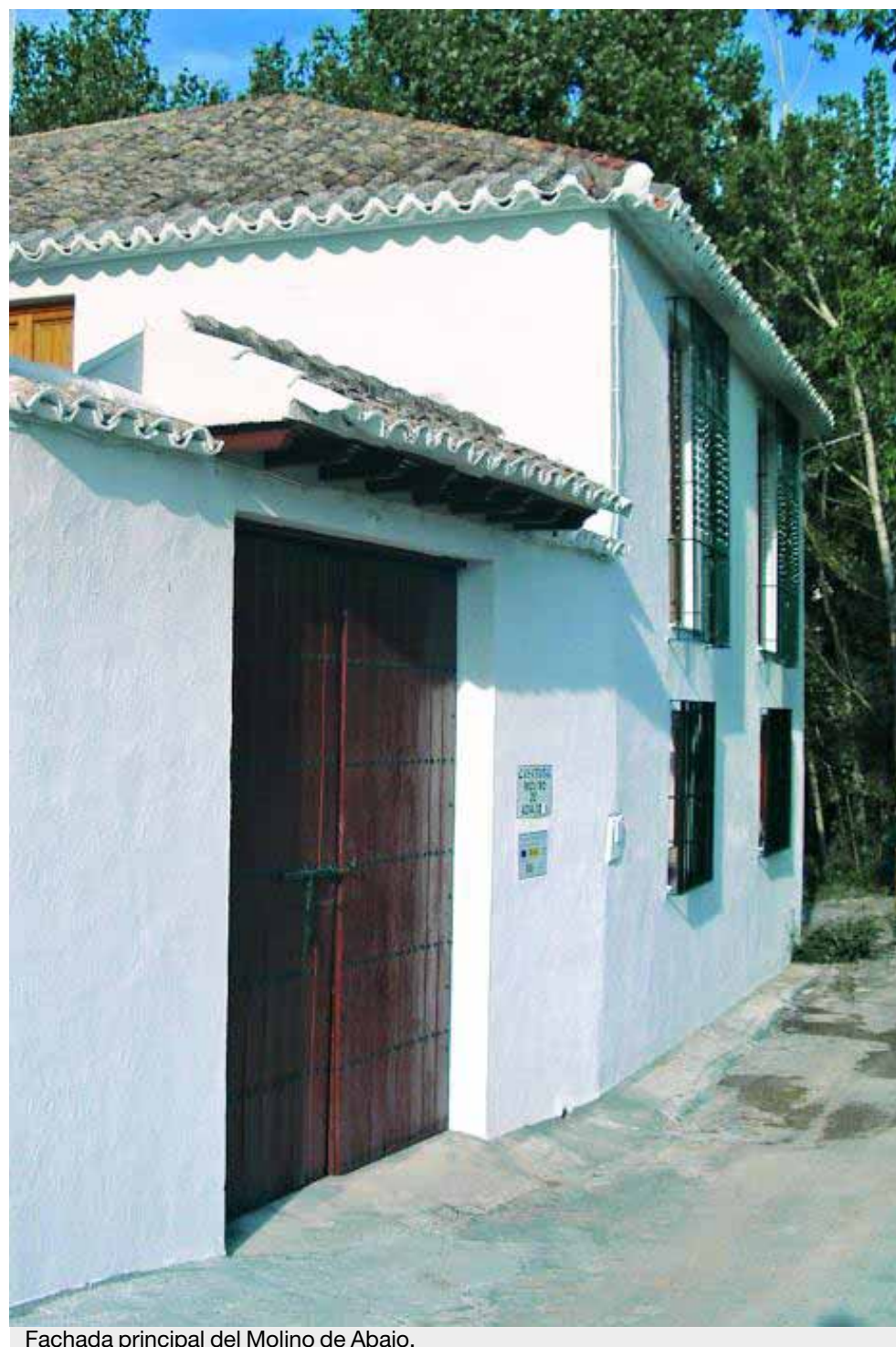
Fachada principal del Molino de Abajo.

Los turistas que visitan la aldea se marchan sorprendidos por la belleza paisajística de la aldea y, en general, de la Sierra Sur de Jaén