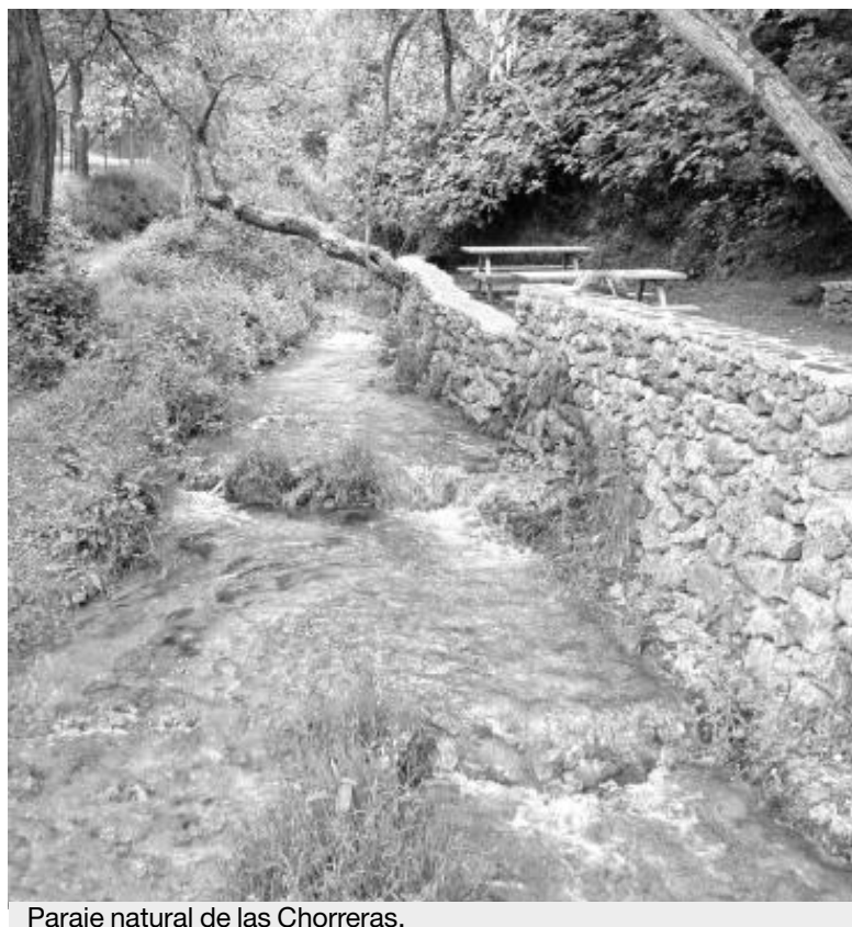
Paraje natural de las Chorreras.

Con estas obras se da solución a la queja de los vecinos de la zona, que denunciaban los malos olores, al tiempo que se amplía el entorno para el disfrute de valdepeñeros y visitantes. Este paraje goza de una ve-