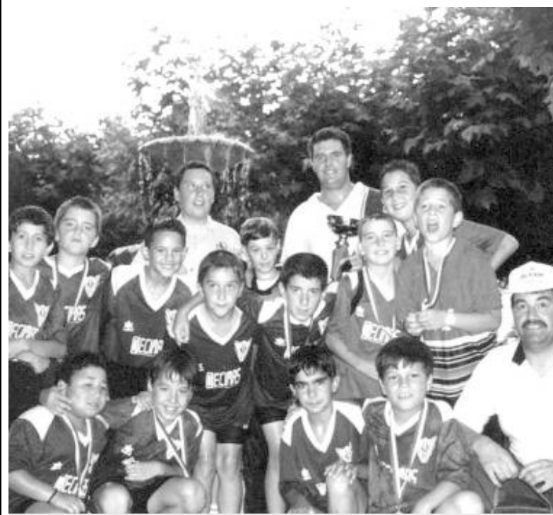
Equipo de fútbol de la población.

Otras actividades deportivas que se encuentran en el calendario de 2006 son el Aerobitón (previsto para el mes de septiembre, y que se quiere hacer coincidir con la inauguración del Pabellón Polideportivo), la gimnasia de mantenimiento y los campeonatos de feria. Una amplia oferta que no se olvida del colectivo de mayores. Para las personas de la tercera edad se ha previsto la realización de varias sesiones de gimnasia de mantenimiento. En este caso, y en todos los anteriores, las sesiones son impartidas por profesionales en la materia, que adaptan los contenidos al grupo. ■