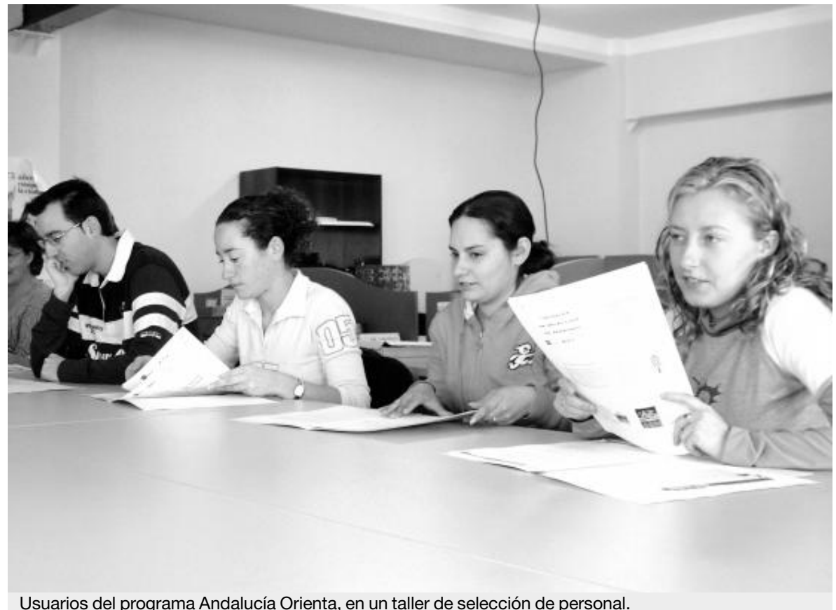
Usuarios del programa Andalucía Orienta, en un taller de selección de personal.

Numerosos empresarios de la zona se interesan por la contratación de usuarios en prácticas