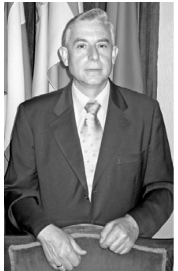
Blas Sabaleta, alcalde de Torredelcampo.

►En ambos aspectos estamos trabajando. El Ayuntamiento ha llevado a cabo un importante proyecto de arreglo de calles, gracias al programa “Urbanismo Comercial”. Se ha realizado una inversión de más de 600.000 euros para la mejora del casco urbano, donde se concentra gran parte del comercio tradicional, y que nos ha permitido el acondicionamiento de la zona con calles pe-