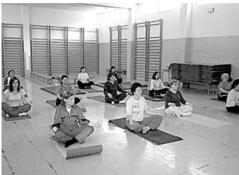
Sesión del curso de yoga.