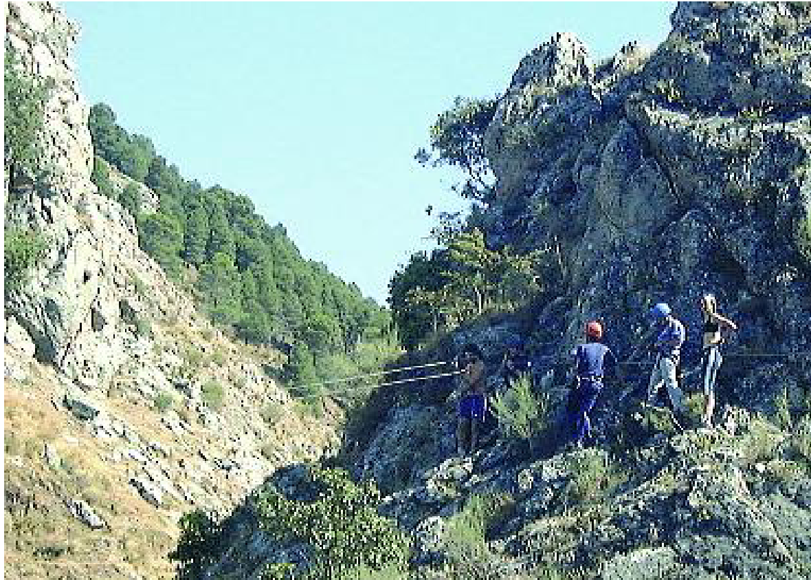
Tres jóvenes realizan actividades deportivas en la Sierra Sur de Jaén.

Este programa es una de las primeras acciones aprobadas en la junta directiva de Adsur encaminadas al desarrollo del sector del turismo. No obstante, la señalización se acompaña de otras iniciativas igualmente necesarias. En este sentido, uno de los obje-