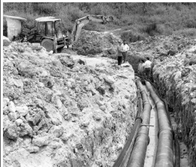
Conducción de las nuevas tuberías procedentes de Martos.

Asimismo, cuenta con una de las tasas de rendimiento más altas de la provincia en el aprovechamiento del agua, próxima al 80 por ciento. Es decir, sólo un 20 por ciento del agua que llega a los depósitos reguladores no se factura como consecuencia de averías o fugas. De igual modo, Torredelcampo es uno de los municipios de la provincia de Jaén con las tasas más bajas por su servicio de agua. ■