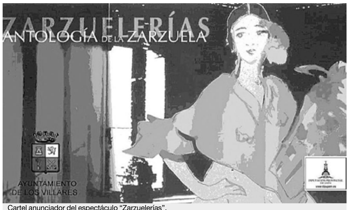
Cartel anunciador del espectáculo "Zarzuelerías".

El objetivo de este programa es impulsar y fomentar la cul-