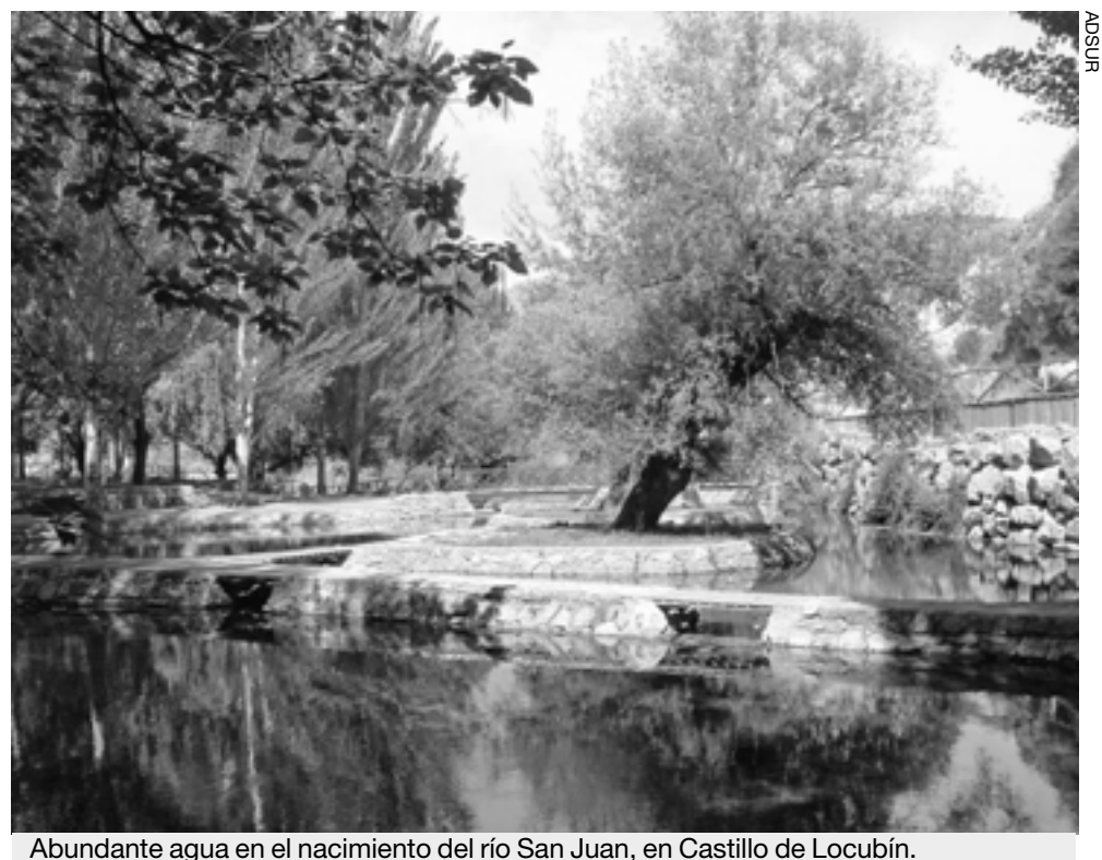
Abundante agua en el nacimiento del río San Juan, en Castillo de Locubín.

curso está dirigido a quince alumnos y tiene una duración de trescientas horas. Con esta actividad se cumple otro de los objetivos del Proyecto Himilce, que es fomentar el espíritu emprendedor en el medio rural, especialmente entre las mujeres. ■