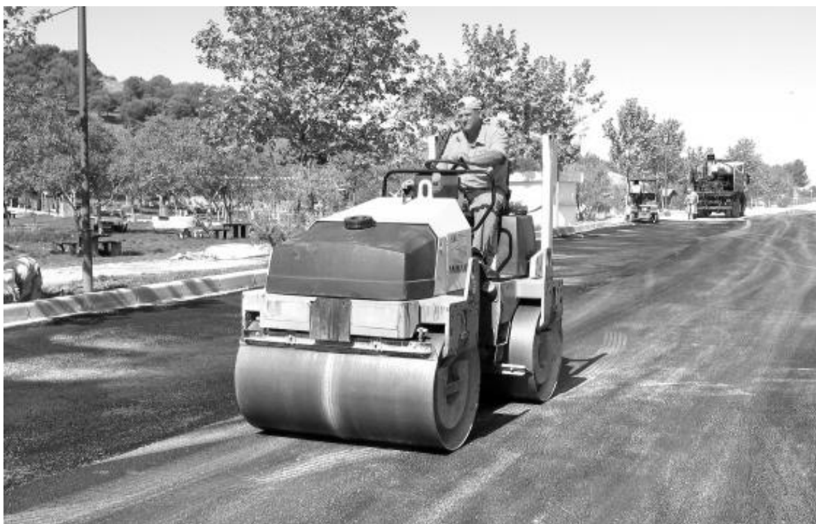
Realización de trabajos para la adecuación del entorno del Llano de Santa Ana.

OBRAS ■ El Ayuntamiento de Torredelcampo realiza importantes obras de mejora en el Parque Periurbano del Llano de Santa Ana, una de las zonas de esparcimiento más visitada por la población