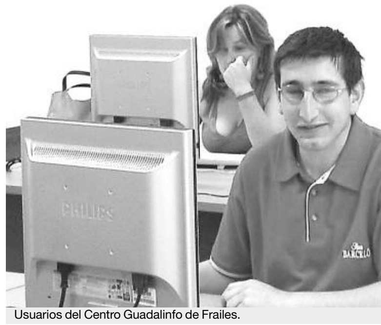
Usuarios del Centro Guadalinfo de Frailles.

En la actualidad se ultima la programación de actividades que se desarrollarán, que consisten, entre otras, en la organización de cursos de alfabetización digital básica. Según el monitor del Centro Guadalinfo de Frailles, numerosas mujeres, amas de casa y personas mayores las que han mostrado su interés en aprender a usar un ordenador. ■