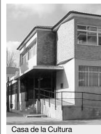
Casa de la Cultura

La Biblioteca Pública de Martos ha recibido una mención de honor de los VI Premios de Fomento de la Lectura, que otorga el Centro Andaluz de las Letras. La Casa Municipal de Cultura muestra su satisfacción por este nuevo reconocimiento a una dilatada trayectoria. Desde hace muchos años, la biblioteca organiza diferentes actividades culturales, como el concurso de marcapáginas, los encuentros con escritores o los clubes de lectura, que siempre han encontrado muy buena aceptación entre la población de Martos. ■