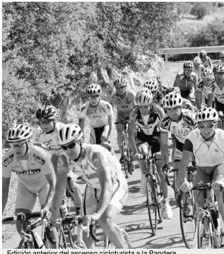
Edición anterior del ascenso cicloturista a la Pandera.

El certamen contempla la entrega de numerosos trofeos. Todos los participantes recibirán un obsequio recordatorio una semana antes de la prueba y las mujeres tendrán un regalo especial. En cuanto a los trofeos, se entregarán al participante de mayor edad que haga el recorrido completo, a los tres clubes con mayor nú-