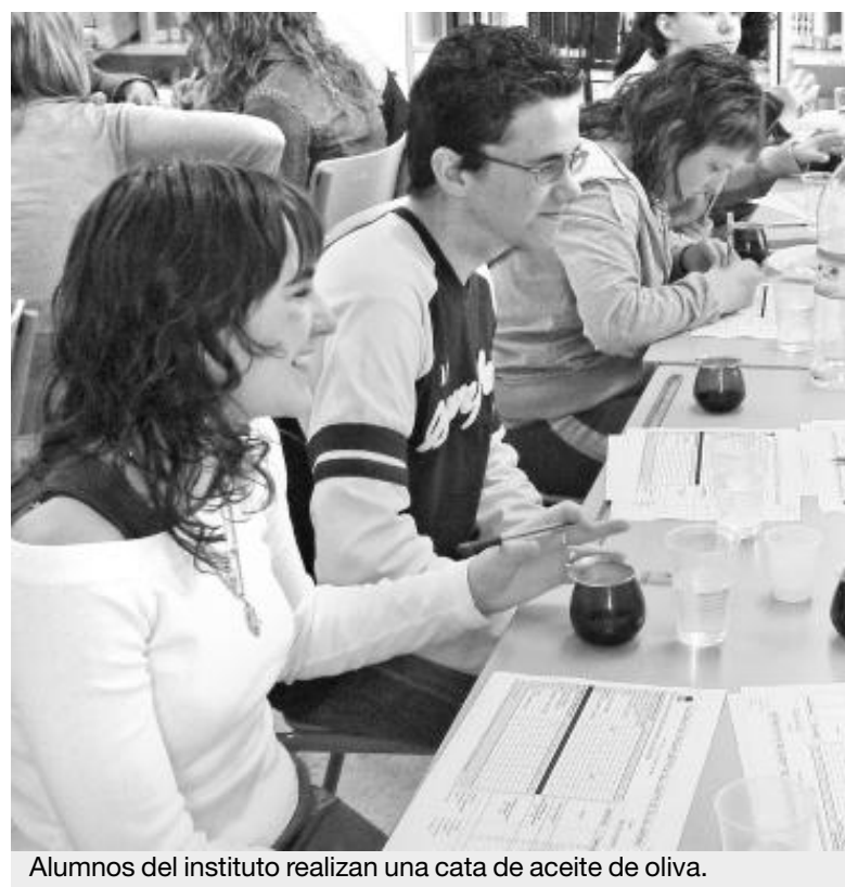
Alumnos del instituto realizan una cata de aceite de oliva.

La empresa ofrece al sector oleícola la caracterización de sus aceites de oliva virgen y asesoramiento para mejorar la calidad. Para ello, cuenta con expertos catadores. Uno de sus objetivos es la organización de jornadas de divulgación sobre diferentes aspectos, como la salud y la tradición de los aceites de oliva. ■