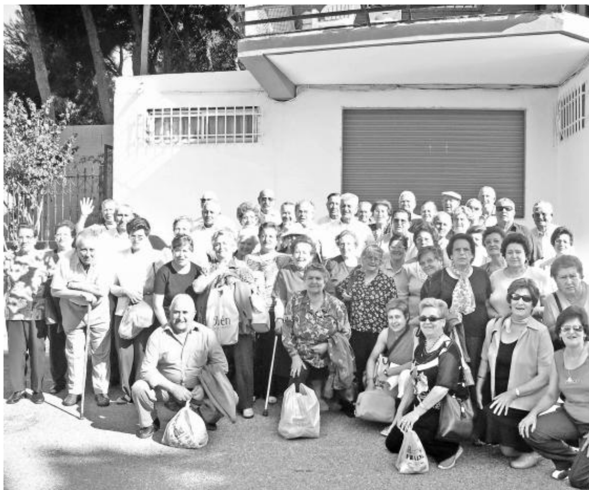
Foto de familia de los asistentes al viaje a la playa.

Los afortunados en poder disfrutar de la estancia en una residencia de tiempo libre, situada en la playa, tuvieron la suerte de ir acompañados por