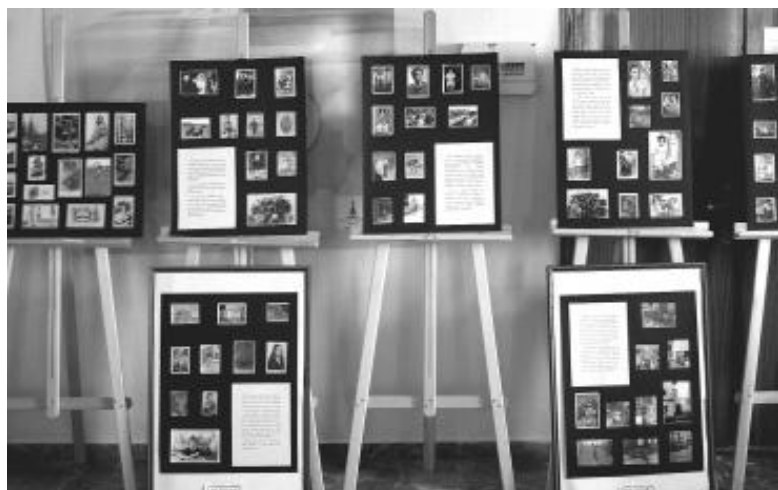
Exposición de fotografía en el Centro Guadalinfo.

Así, se ha llevado a cabo una exposición de fotografía antigua y otra exposición muy interesante sobre la historia y evolución de los pasos de Semana Santa en Fuensanta, iniciativa que, aun-