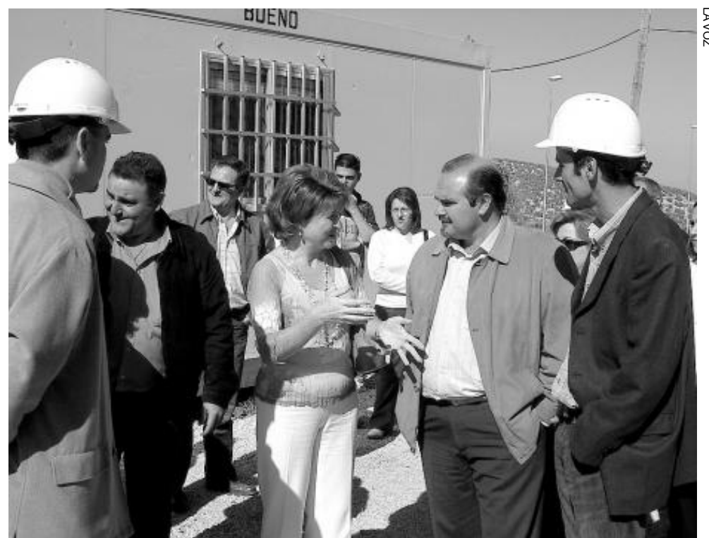
Visita de la delegada de Educación y del alcalde de Jamilena a las obras del instituto.

El nuevo instituto de Jamilena, que abrirá sus puertas en septiembre, tiene 2.400 metros cuadrados