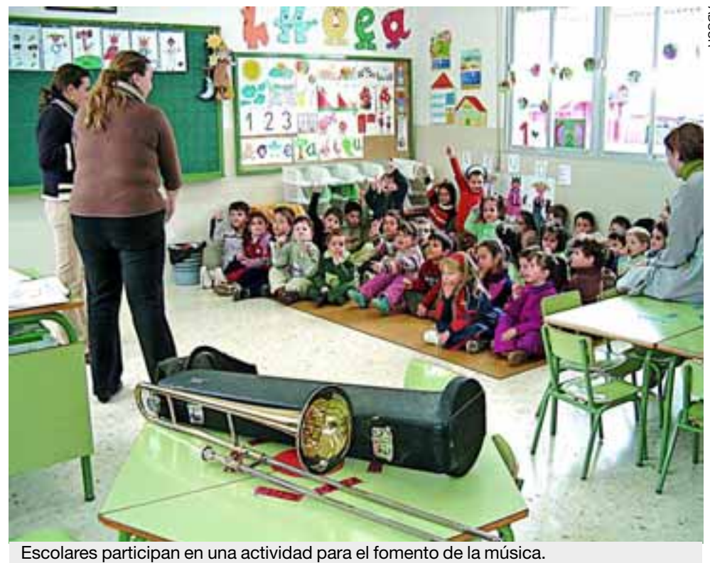
Escolares participan en una actividad para el fomento de la música.

El taller de mayores "¿Qué debemos saber para disfrutar de esta etapa de la vida?" se celebrará en Ventas del Carrizal, a petición de la Concejalía de Cultura de Castillo de Locubín. La actividad está dirigida a personas mayores de 55 años, a las que se les facilitan