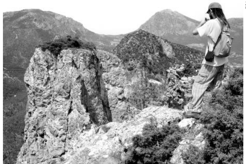
Uno de los participantes en la ruta fotografía el paisaje serrano.

La ruta de los quejigos centenarios además de tener un gran interés natural, ya que se adentra en los parajes más vírgenes de la Sierra Sur, tiene también la singularidad de mostrar algunos de los quejigos más viejos y de ma-