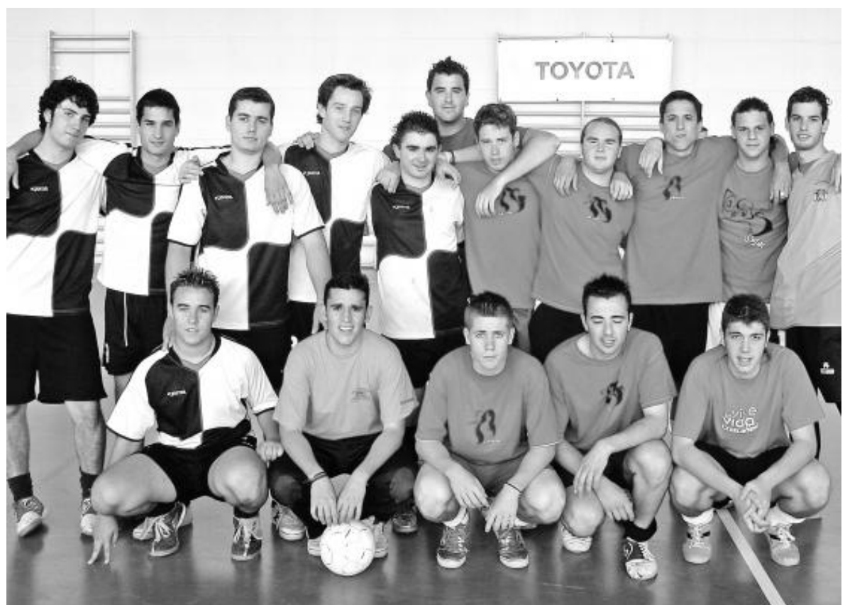
Equipos finalistas del Maratón de Fútbol Sala: Periches y Carpe Diem.