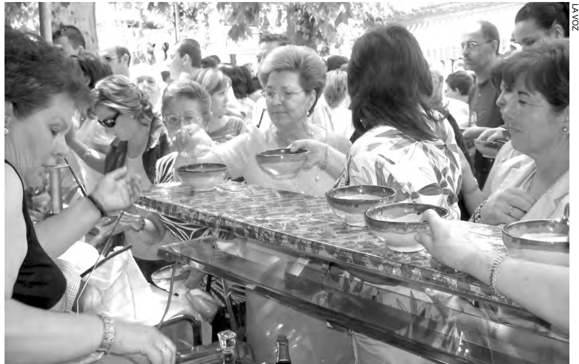
Vecinos degustan el tradicional "oreganillo" en una celebración anterior.

El arte también ocupa un espacio destacado en la Fiesta de la Cereza. Por ello, se organiza la exposición de pintura "Artlocubín 2008", en el antiguo colegio Miguel Hernández. Para los aficionados al deporte, se organiza el maratón de fútbol sala y para los más pequeños, el certamen de dibujo infantil y juvenil "Fiesta de la Cereza". No obstante, el acto central de la celebración es la exposición gastronómica, que se desa-