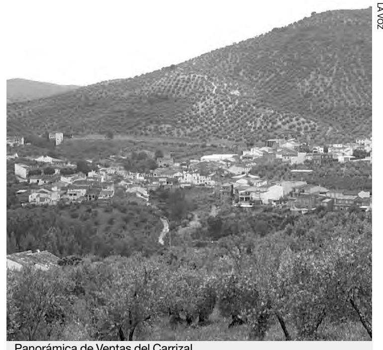
Panorámica de Ventas del Carrizal.

continuaron desde bien temprano con una cabalgata de gigantes y cabezudos que recorrió las principales calles. A las once de la mañana se celebró la santa misa en Honor al Patrón San Antonio de Padua y, ya por la tarde, se desarrolló la procesión de la imagen acompañada por las autoridades locales, hermanos y banda de música. En la jornada del domingo se celebró la exhibición de trial 4x4 y la invitación de la alcaldesa pedánea a una copa, antes de dar por concluida la celebración de la Feria de San Antonio. ■