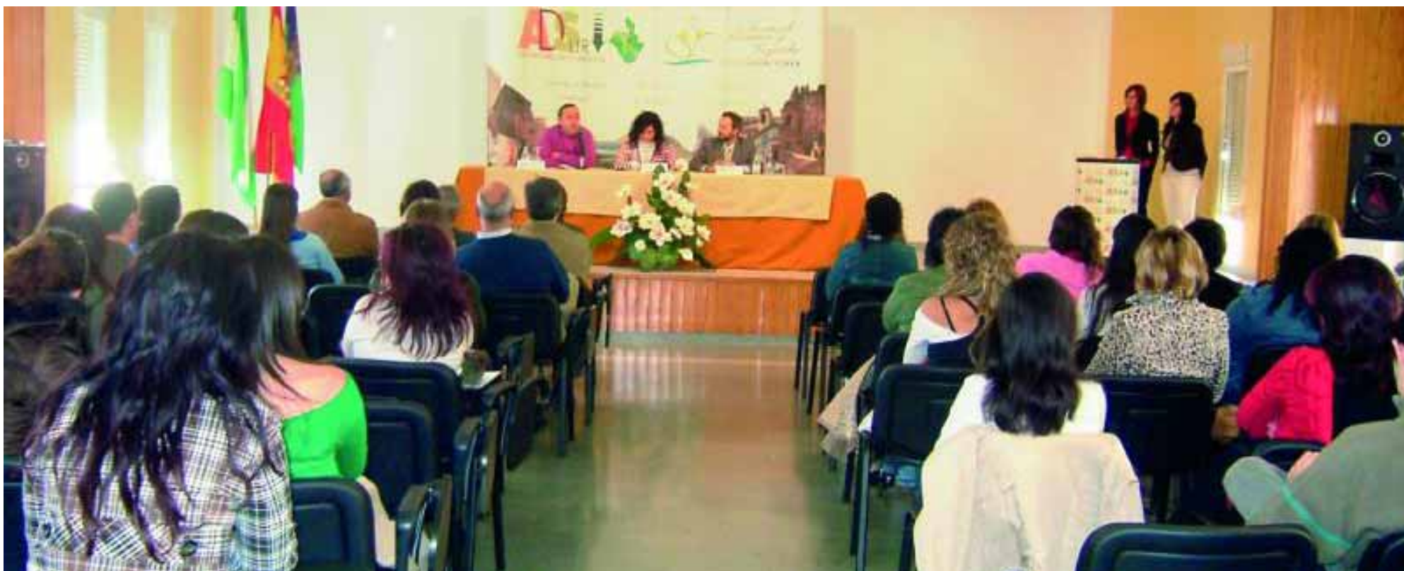
Acto de presentación del Plan de Actuación Global o Programa Líder para la Sierra Sur de Jaén.