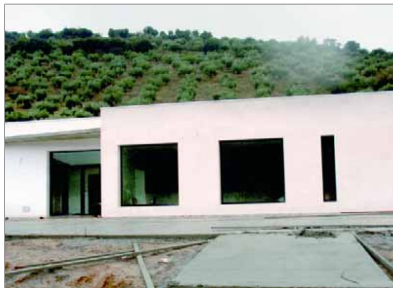
Aspecto exterior del edificio que albergará el tanatorio.

El espacio contará, asimismo, con otra dependencia para cafetería-comedor, donde se dispondrá de una máquina expendedora de café. Todas las estancias incluirán un sistema de climatización. En la zona exterior quedará ubicado un amplio aparcamiento. La puesta en