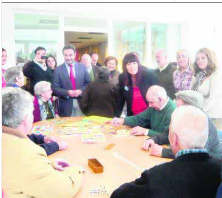
Las autoridades participan en la inauguración del servicio.

La entrada en funcionamiento supuso la creación de 25 puestos de trabajo directos y otros indirectos. El recinto está gestionado por la empresa Agevesa, que también, se ocupa, desde su apertura, de la unidad de estancia diurna existente en el municipio de Castillo de Locubín. La puesta en marcha del servicio redonda en beneficio de la ciudadanía castillera.