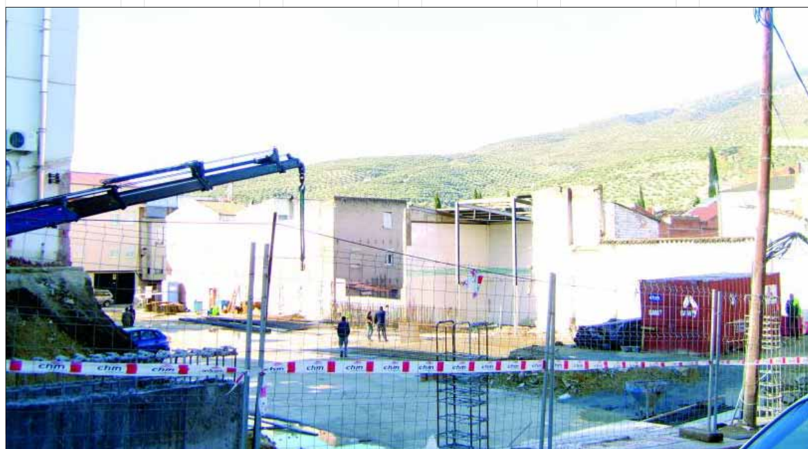
Zona en la que se construirá el aparcamiento municipal de Los Villares.

Después del derribo de las tres viviendas, que el Ayuntamiento de Los Villares adquirió para ampliar el terreno que perteneciente a la antigua cooperativa destinado para el aparcamiento público, el nuevo centro de salud villariego y una plaza, comienzan las obras del nuevo aparcamiento público. El pleno municipal adjudicó la intervención a la constructora Hormigones Martínez S. A. Las instalaciones contarán con setenta y dos plazas para estacionar, cuatro de ellas reservadas para personas con discapacidad. Habrá tomas eléctricas para vehículos eléctricos. Se trata de uno de los proyectos representativos del actual equipo de Gobierno.