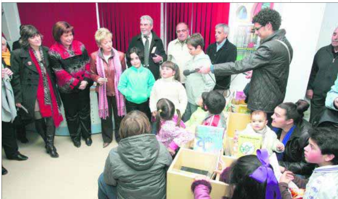
La delegada de Cultura, autoridades locales y vecinos asistieron al acto inaugural.

El Ayuntamiento pone en marcha un año más el dispositivo de los centros de atención para hijos de trabajadores temporeros que, como principal novedad, abren este año los domingos. En total funcionan esta campaña seis guarderías, tres en el casco urbano y tres en aldeas, lugares donde ha habido mayor demanda y se ha llegado a la ratio de 10 niños por centro. De este modo funcionan las instalaciones ubicadas en la SAFA y en los colegios Alonso Alcalá y José Garnica en el casco urbano de Alcalá la Real y en las pedanías de La Pedriza, La Rábida y Ribera Alta.