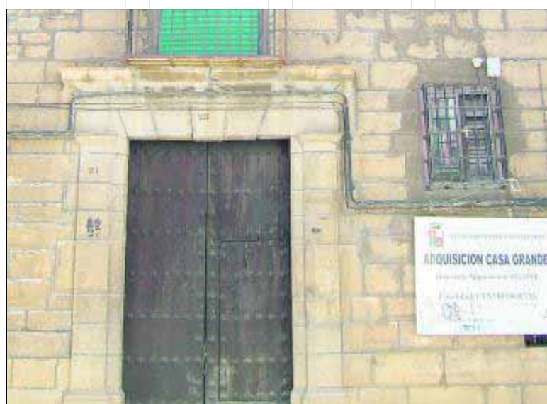
Fachada del histórico inmueble ubicado en la zona centro.

propone la recuperación de todo elemento de valor patrimonial y de la imagen esencial del inmueble original. Se restaura y se pone en valor el patio central, como elemento fundamental y estructurador. El patio trasero, resto de los antiguos huertos, se transformará en un edificio nuevo y estará conectado con el inmueble principal mediante una serie de galerías.