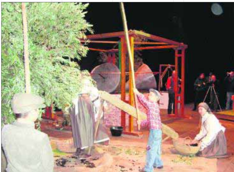
Recreación simbólica de la recolección de la aceituna.

tando por la celebración muchos. Este año como novedad, el teatro municipal acogió una representación simbólica de todo el proceso que permite transformar el fruto del olivo centenario en oro líquido. También se realizó la ofrenda floral al monumento de los aceituneros y se repartieron más de 8.000 hoyos entre los asistentes que pudieron degustar aceite en la popular celebración que, en 2010, resultó, muy concurrida.