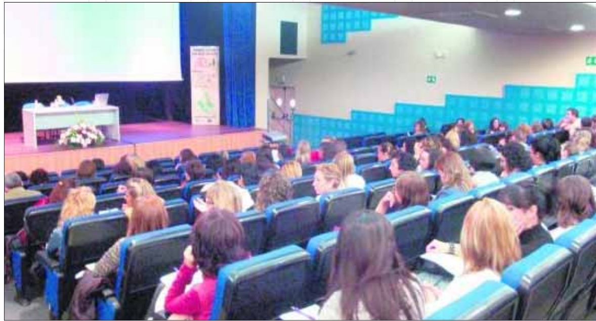
Participantes en las II Jornadas de Empleo de la comarca.

En esta primera ponencia también se dio a conocer la "Guía de Recursos de Empleo", realizada por ADSUR, como herramienta de trabajo eficaz y ágil en