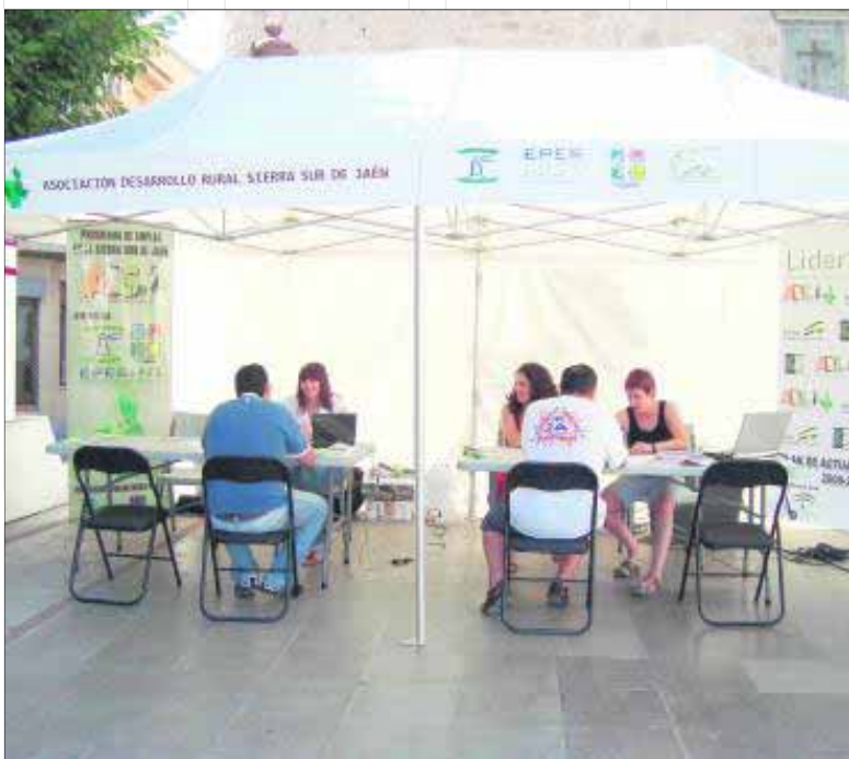
Carpa informativa en Castillo de Locubín.

Asimismo, durante el periodo de prácticas las personas demandantes de empleo adquirirá la experiencia que le falta a su currículum y recibirá una beca mensual de trescientos noventa y nueve euros. En segundo lugar, el Programa de Acciones Experimentales tiene por objeto la inserción laboral, realizando por un lado, la gestión directa de ofertas de empleo y ahorrando así a las empresas los costes que les supondría una selección de personal.