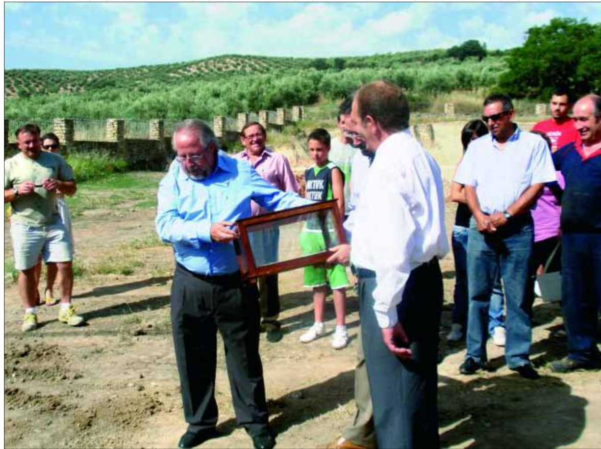
Las autoridades participan, el pasado verano, en la colocación de la primera piedra.

mente se aplicaban las aguas eran, básicamente tres: baño, bebidas y en chorro. En el segundo caso, el líquido tenía la propiedad de estimular la mucosa gástrica y, así, aumentar la tonicidad del órgano. El baño aumentaba la vitalidad de la piel y le daba mayor energía y consistencia. Por último el chorro, por su acción mecánica, servía de estimulante eficaz ante multitud de enfermedades. Tras un