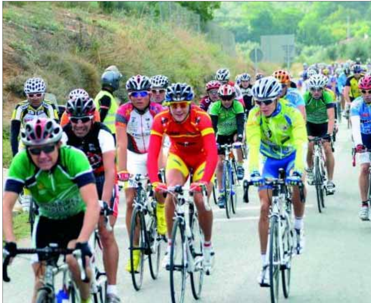
Participantes en la octava Ruta Cicloturista de Ascenso a la Pandera organizada por Adsur.