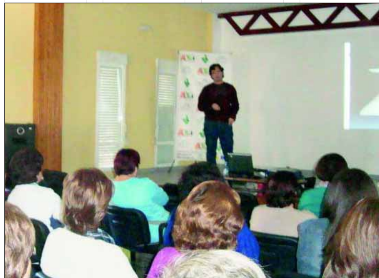
Una de las clases del taller fisioterapéutico.

para relajarla, flexibilizarla y fortalecerla. Las mujeres fueron informadas sobre las patologías más frecuentes, sus causas y cómo corregirlas. Los problemas comunes que se trataron son: dolores de cuello, mareos y hormigueos en brazos y manos, entre otros. Las asistentes aprendieron a realizar actividades cotidianas del trabajo para no dañar su espalda y aliviar el dolor mediante ejercicios.