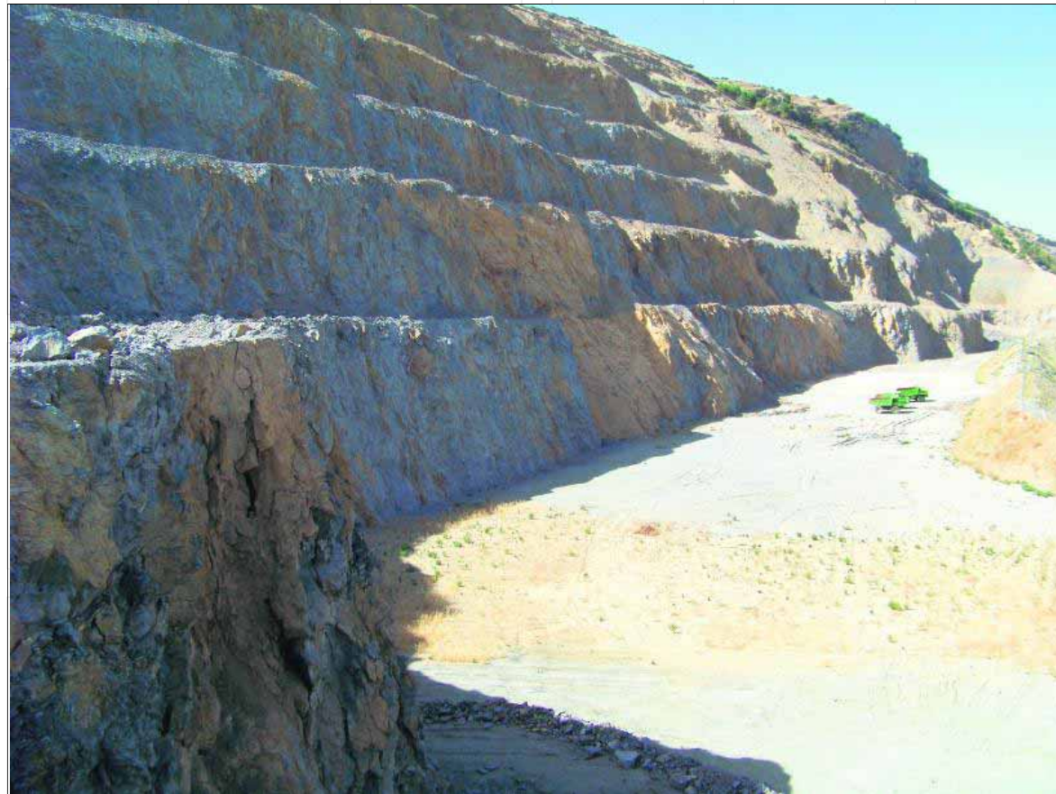
Imagen de la cantera de Jamilena, utilizada durante años por la empresa Holcim.

Entre las iniciativas contempladas en el áreas están un espacio con fotografías antiguas, una maqueta de la cantera y otros contenidos; unos aseos con vestuarios; dependencias de recepción; una sala audiovisual; una completa área lúdico-recreativa de unos 40.000 metros cuadrados con un circuito perimetral para paseantes y bicicletas. De hecho, el lugar en cuestión se convierte en un área para practicar senderismo. Por otro lado, los servicios se completan con un amplio aparcamiento para coches y bicicletas y una zona deportiva —con rocódromo, dos pistas de pádel,