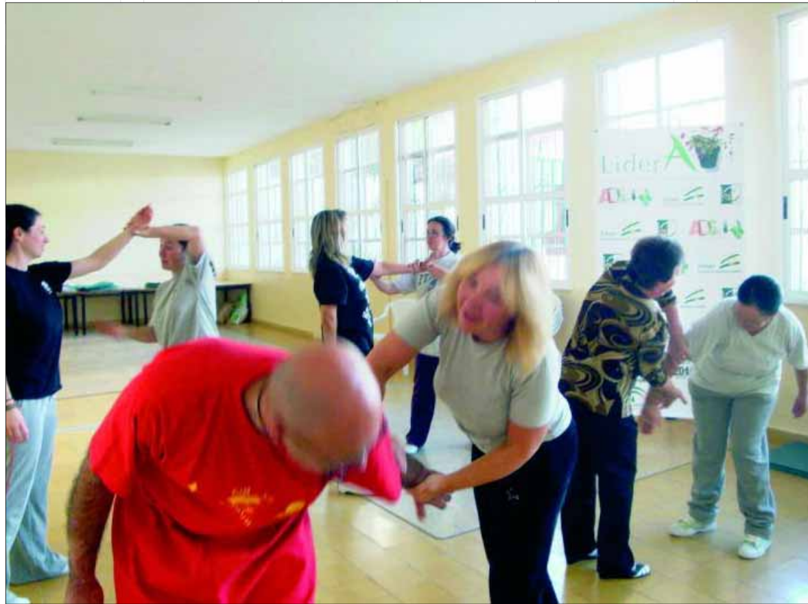
Curso de defensa personal en Castillo de Locubin.

Mujeres de la Sierra Sur aprenden a autoprotegerse y trabajar el desarrollo de una condición física mínima necesaria, gracias a los cursos de defensa personal para mujeres organizados por ADSUR. La violencia sobre las mujeres, por desgracia, sigue ocupando demasiadas noticias en los medios de comunicación, que alertan de una realidad social preocupante por diversas causas, que se debe tratar pero sobre todo prevenir, mediante una serie de políticas y actuaciones concretas. La Asociación contribuye a mejorar la realidad social existente con estos cursos que persiguen la prevención ante posibles agresiones. Las mujeres aumentan la seguridad ante situaciones de violencia, siempre con fines defensivos y de disuasión, mediante la adquisición de conocimientos específicos de autoprotección y de técnicas de defensa personal, que ayudan a reaccionar mejor ante situaciones de peligro.