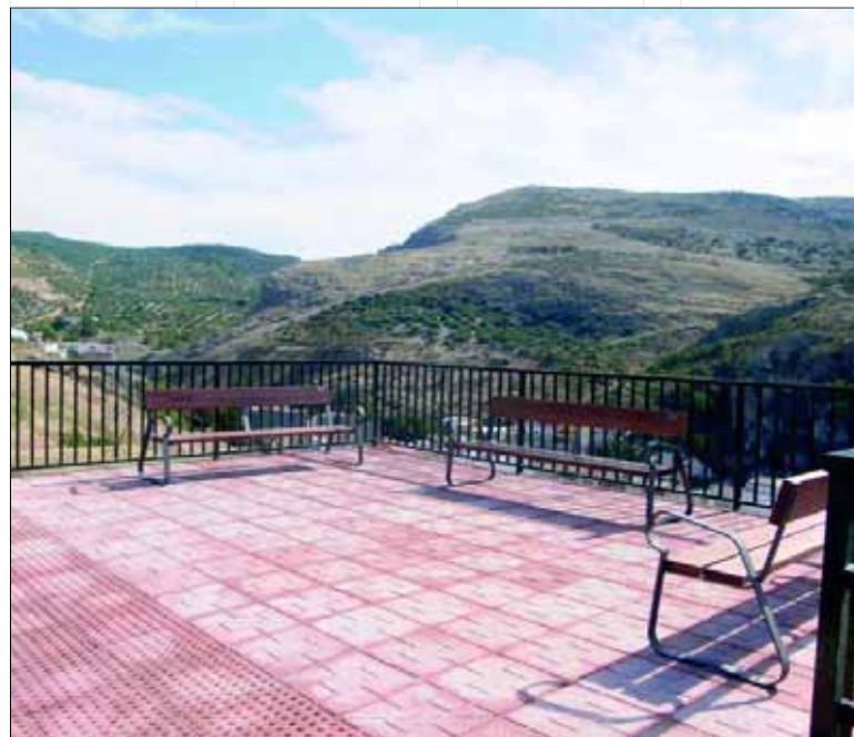
Miradores en Fuensanta.

La Iniciativa de Turismo Sostenible, está dirigida a espacios con un importante potencial turístico que cuentan con recursos patrimoniales naturales o culturales de interés, en los que la iniciativa va destinada al desarrollo equilibrado y a la preservación de tales recursos, o la incorporación de medidas de calidad como factores económicos de valor estratégico. La Sierra Sur de Jaén cuenta con este importante potencial y ahora se encuentra en fase de desarrollo del destino turístico comarcal, un producto en el que la riqueza de cada municipio es integrada. Frente a otros destinos ya maduros, se puede trabajar para definir un modelo