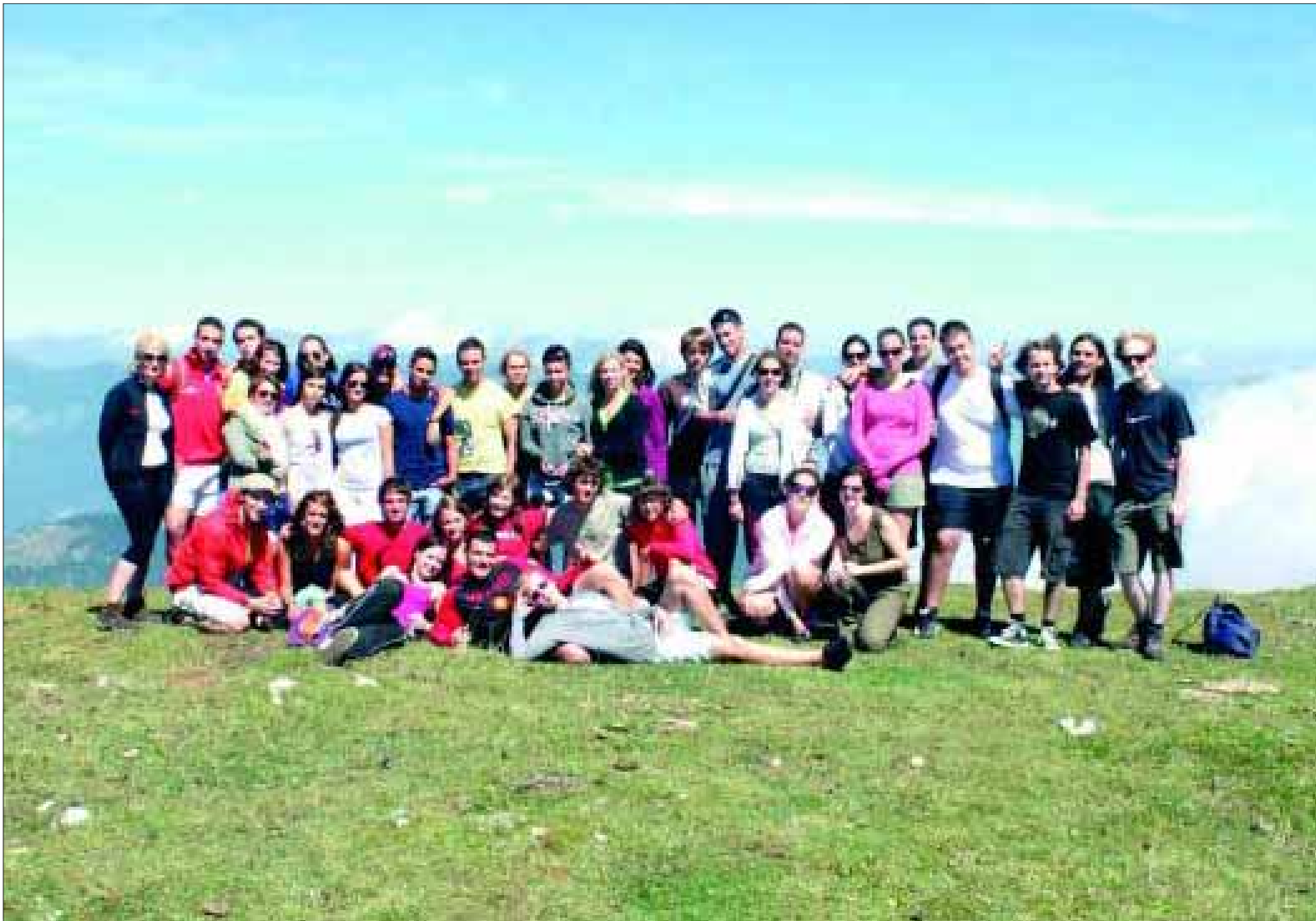
Grupo de personas que participó en el intercambio juvenil en Austria.