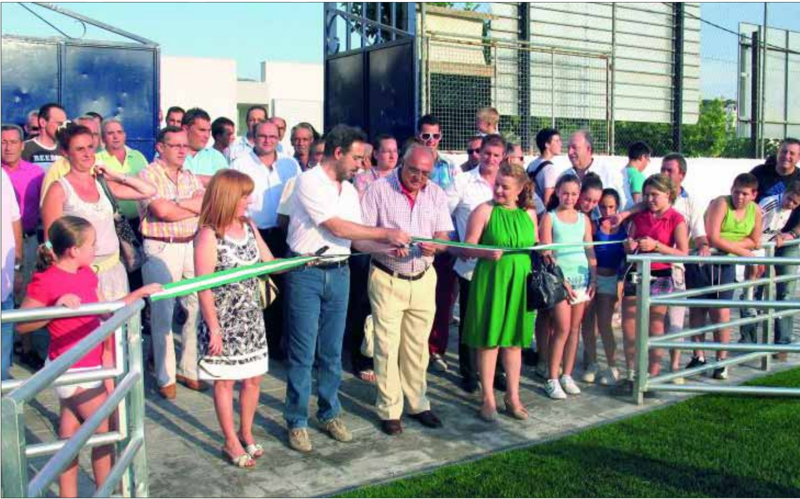
Representantes políticos y vecinos asistieron a la inauguración del césped artificial en el campo de fútbol del municipio