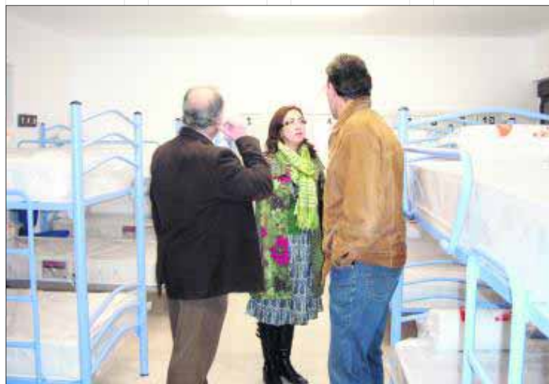
Los responsables públicos en la zona del dormitorio.

cerán servicios de orientación, información, mediación y asesoramiento jurídico al colectivo. Al mismo tiempo, el Ayuntamiento apuesta por acercar los Servicios Sociales a este barrio marteño, de manera que una trabajadora social y una educadora atenderán desde este centro las necesidades de los usuarios de del casco histórico, que no tendrán que desplazarse hasta el Centro de Servicios Sociales. En resumen explicó Nieto: "se trata de aglutinar los recursos existentes en un mismo centro para mejorar la atención al ciudadano: por un lado, potenciando los ejes de intervención destinados para la atención del fenómeno migratorio y por otro, acercando los servicios sociales a toda la población de esta zona".