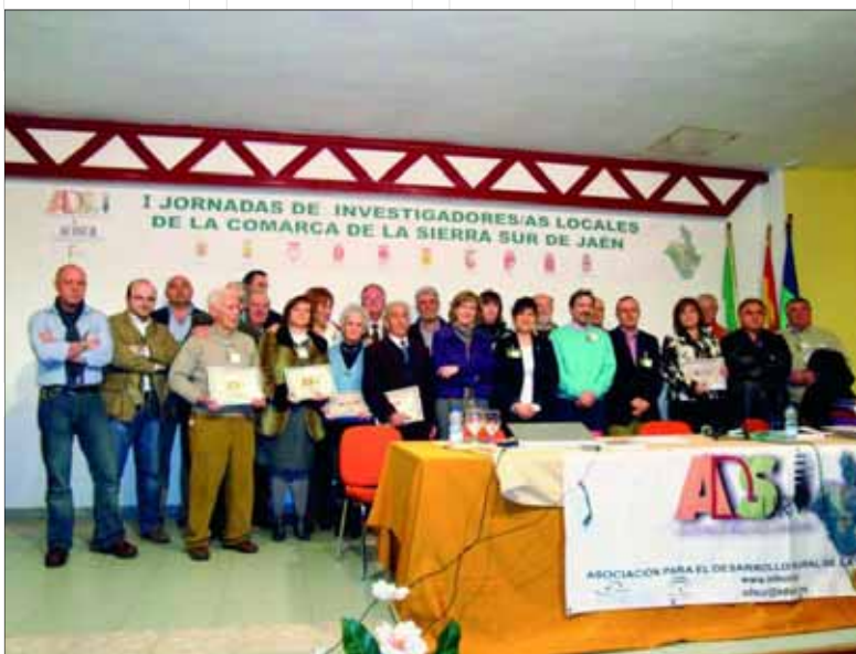
Presentación de la asociación de investigadores Acisur.

ACISUR, nació el 20 de febrero de 2010. La Asociación de Desarrollo ha sido la responsable de la organización, la gestión, la labor técnica y el seguimiento de todo el proceso de creación, formación y convocatoria de Acisur. Desde hace días, ACISUR ya tiene presencia en internet y en la red social Facebook.