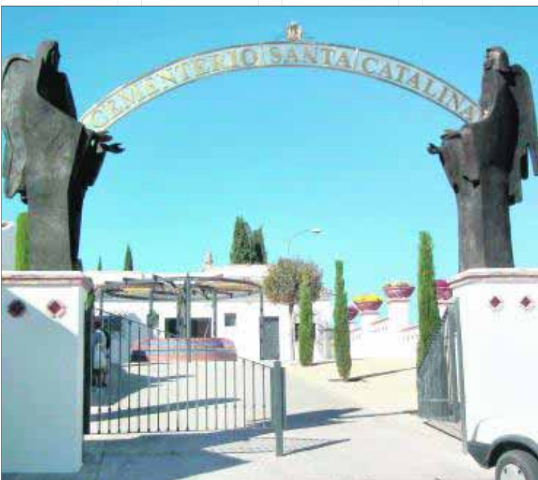
Aspecto actual del acceso al recinto municipal alcaudetense.

La renovación integral en todo el término municipal supone una inversión de más de 560.000 euros, que serán financiados en un 70% con los fondos del Plan de Optimización Energética (POE), mientras que el porcentaje restante será sufragado por la Asociación para el Desarrollo Rural de la Sierra Sur (ADSUR) y la Administración local alcaudetense. A la larga, la medida se traducirá en un considerable ahorro en electricidad.