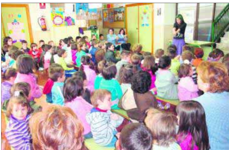
Actividad de cuentacuentos en la comarca de la Sierra Sur de Jaén.

Durante la actuación se intercalaron y combinaron cante y baile flamenco. Una oportunidad en la que ADSUR, difunde y apoya el arte flamenco que ha servido de reclamo a más de mil personas que han disfrutado de la actividad en cada edición. La iniciativa permite a los vecinos y vecinas de la comarca jiennense acceder a unos contenidos culturales de primera calidad en sus propios municipios.