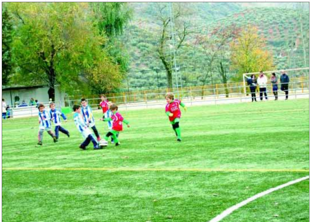
Niños de Fuensanta, Los Villares y Valdepeñas participaron en la iniciativa.

Fuensanta, Los Villares o Valdepeñas de Jaén son algunos de los municipios que ya se han unido a esta iniciativa de la Asociación, que busca un mayor acercamiento del deporte a los/as niños/as interesados/as en el deporte comarcal.