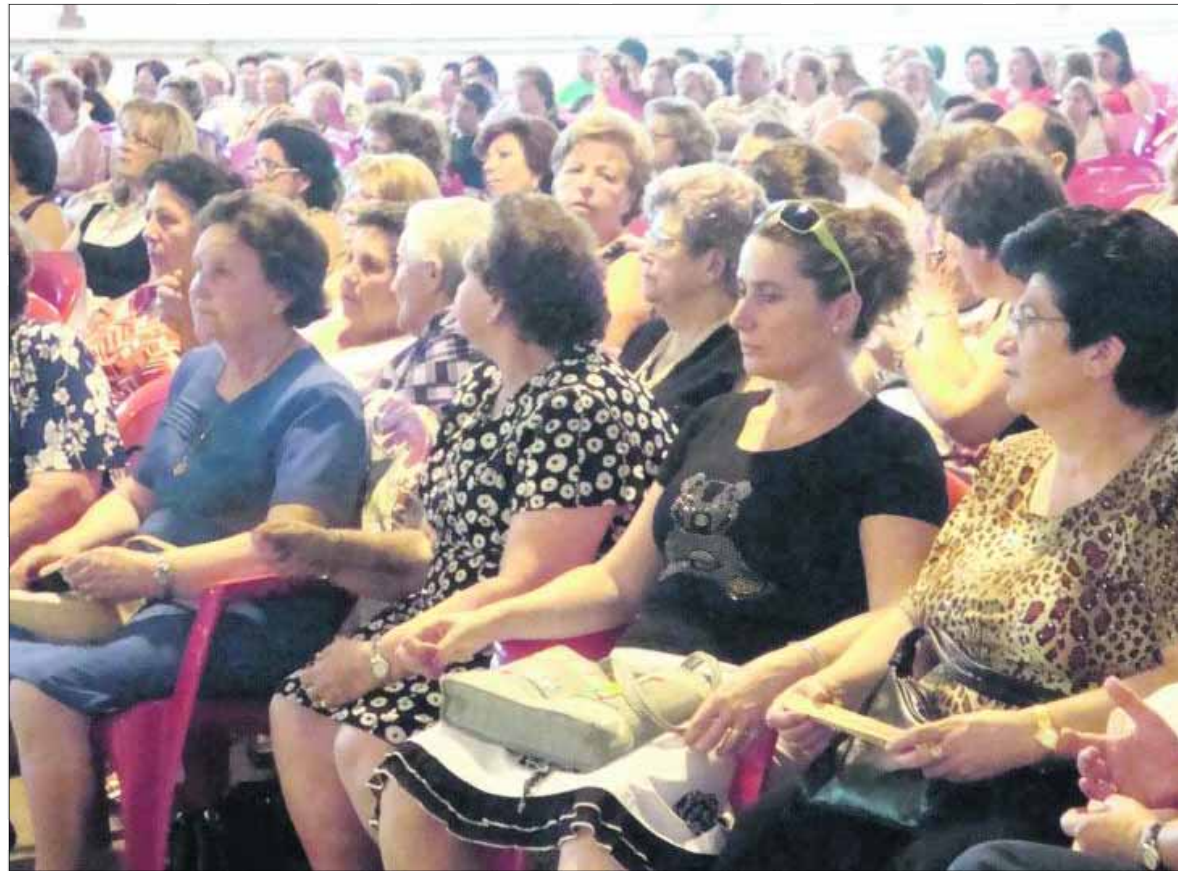
Público asistente al encuentro cultural celebrado en Los Villares.

El Programa para la Comarcalización de la Acción Cultural de la Sierra Sur de Jaén, cierra un año más cargado de actividades. Los concursos de poesía, variedad de talleres, circuitos comarcales de flamenco y teatro son la base de una programación anual que atrae a miles de personas. En esta ocasión, destaca el Circuito Provincial de Teatro de Aficionados en el que por primera vez participan grupos en diversos municipios de Jaén. Una vez más la Navidad es una fecha clave, en la que AdsUR enfatiza el valor de la tradición cultural y reconoce la importancia de sus costumbres y tradiciones, además de potenciar su conservación con la realización de concursos de belenes y escaparates navideños y las actuaciones musicales propias del momento.