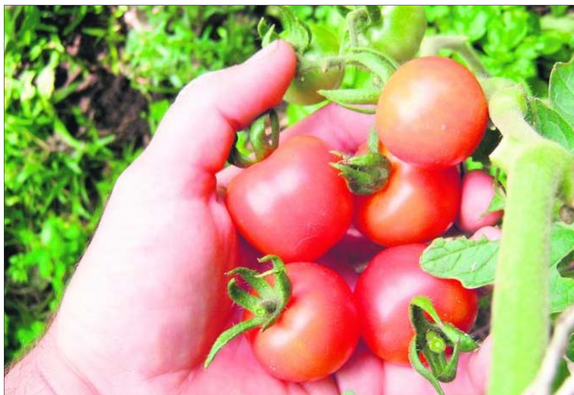
ADSUR apuesta por potenciar la agricultura ecológica.

Otro problema adicional es la dificultad en el acceso a la financiación ajena para desarrollar proyectos, que hace muy cuesta arriba la puesta en marcha y el mantenimiento de los