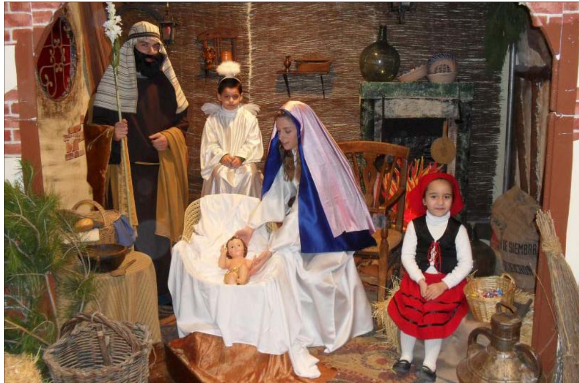
Belén viviente realizado en Fuensanta, el pasado año.

Asimismo, el día 5 de enero, gracias a la colaboración de diferentes asociaciones locales, (Asociación de Mujeres Fuensanta Campoamor, Banda Filarmónica