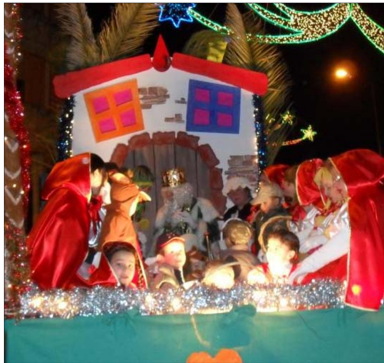
Cabalgata de Reyes Magos en las calles de Fuensanta.

de Fuensanta y AMPA Futayala), la Cabalgata de los Reyes Magos de Oriente recorrerá las calles de nuestra localidad, inundándolas de luz, música y magia.