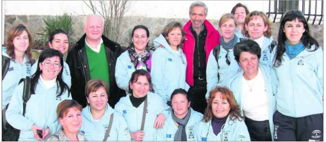
Juan Echanove e Imanol Arias, junto con las alumnas del Taller de Empleo Ardales, que se imparte en Frailes.