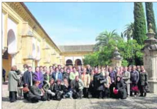
Numerosas mujeres participaron en las actividades.

una de las citas centrales, la entrega de distinciones a diferentes mujeres. Luego se presentó un libro de Pablo Peña Almagro. La actividad "No plastifiques tus compras", de concienciación sobre el uso de no tejido y limitación de las bolsas de plástico, fue el 10. Por último, el 11 hubo un viaje hasta la ciudad de Jaén, una propuesta de convivencia con un almuerzo.