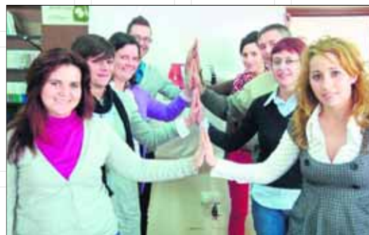
Trabajadores y trabajadoras de ADSUR, entidad conformada mayoritariamente por mujeres, con igualdad de oportunidades para ambos sexos.

El proyecto impulsado por la Asociación de Desarrollo Rural y apoyado financieramente por el Plan de Actuación Global (PAG), contribuye al avance de las políticas de igualdad, mediante la integración transversal del enfoque de género y la aplicación de medidas positivas para las mujeres, que el LEADER + incorpora a los programas de desarrollo rural. Por todo ello, es necesario seguir trabajando para que esa igualdad sea una realidad tangible, ya que aunque se ha avanzado durante las últimas décadas, el objetivo sigue siendo que las mujeres tengan las mismas oportunidades laborales, políticas y culturales que los hombres en el medio rural. En definitiva, igualdad, igualdad en todos los sentidos, en todos los ámbitos, igualdad en el mundo rural. Se hace necesario por tanto la mejora de las condiciones de vida de las mujeres del mundo rural,