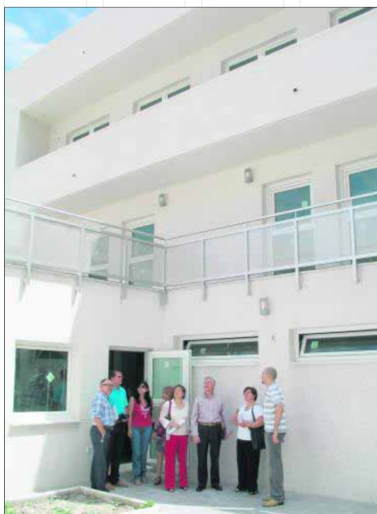
Visita a las obras de la residencia de discapacitados.

tes como, por ejemplo, el embovedado del Arroyo de Santa Ana desde el Paseo de la Estación hasta la calle Hernán Cortés, la terminación del proyecto de urbanismo comercial y el arreglo de calles en distintas zonas del casco urbano de Torredelcampo. En definitiva, la actual ha sido una legislatura inversionista cuyo objetivo ha sido reactivar la economía y fomentar la creación de empleo entre los sectores más afectados por la actual crisis económica.