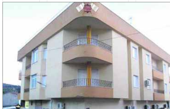
Hostal Banderas en Fuensanta de Martos.

Por ejemplo, en pleno casco urbano de Fuensanta, se ha construido el "Hostal Banderas", un pequeño y acogedor alojamiento con 12 plazas de capacidad distribuidas en 7 habitaciones completamente equipadas y acondicionadas, para el disfrute de un turismo rural de calidad. Este nuevo proyecto viene a cubrir las deficiencias en infraestructura turística del municipio, que hasta la fecha no disponía de tales servicios. Lo que supone la mejora de la calidad de vida y servicios prestados en Fuensanta. El hostal que, además ofrece servicio de cafetería, es lugar de encuentro de numerosos fuensanteños. Otros proyectos encuadrados en las "ayudas a microempresas" son por ejemplo, en Jamilena,