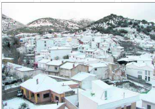
Panorámica del casco urbano de Frailes.