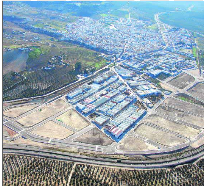
Panorámica del casco urbano torrecampeño, con el polígono industrial en primer plano.

general del Parque Municipal Blas Fernández (678.000 euros), el acondicionamiento del Paseo de la Estación (349.982 euros), la prolongación del embovedado y ajardinamiento del cauce abierto del arroyo de Santa Ana (670.000 euros), la rehabilitación y mejora de distintos espacios públicos entre los que se encuentra el pavimentado de seguridad de las áreas de juego infantil y la creación de un nuevo parque en la calle Valencia (336.800 euros) y, finalmente, la sustitución y acondicionamiento del saneamiento de las calles Alcantarilla, Valverde y Callejón de Lucas. Unas obras que los