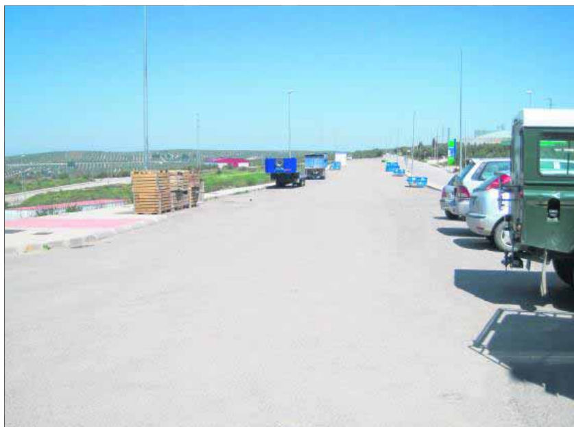
Vista parcial del polígono industrial Virgen de la Estrella, en el municipio de Jamilena.

ceso —que se lleva a cabo mediante un concurso-subasta— esté abierto es un alivio para el Ayuntamiento que, con los ingresos obtenidos, podrá hacer frente a pagos a proveedores municipales. El responsable explica que, además, la medida dará una solución a las necesidades de las personas emprendedoras y permitirá la creación de puestos de trabajo. De hecho, la expectación creada es tal que ya se han dirigido a las autoridades interesados en el pro-