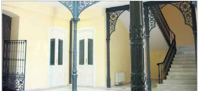
Interior de la Casa de Artes y Oficios, un edificio con unos valores arquitectónicos que lo hacen singular.