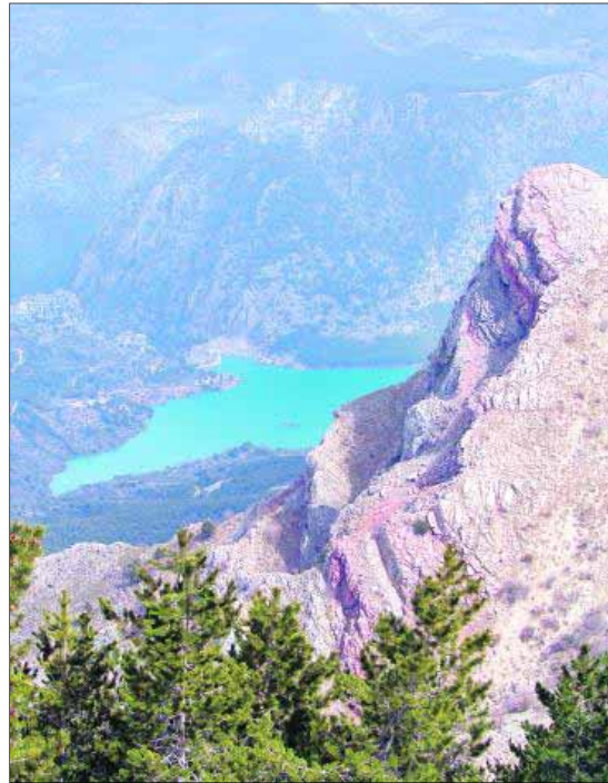
El Quiebrajano desde Ventisqueros.

extienden por Castillo de Locubín, Valdepeñas de Jaén y Alcalá la Real conformando una panorámica única y singular que se tiñe de tonos rojos al llegar la primavera.