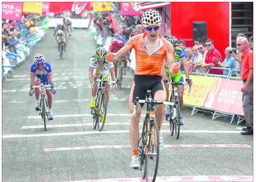
La Vuelta Ciclista a España dejó muy buena sensaciones en Valdepeñas durante el año 2010.

desde el Ayuntamiento se está planteando la opción de señalar el itinerario y darle toda la promoción y difusión para utilizarlo como reclamo turístico", ha comentado Del Moral. Asimismo, la responsable municipal ha mostrado su agradecimiento a la Diputación Provincial por sufragar, un año más, el canon económico de esta cita deportiva. "Sin el patrocinio de la Diputación Provincial nuestro municipio no hubiera podido nunca ser meta de la Vuelta Ciclista a España y mucho menos repetir dos años consecutivos", subraya la alcaldesa valdepeñera. Por su parte el director de Unipublic, Ja-