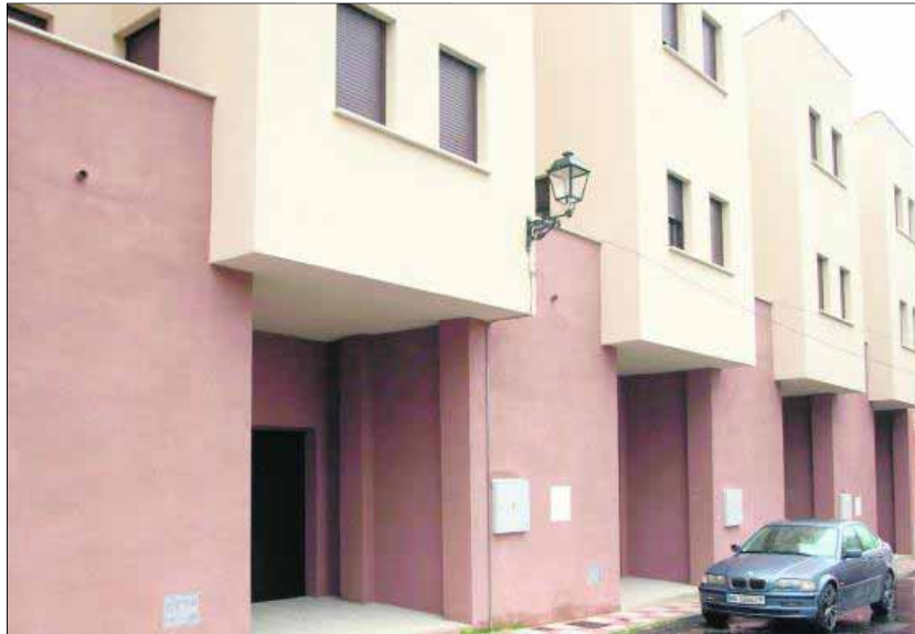
Casas de promoción oficial construídas por la Administración en una anterior promoción.

Tras varios años de gestiones desde el Ayuntamiento, ante la negativa de la empresa responsable de la obra situada en Calle Doctor Fleming 38 y 40 (Charco de la Rana) para acometer las obras necesarias de contención, con el fin de garantizar la seguridad de las viviendas colindantes, una vez pasados los plazos legalmente otorgados a la firma, se tomó la decisión de llevar a cabo la ejecución subsidiaria con el fin de garantizar la seguridad de los vecinos y las viviendas colindantes. Se llevará a cabo la construcción de muros de contención a las casas anexas al solar, así como la evacuación de aguas estancadas y drenaje al alcantarillado.