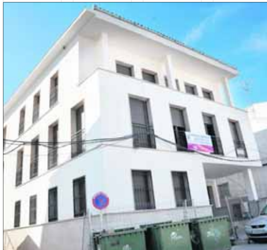
Fachada principal del centro de salud Antonio Villargordo.

ción familiar, atención a crónicos, una biblioteca y aula para docencia, entre otras. También se construye en esta zona, un Centro social que albergará en su planta baja un centro social de mayores y una Unidad Técnica Social (UTS) para atender a los vecinos y vecinas del casco antiguo y diferentes dependencias municipales en las plantas superiores, como la Oficina del Plan de Desarrollo Local y Urbano, Recaudación y las dependencias de los psicólogos municipales. El impulso al casco antiguo es una de las prioridades del equipo de Gobierno.