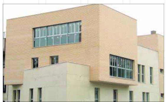
Centro de día de Torredelcampo.