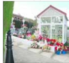
Tumba del Santo Manuel en Ventas del Carrizal.