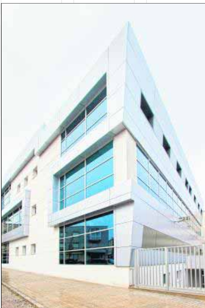
Visita panorámica del inmueble desde el exterior.

Alcalá la Real se convirtió en 2005 en el primer "Municipio Joven" de la comunidad autónoma, distintivo con el que la Junta de Andalucía viene reconociendo a todos aquellos ayuntamientos que desarrollan políticas específicas para el colectivo juvenil. Una nueva instalación, desarrollada por el Ayuntamiento con los fondos del Plan E del Gobierno central, viene a acreditar este título: el Edificio Joven. Es uno de los espacios andaluces más grandes dedicados a la juventud.