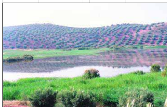
Laguna Honda en Alcaudete.

La Laguna del Chinche se encuentra en el paraje donde se si-