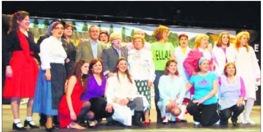
Artistas del musical "Ellas" junto al presidente de ADSUR.