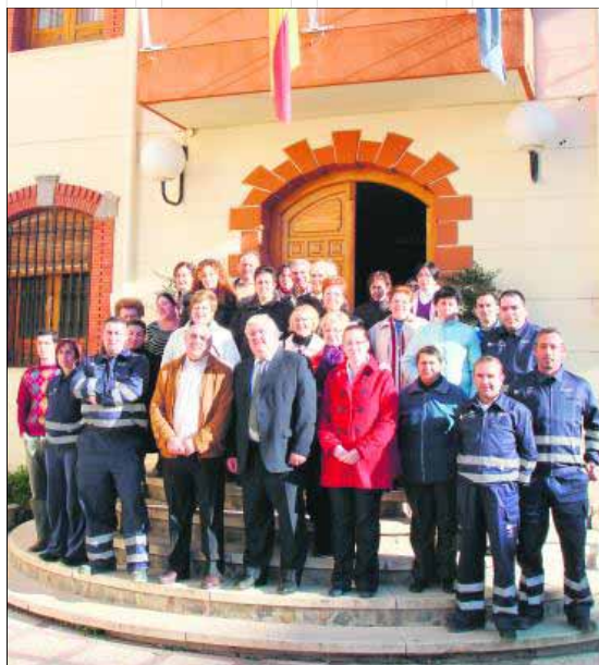
Presentación del programa PAGE.

La celebración del Carnaval está constituyendo una recuperación de costumbres y tradiciones locales y así lo pone de manifiesto la participación en el concurso de máscaras celebrado el pasado 5 de marzo, que contó con diferentes premios al mejor disfraz adultos, infantil y de grupo. La propuesta cultural gozó de un gran éxito. El pasacalles del entierro de la sardina se realizó el 6 de marzo y fue acompañado por la Banda de Música Peña de Zuzaña. La pretensión del Ayuntamiento de Fuensanta es dar el máximo realce a unas celebraciones que, desde siempre, cuentan con gran arraigo popular.