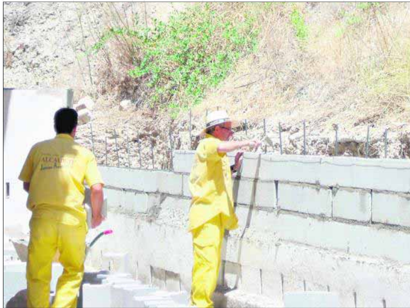
Dos operarios trabajan en una de las obras promovidas desde el Ayuntamiento.

Algunos de los programas que han recibido financiación han sido el Programa de Fomento del Empleo Agrario, que está destinado a trabajadores agrícolas eventuales, a excepción de los puestos dedicados a albañilería. Este programa, que ha servido para dar empleo a más de 1.400 personas, está cofinanciado a través del Fondo Social Europeo, el Servicio Público de Empleo Estatal, la Junta de Andalucía y la Diputación Provincial de Jaén. Asimismo, las bolsas de trabajo temporal