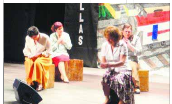
"Ellas" en su reflexión social.