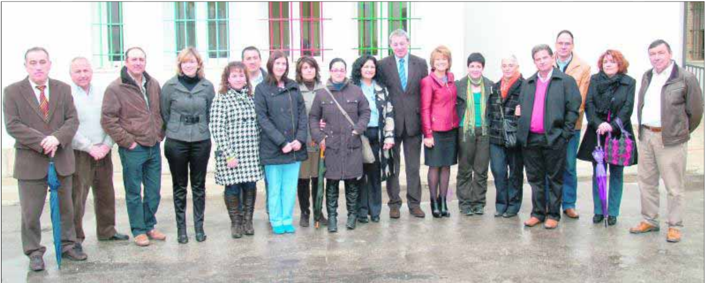
Autoridades de distintas administraciones y representantes del centro y de la comunidad educativa asistieron a la inauguración del gimnasio del instituto local.