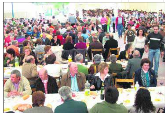
Participantes en la iniciativa en una anterior edición.