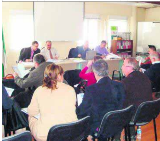
Consejo Territorial del GDR Sierra Sur de Jaén.

• "Modernización de explotaciones agrícolas y ganaderas" , con proyectos como una planta de extracción de antioxidantes naturales, aromas y especias para uso agroalimentario en Castillo de Locubín o la introducción de una nueva línea de producción en una empresa de transformados plásticos a partir de extrusión de polímeros en Santa Ana (Alcalá la Real).