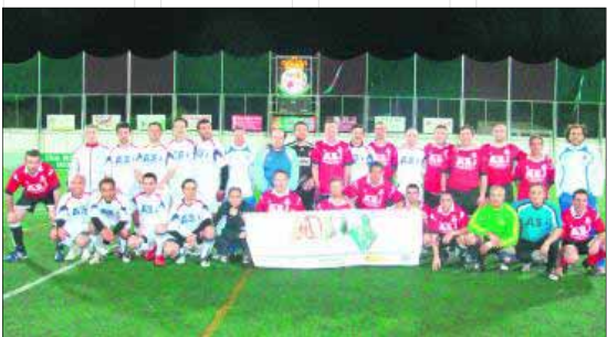
Equipos participantes en la Liga Comarcal de Fútbol para Veteranos.

Esta prueba consiste en una ruta cicloturista con bicicleta de montaña que tiene carácter de carrera popular. Está ideada para que cualquiera pueda terminar la prueba aunque el tiempo empleado sea muy grande (más de 9 horas). El recorrido, de unos 100 kilómetros, es exigente en lo físico pero sin gran dificultad técnica y escasos obstáculos y se desarrolla en su mayor parte por pistas de tierra que atraviesan parajes espectaculares de la Sierra Sur.