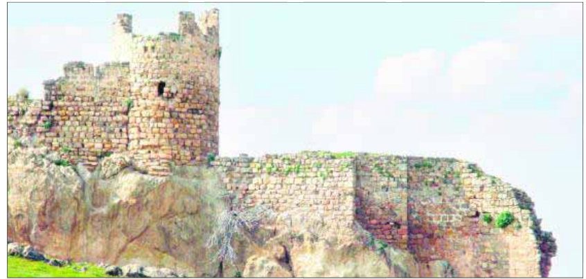
Castillo del Berrueco en el término municipal de Torredelcampo.

La Ruta de los Milagros transcurre por los municipios de Los Villares, Valdepeñas de Jaén, Frailles y Ventas del Carrizal (Castillo de Locubin). Esta ruta ofrece la posibilidad de acercarse a una