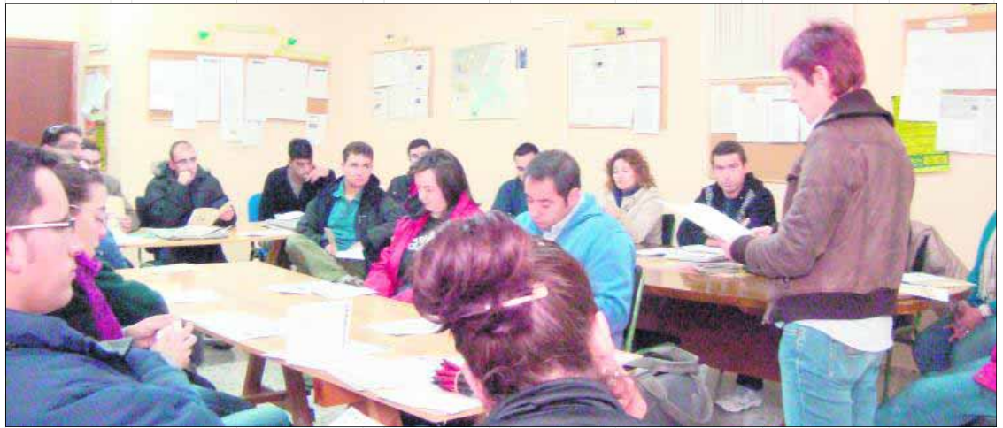
Sesión informativa de la iniciativa de ADSUR celebrada en el municipio de Torredelcampo.

El programa de Acciones Experimentales del área de empleo de ADSUR, está desarrollado sesiones informativas a lo largo de todo el mes de marzo en los municipios de la Sierra Sur de Jaén. La finalidad es lograr la integración de usuarios en el programa para lograr la inserción laboral y la mejora de la empleabilidad de los demandantes de empleo. Concretamente se han desarrollado en las localidades de Alcaudete, Martos, Fuensanta, Valdepeñas de Jaén, Torredelcampo, Los Villares y Jamilena. El resultado de estas sesiones informativas es positivo, ya que se ha obtenido una alta participación de los usuarios para la búsqueda activa de empleo.