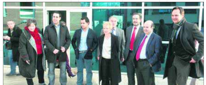
Autoridades presentes en el acto inaugural del Edificio Joven.