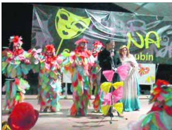
El Carnaval se encuentra muy arraigado en Castillo de Locubín.