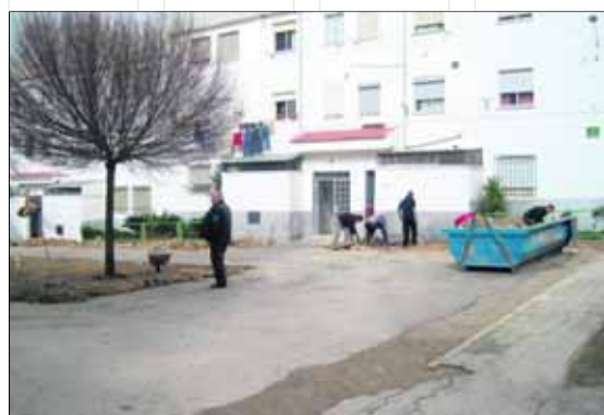
Trabajos en la Plaza de San Rafael, en la zona centro.