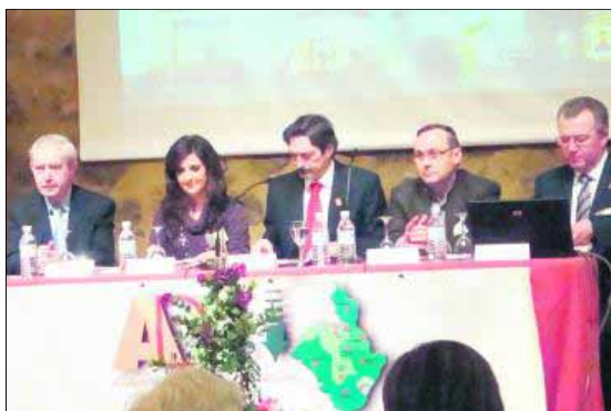
Inauguración de las jornadas en el Castillo calatravo de Alcaudete.

La representación del musical causó una grata impresión entre el público, ya que en ella se compaginan los momentos emotivos y tristes con los momentos alegres y divertidos que ha vivido la evolución de la mujer a través del periodo de tiempo descrito. Desde ADSUR felicitamos a esta Asociación porque "Ellas" se han convertido en las protagonistas con la memorable interpretación de este musical y animamos a todas las vecinas y los vecinos de la Sierra Sur a que no dejen pasar la oportunidad de asistir a presenciar este magnífico musical.