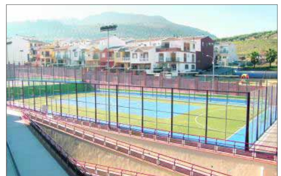
Pistas deportivas en el complejo polideportivo 18 de febrero.