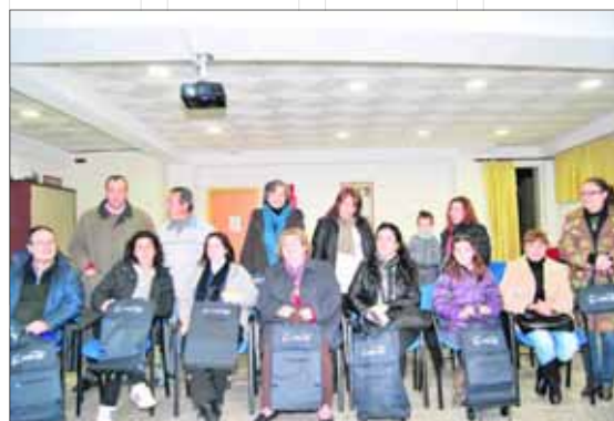
Participantes en la charla dedicada al reciclaje.

sonas inscritas en el Servicio Andaluz de Empleo como demandantes de empleo, residentes en Jamilena, a través de la realización de tres cursos de formación acompañados de prácticas laborales en distintas empresas. Los títulos son "Cuidador/a Infantil", "Auxiliar de Ayuda a Domicilio" y "Cocina y Catering para Personas con Especiales Necesidades".