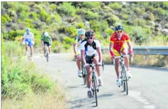
Ruta cicloturista "Ascenso al Alto de la Pandera".