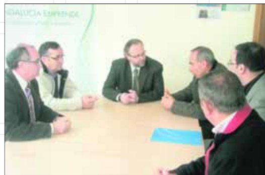
Acto de entrega de la ayuda a la compañía Elaiotecnía.

Se concedió a la compañía una subvención a fondo perdido de 258.438,60 euros, lo que supone un 18% de la inversión total de 1.453.770 euros llevada a cabo. El proyecto de inversión se realiza en Castillo de Locubín, concretamente en el polígono, y supondrá la creación de 5 puestos de trabajo en el municipio. La empresa operará en el sector del