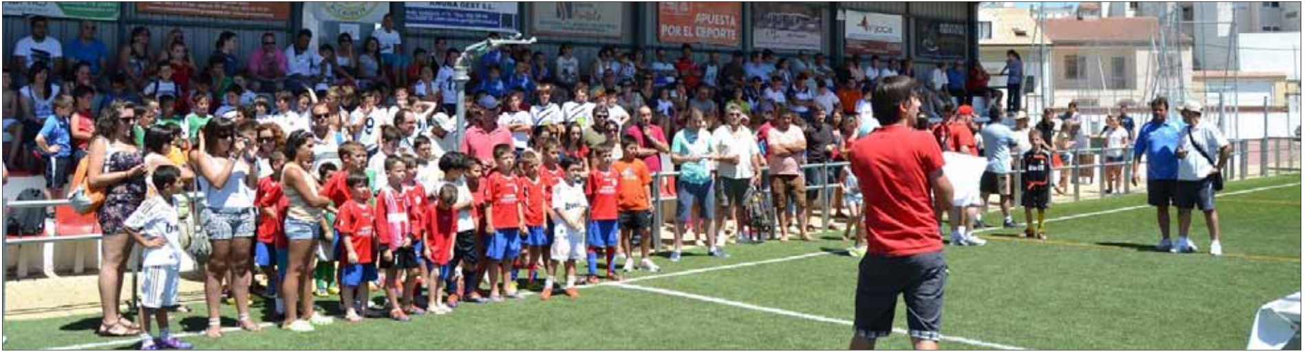
Acto de entrega de premios y trofeos del segundo Encuentro Comarcal de Fútbol 7 en Alcaudete.

HÁBITOS SALUDABLES Adsur pretende que en 2013 buena parte de la población de la comarca se beneficie de las múltiples actividades programadas, pues las hay diseñadas para todos los grupos de edad