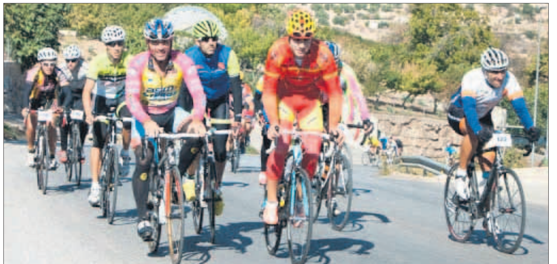
Corredores en la X Ruta Cicloturística Ascenso al Alto de la Pandera.

Tras el periodo escolar, se ofertarán para los más pequeños yincanas para el conocimiento de los recursos de nuestros pueblos, juegos acuáticos y tradicionales en las piscinas, jornadas de recreo y ocio en las que durante dos semanas practicarán juegos alternativos y campamentos de verano para fomentar la convivencia y el intercambio de experiencias. En cambio, para los mayores se realizará la "Jornada de deporte senior" con ejercicios y juegos pensados para el mantenimiento y mejora de la condición física. También, como viene siendo