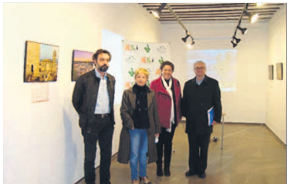
La exposición visitó el Palacio Abacial de la ciudad de Alcalá la Real.