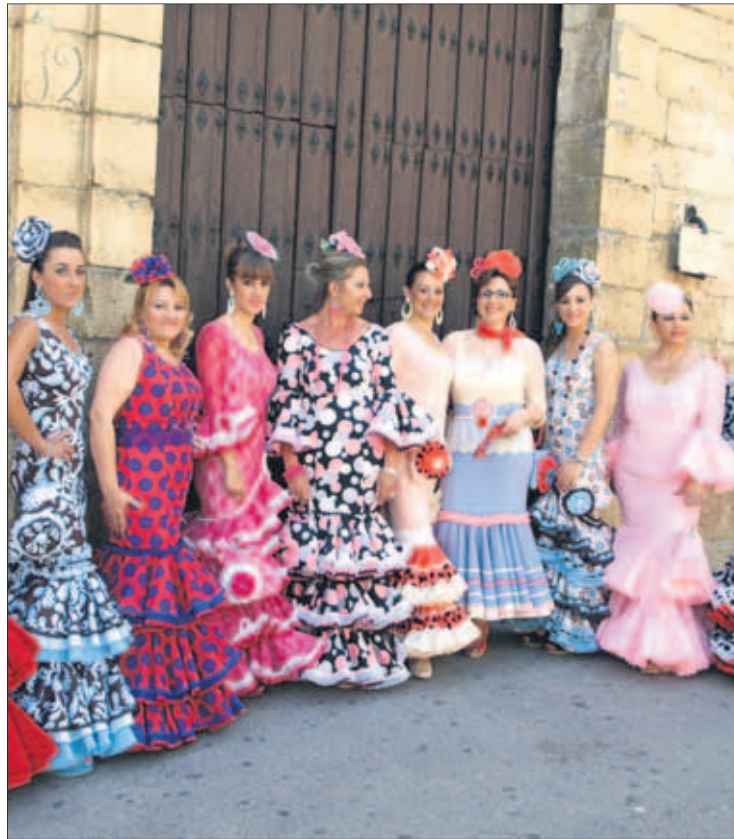
Alumnas del taller de flamenco, vestidas de faralaes.

Tras el éxito de la primera edición y después de la gran acogida que tuvo con más de 300 inscripciones, este segundo año se han querido reforzar los talleres más demandados haciendo un gran esfuerzo e incorporando el doble de turnos en muchos de ellos, pretendiendo con esto que ningún ciudadano se quede fuera de este programa. A día de hoy, sin aun haber finalizado