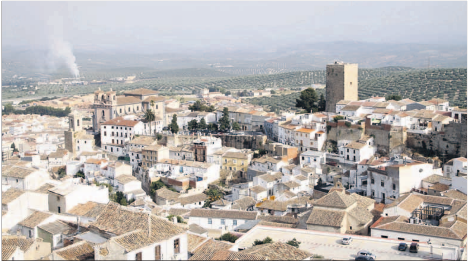
Panorámica de la ciudad de Martos, cuyo término es el de mayor población de la comarca Sierra Sur de Jaén.

Con todo ello se pretende, además, contribuir a reactivar la actividad económica local y paliar así los efectos de la citada crisis económica en Martos, lo que se suma a otras medidas ya adoptadas, como es el caso del nuevo procedimiento para facilitar y agilizar la puesta en marcha de nuevas actividades y negocios, dirigido a eliminar trabas u obstáculos que los empresarios y personas emprendedoras pudieran encontrar a la hora de materializar sus proyectos, sin olvidar también de la colaboración y coordinación con entida-