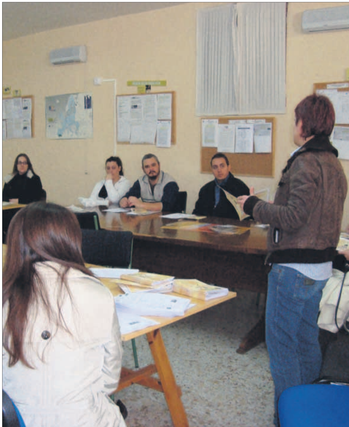
El programa Acciones Experimentales recibe una buena aceptación entre los participantes.

Discapacitados, mayores de 45 años, mujeres o inmigrantes, entre los colectivos destinatarios