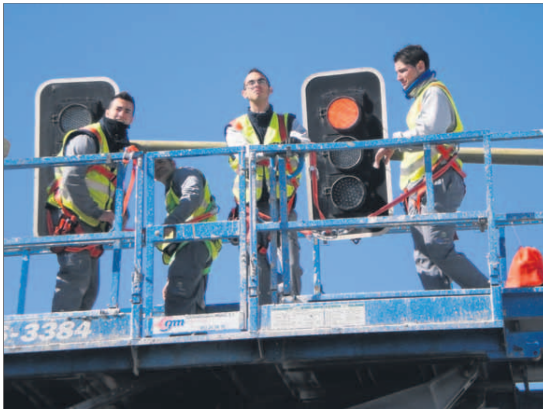
Alumnos de la Escuela Taller de Torredelcampo trabajan en un semáforo del casco urbano.