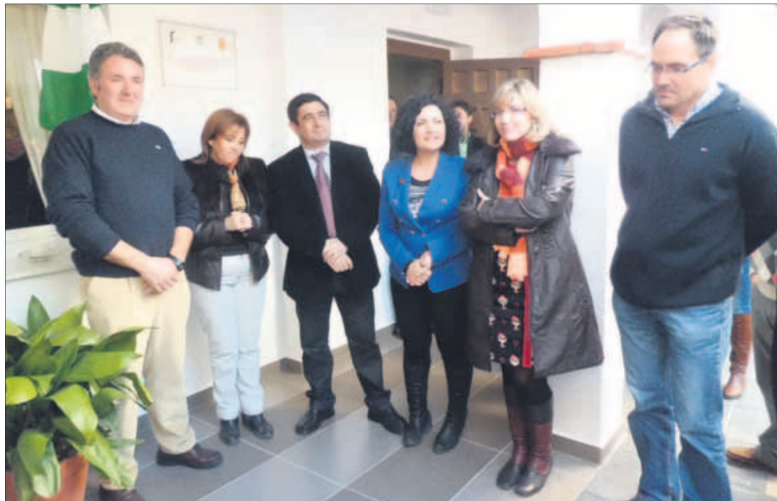
Inauguración de los modernos apartamentos del complejo turístico Monte de las Ánimas.