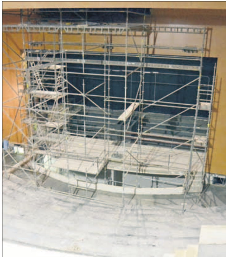
Estado en el que se encuentran las obras del teatro.

Las administraciones autonómica y provincial financian más de 900.000 euros cada una, mientras que el Consistorio alcaudetense asume una cantidad superior a los 1,8 mi-