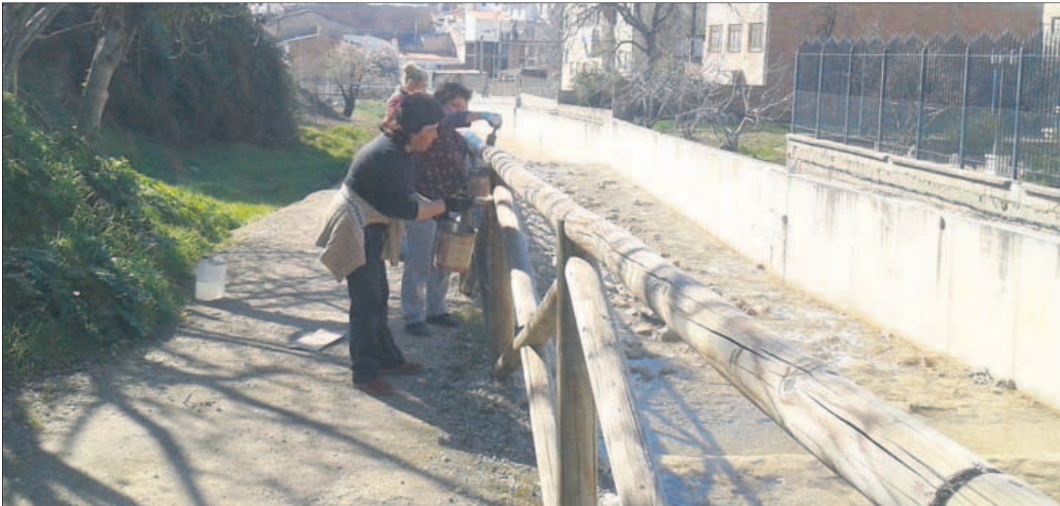
Un grupo de mujeres hace labores de mantenimiento y pintado de una baranda de madera en el casco urbano de Fuensanta.