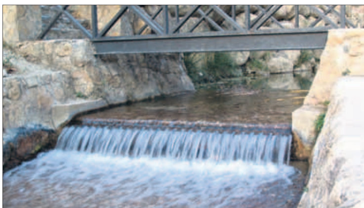
Entorno del nacimiento del río San Juan.