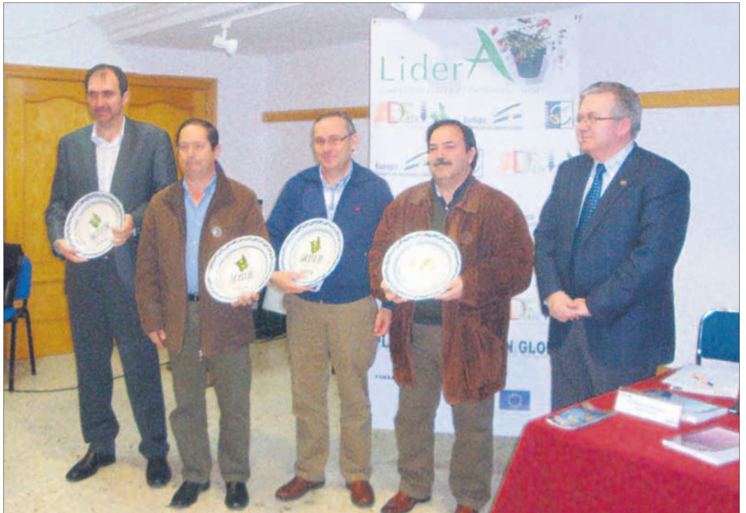
El encuentro de Jamilena sirvió para entregar distinciones a personas y entidades que colaboran con Acisur.