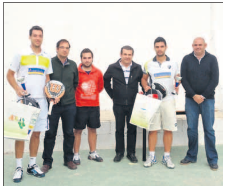
Entrega de premios en la segunda categoría.