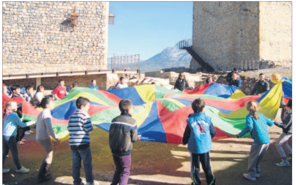
Los escolares tuvieron la ocasión de conocer distintos rincones de la comarca.

Los dos restantes centros fueron, en este caso, el IES La Pandera, de Los Villares, y el CEIP Santiago Apóstol, de Valdepeñas de Jaén. Alumnado y personal docente se desplazaron a Alcaudete, para realizar la ruta “Sierra Sur-Tierra de Frontera”. La actividad