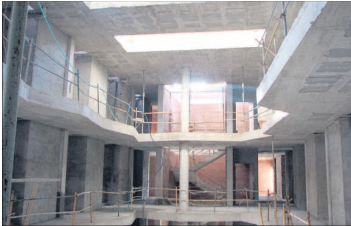
Aspecto que presentan actualmente las obras en el interior del edificio del balneario.

Por otro lado, añade, se ha hecho un estudio topográfico y una serie de replanteos, así como acondicionamiento del terreno, con excavaciones a cielo abierto, rellenos extendidos y compactaciones de tierras. En la parte des-