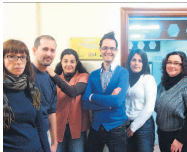
La orientación laboral, una herramienta eficaz contra el paro.

Y los gobiernos han de poner sobre la mesa verdaderas medidas de reactivación, tales