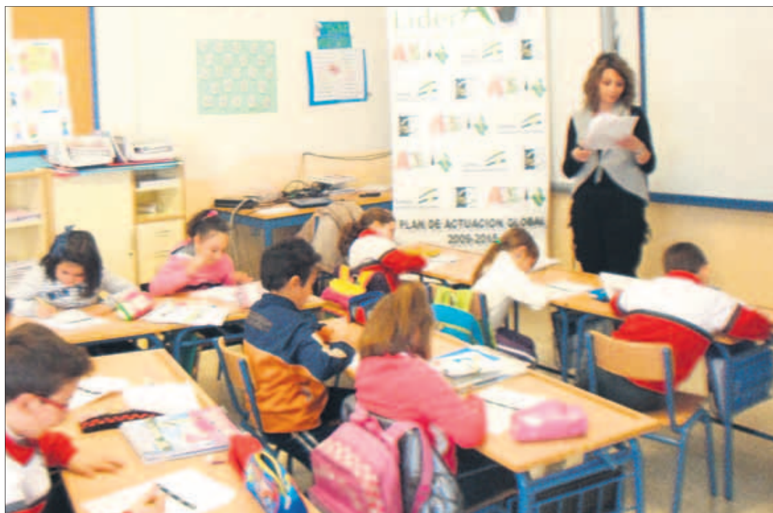
Cuentacuentos y actividades para sensibilizar acerca de la igualdad entre los dos sexos.

El proyecto pretende crear una conciencia crítica en el seno de la comunidad escolar