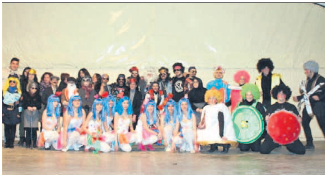
Foto de familia de los premiados en el concurso de disfraces del Carnaval fuensanteño.

La participación fue alta en el carnaval. El mejor disfraz infantil individual fue para Mujer Policía; el adulto individual para Alaska y Mario Vaquerizo; el infantil de grupo para Los Abuelos; el segundo premio de adulto de grupo para Las Katy Perry; el primero de adulto de grupo, para Los Moteros y el dedicado a Agatha Ruiz de la Prada y Su Costurero. El desfile del entierro de la sardina también brilló por las calles de Fuensanta.