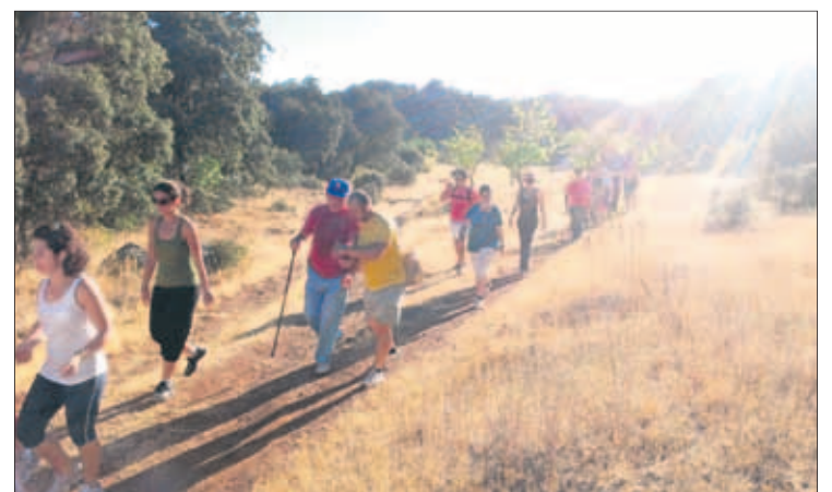
Ruta de senderismo por el término municipal castillero.

puntos que ofrecen envidiables vistas panorámicas, como las del pueblo recostado a orillas del río y rodeado de distintos cerros coronados y atalayas. La propuesta servirá para difundir el patrimonio medioambiental del término castillero. Para las inscripciones y obtener más información, los interesados pueden dirigirse al Ayuntamiento de Castillo.