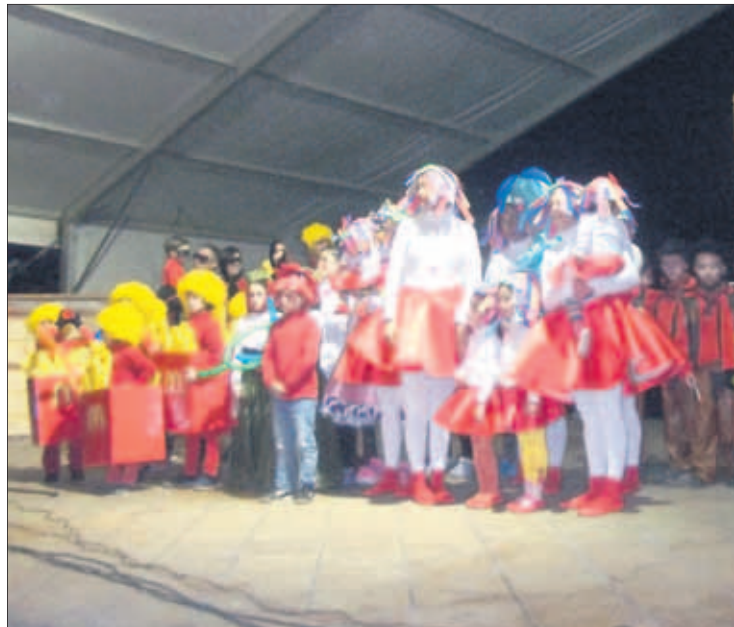
Grupos infantiles participantes en el concurso de Carnaval.

DESFILE Las agrupaciones y los disfraces individuales llenan de colorido el pasacalles