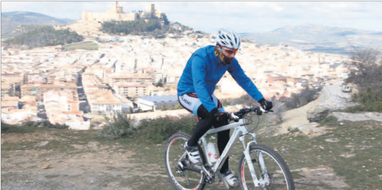
El parque periurbano del paraje Los Llanos es un espacio de esparcimiento de primer orden, con vistas panorámicas.