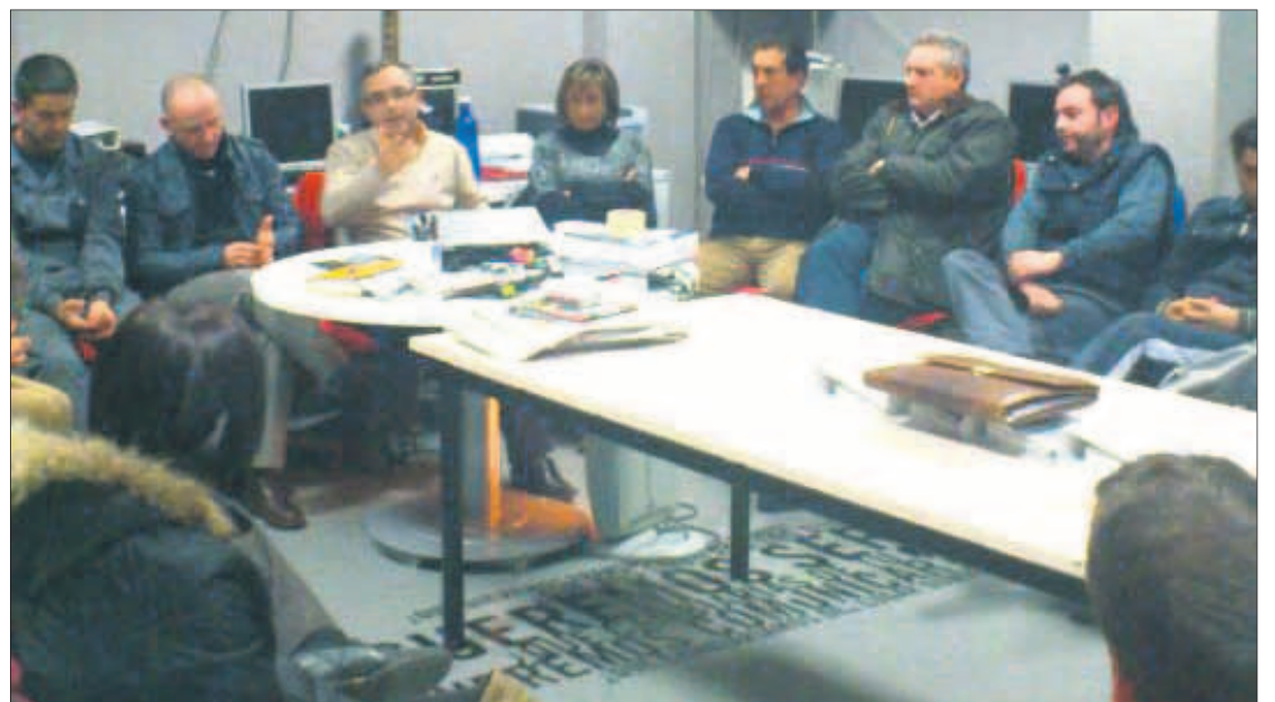
El objetivo de la asociación empresarial es fomentar el desarrollo económico del municipio.

iniciativa denominada Red de Empresarios con Espíritu 2.0, que el centro Guadalinfo pretende potenciar en relación a las nuevas tecnologías. Los fines del nuevo colectivo es representar a las firmas asociadas, fomentar la solidaridad y programar acciones para conseguir mejoras sociales y económicas para las entidades integrantes. También habrá contactos con entidades similares y se respaldará el desarrollo industrial y económico de Frailes. Además se impulsará la formación.