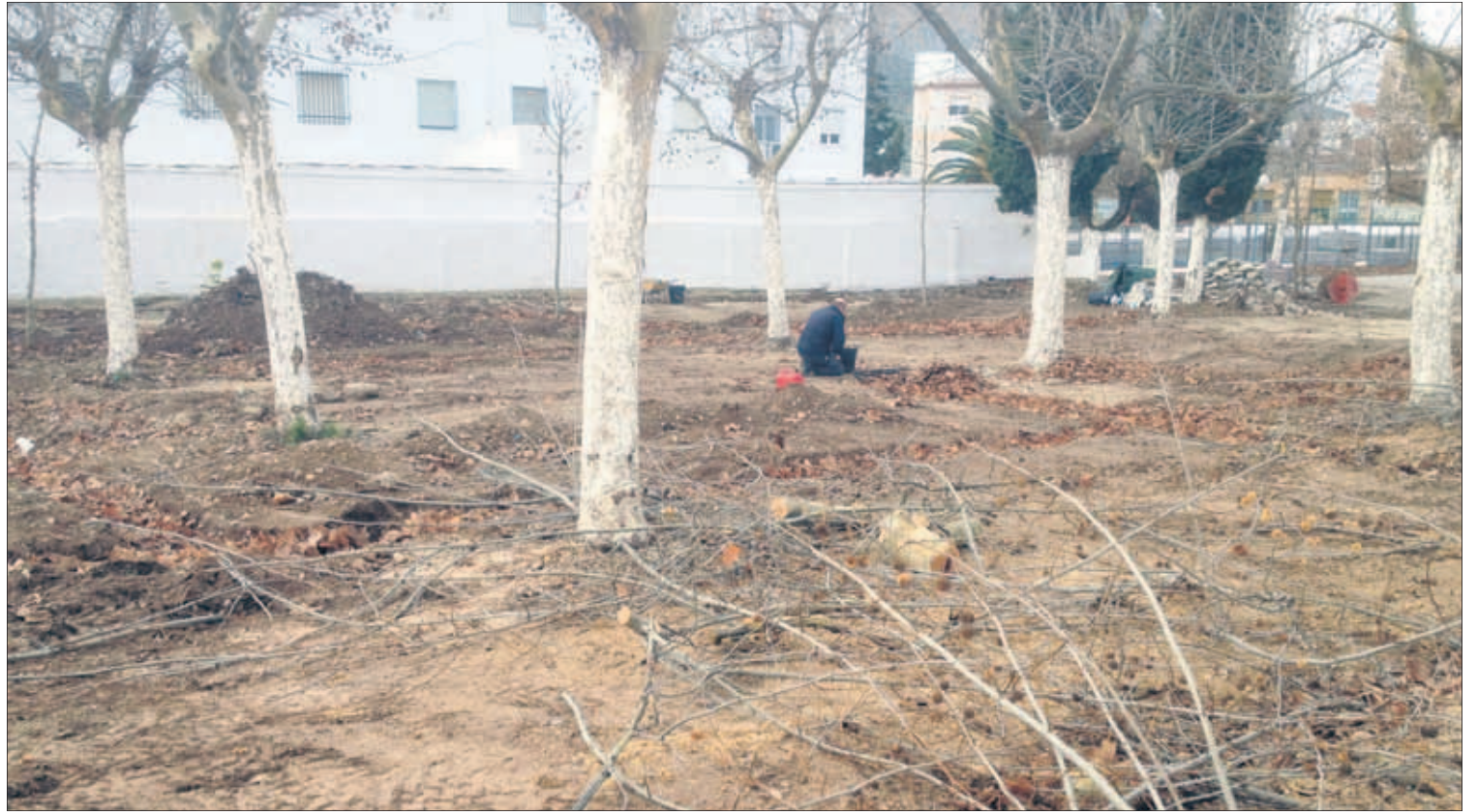
El PFEA permite crear empleo y mejorar instalaciones e infraestructuras públicas de Jamilena.

En Jamilena se están acometiendo actualmente con cargo a este programa de fomento de empleo agrario-PFEA cinco importantes intervenciones. La primera obra consiste en el acondicionamiento del recinto de la Piscina Municipal, una acción urgente, que tiene que estar concluida antes del principio de la temporada de baño y que consiste en una serie de mejoras dentro de las instalaciones públicas. Asimismo, se acometerán mejoras en la Avenida de Andalucía, consistentes en el