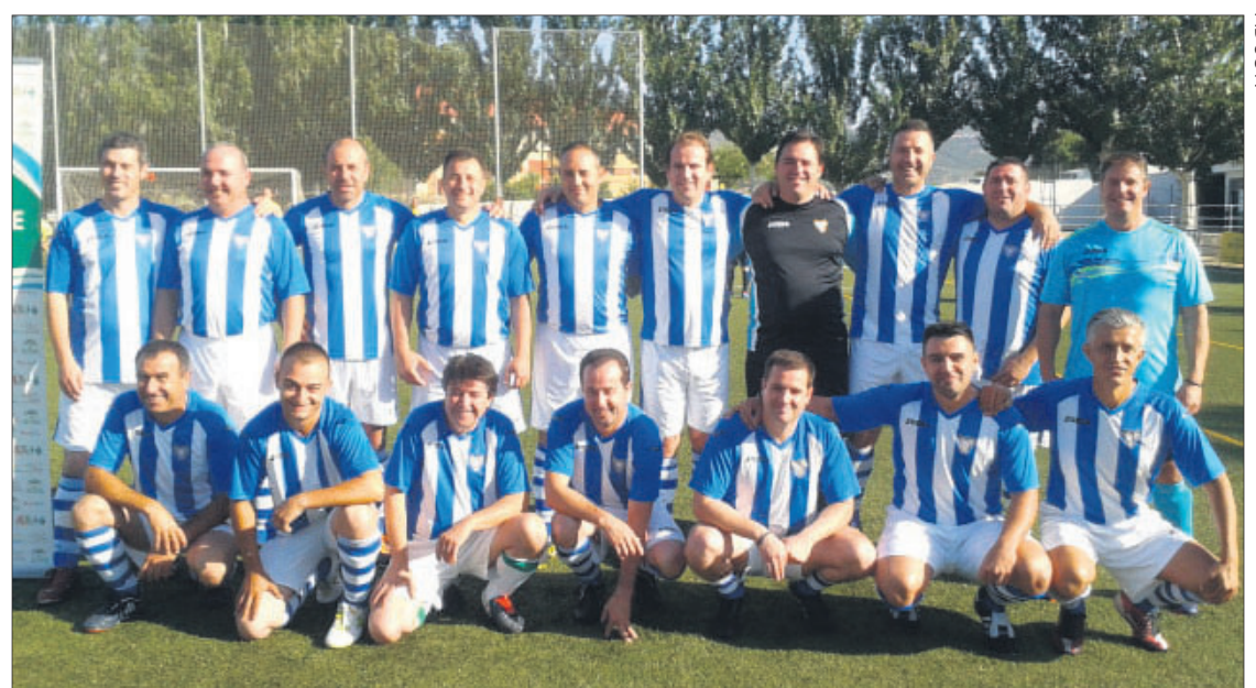
Equipo de veteranos del Fuensanta CF.

También han tenido lugar competiciones de otros deportes colectivos más minoritarios en la Sierra Sur, como son, por ejemplo, el baloncesto y balonmano. De esta forma, hubo torneos entre los que sobresalieron un triangular de balonmano y un maratón de baloncesto 3x3. Por otra parte, un lugar destacado es el ocupado por las competiciones de petanca y pádel, de los que se han celebrado dos cam-