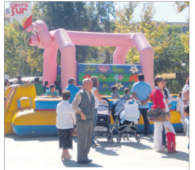
Hinchables en la zona de animación infantil.