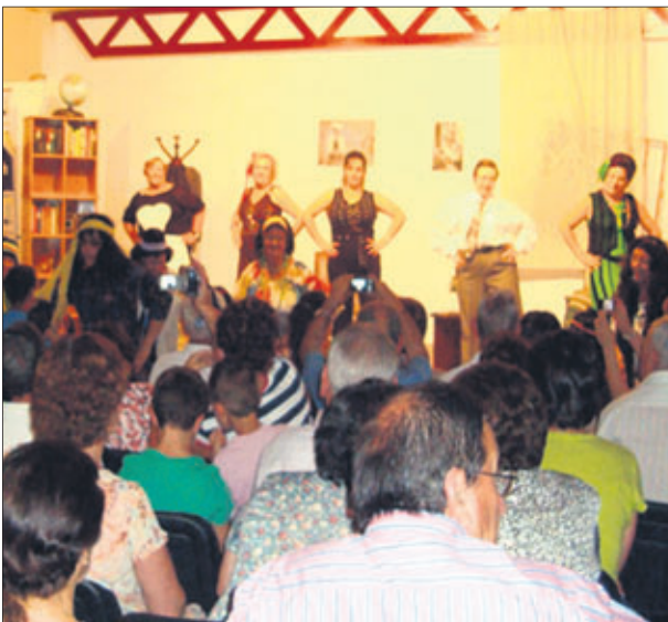
Taller de teatro.