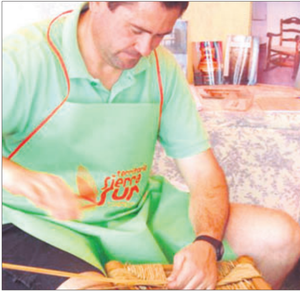
Un artesano de la enea trabaja.