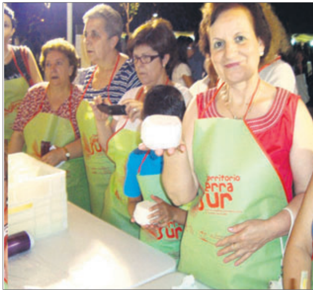
Taller de elaboración de queso artesanal.