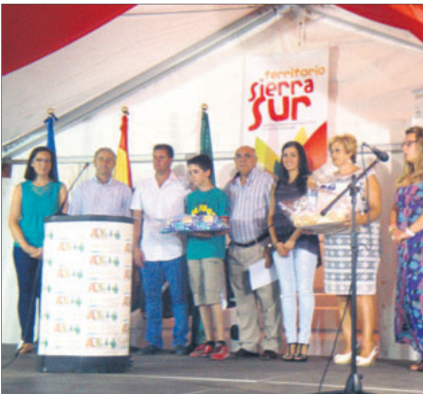
Entrega de premios de un concurso en Fuensanta.