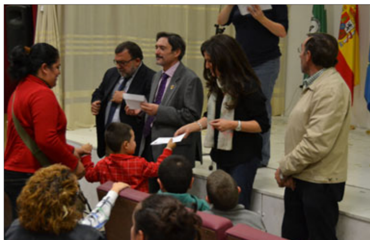
Responsables políticos entregan las ayudas.

de la unidad familiar, siendo estos inferiores al 75% del salario mínimo interprofesional (641 euros) multiplicado por el número de miembros que componen la unidad familiar (padre, madre, hijos e hijas).