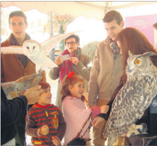
Taller de cetrería.