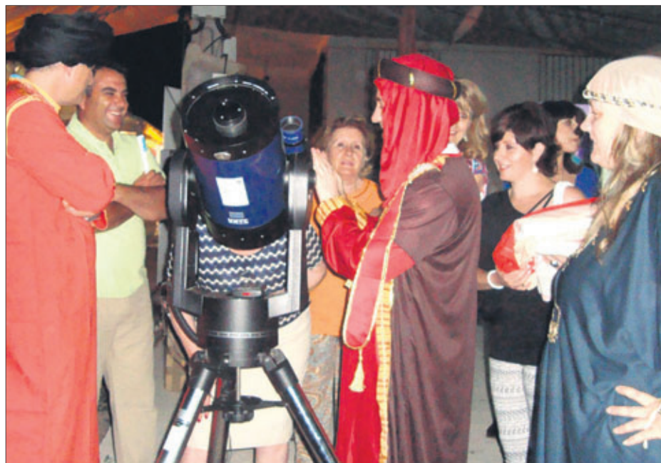
Taller de astrología de Al-Ándalus.