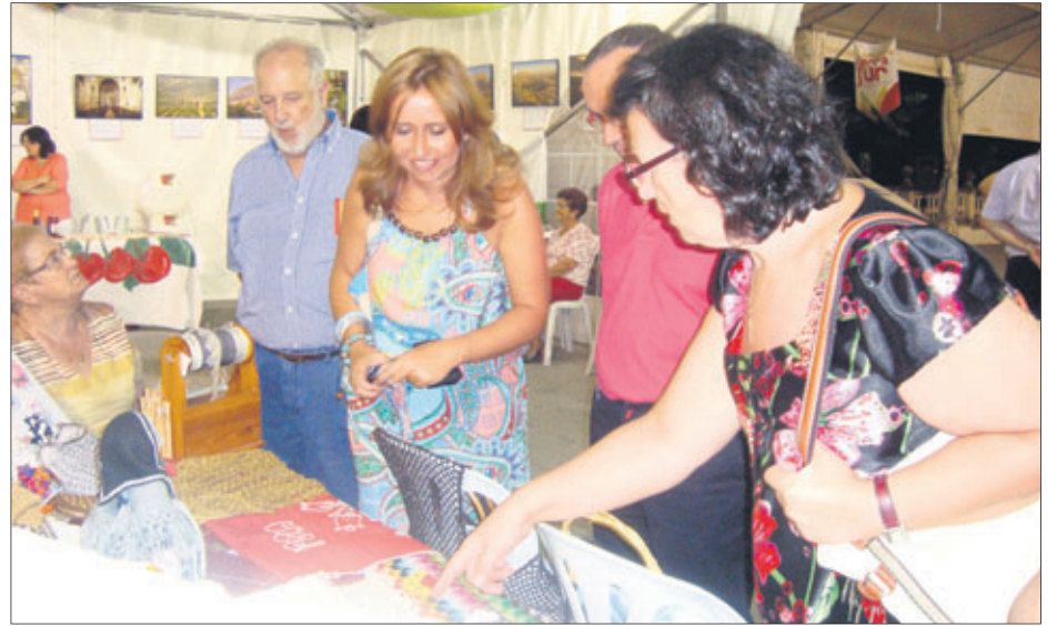
Autoridades en la inauguración de Castillo de Locubín.