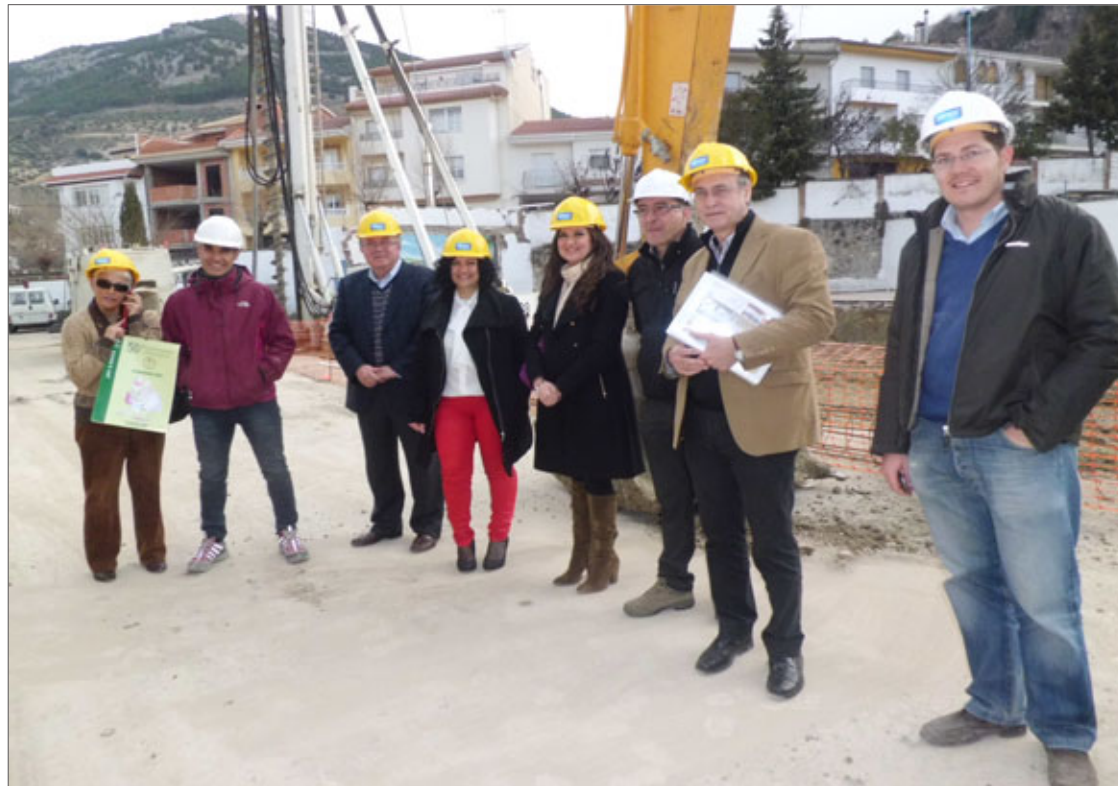
Visitas de las autoridades a las obras en el colegio Santiago Apóstol.

A continuación visitaron las obras del nuevo pabellón escolar, sobre una parcela de 4.400 metros