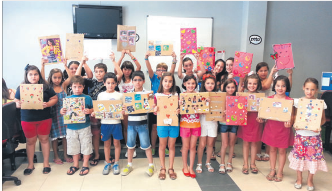
Menores en las instalaciones del Centro Guadalinfo de Los Villares.

El Centro Guadalinfo acogió actividades para los más pequeños, dentro del marco de innovación social y con el objetivo de inculcar valores desde edades muy tempranas. El reciclaje ha sido uno de ellos, en el taller de manualidades con materiales reciclados cada participante ha aprendido a construir desde un marco de fotos hasta una pulsera con materiales que normalmente desecharíamos, más aún en estos tiempos en los que debemos aprender a apreciar los recursos de los que disponemos. Los niños y las niñas han realizado sus trabajos muy ilusionados, incluso han creado el blog "conguadalinfoforeciclo.blogspot.com", donde se explican las manualidades paso a paso para que las pueda realizar cualquier persona, haya asistido al taller o no. Debido al éxito del taller de manua-