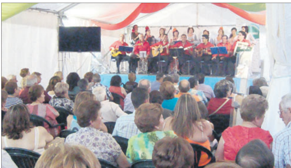
Actuación de un coro.