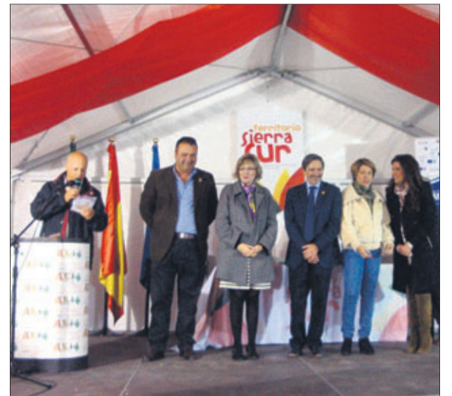
Entrega de premios en la yincana de Alcaudete.