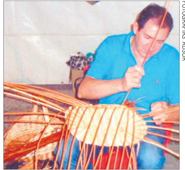
Un artesano elabora creaciones de mimbre.