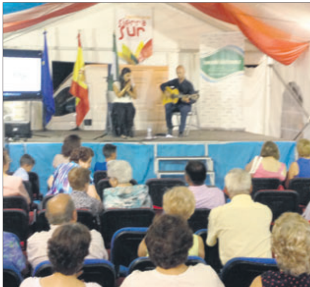
Actuación de flamenco.