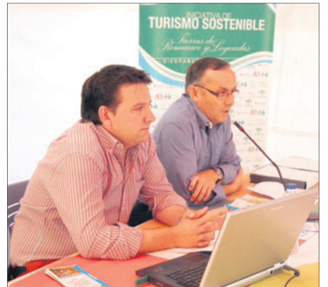
Reconocimiento a los mayores en Frailles.