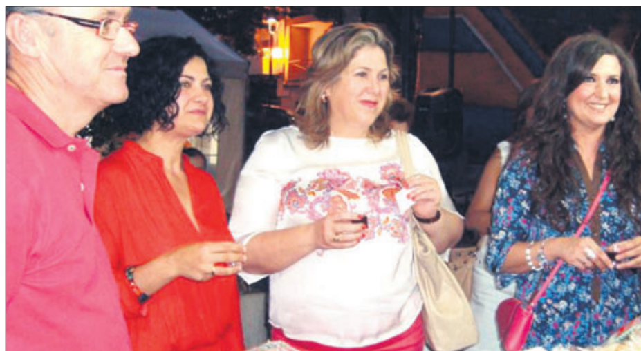
Autoridades en el mercado de productos agroalimentarios en Valdepeñas de Jaén.