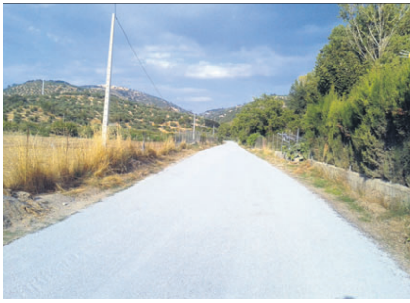
Camino de Los Rosales, en el término municipal fraileño.

Por otro lado, existen otros diversos proyectos pensados