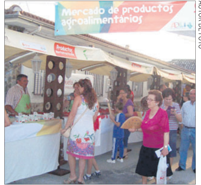
Mercado de productos agroalimentarios.