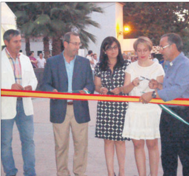
Inauguración en Torredelcampo.