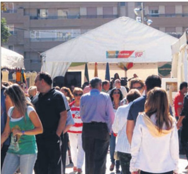
Panorámica general de la muestra.