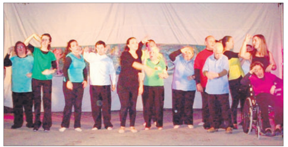
Actores y actrices en la representación de "IntegrArte".

El centro del casco urbano villariego acogió la segunda edición de la Feria del Comercio. Vecinos y vecinas del municipio y visitantes tuvieron la ocasión de adquirir diferentes productos a unos precios muy interesantes. Las autoridades locales están satisfechas con el éxito que supuso la iniciativa y por la aceptación de esta actividad.