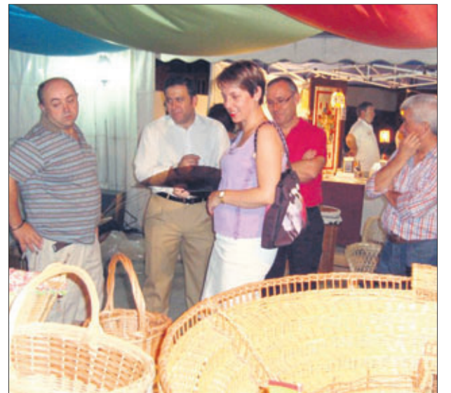
Exposición de productos artesanos en Los Villares.