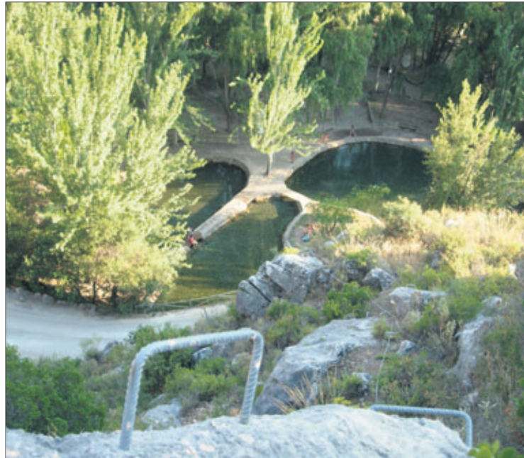
La Vía Ferrata es un aliciente más que se une a los atractivos propios del paraje del nacimiento del río San Juan.

Entre las distintas actividades deportivas que ofrece Castillo de Locubín, podemos destacar la de practicar escalada a través de la Vía Ferrata que se ha instalado en el Nacimiento del Río San Juan. Para los amantes del deporte de aventura constituye sin duda un atractivo inigualable. La dificultad de esta escalada es media y ofrece al escalador la posibilidad de contemplar una de las vistas más bellas de nuestra comarca. Todo el material para la práctica de este deporte podrá alquilarse en el Ayuntamiento o en el polideportivo del municipio castillero. La Diputación Provincial de Jaén y Adsor, con la colaboración del Ayuntamiento de Castillo de Locubín, convocaron unas jornadas para el descubrimiento de las vías ferratas, que se celebró en el municipio los días 15 y 16 de noviembre.