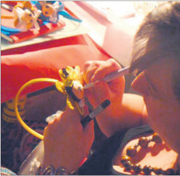
Una artesana de la goma espuma.