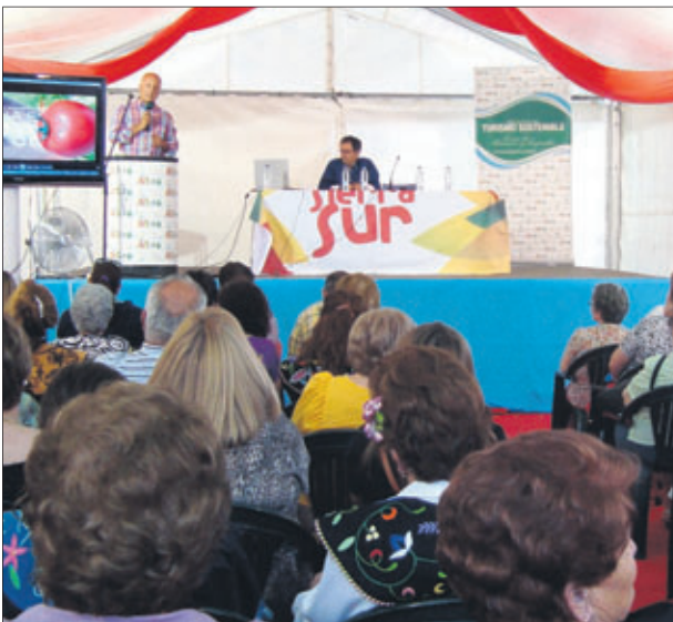
Presentación de las Jornadas Gastronómicas.