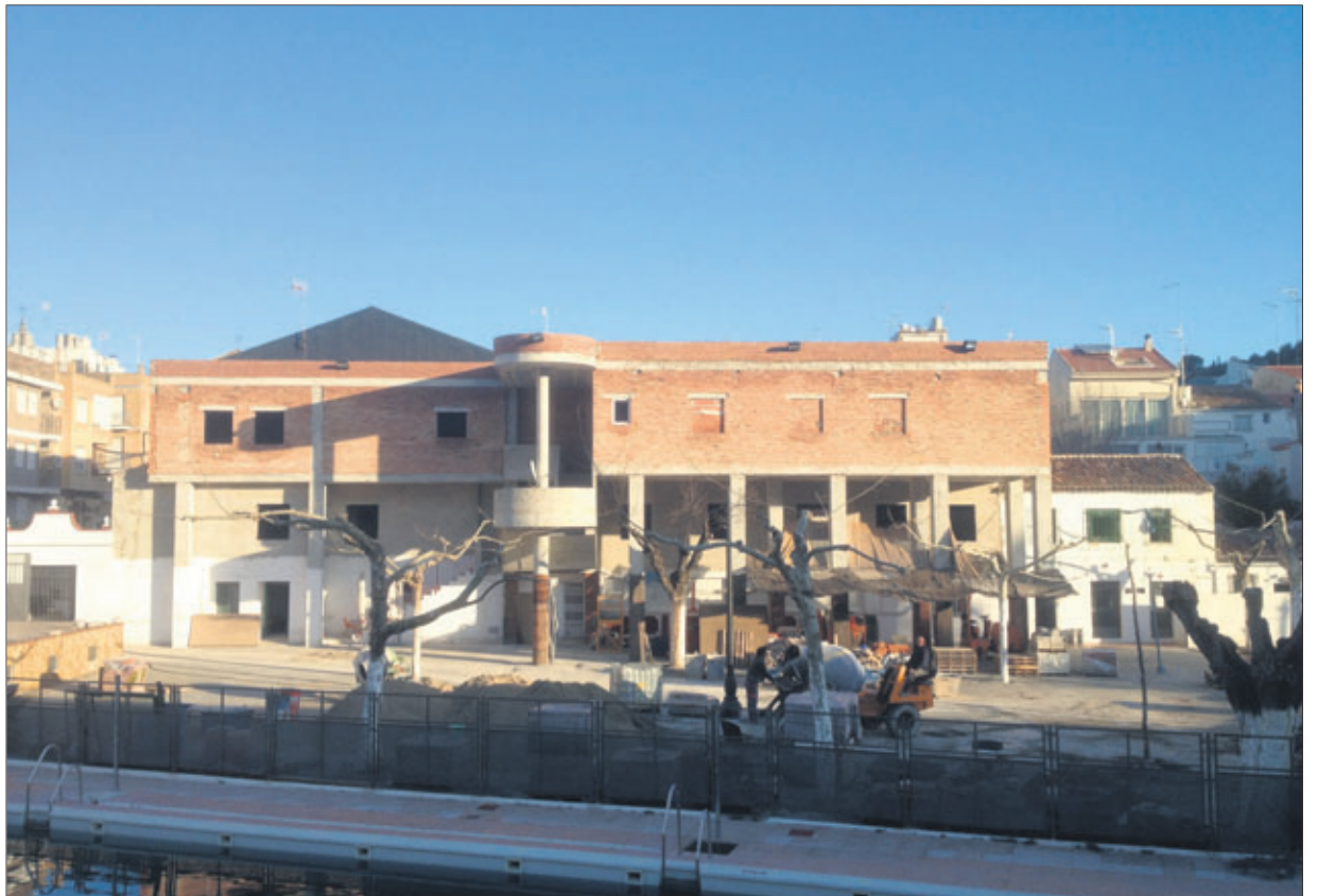
Aspecto actual del futuro auditorio municipal de Jamilena.

El concejal de Obras explica que, además, se acometerán próximamente trabajo de remodelación del parque infantil y del entorno del auditorio, para que una vez terminada la legislatura Jamilena cuente con una sala para actos escénicos y un parque infantil donde los niños y las niñas del municipio de la comarca Sierra Sur de Jaén puedan jugar y los padres estar tranquilos dentro de un espacio también "olvidado" desde hace muchos años, según manifiesta el responsable del Ayuntamiento de Jamilena.