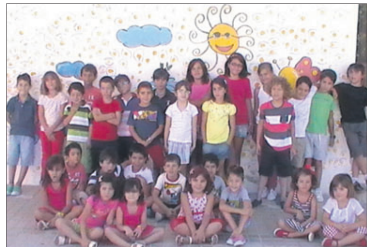
Alumnado de la Escuela Municipal de Verano 2013.

des que se llevan a cabo se encuentran: repaso de contenidos escolares, ayuda en la realización de las tareas de verano, taller de cocina, disfraces, juegos, gymkanas, manualidades, actividades de expresión musical, cuentos o dramatizaciones. Contó en todo momento con el apoyo del Ayuntamiento y la indiscutible colaboración de las familias. Además, la Corporación local ha puesto a disposición las distintas instalaciones del municipio por lo que también se hacían salidas a la piscina y a otros lugares.