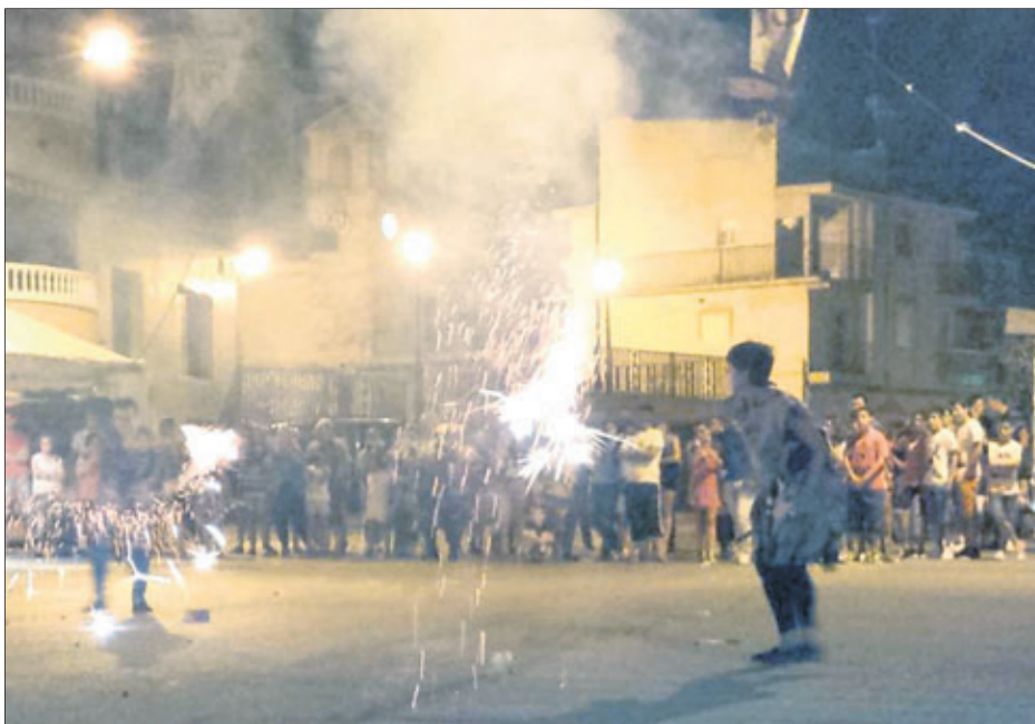
Espectáculo al aire libre con el fuego como protagonista.