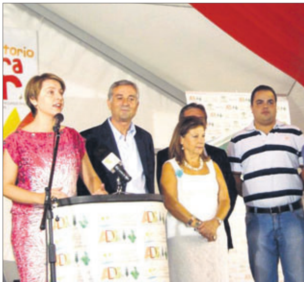
Acto de presentación de la Muestra en Martos.