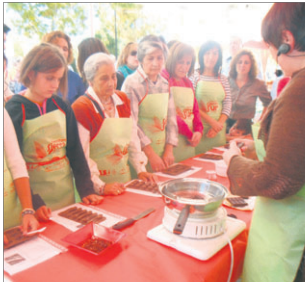
Taller de repostería creativa.