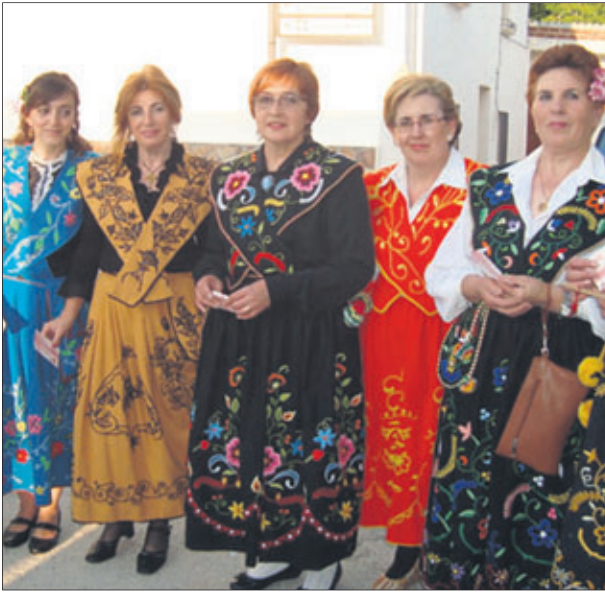
Taller de trajes típicos.