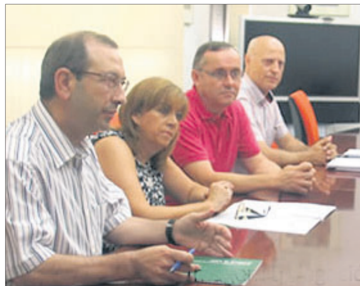
Firma de los contratos en la Delegación del Gobierno.

Por otro lado, el inventariado se centrará en la flora, la fauna y los principales lugares de interés paisajísticos, ornitológico y fluvial e hidrológico que la comarca posee. El proyecto es desarrollado por Cista S. L. con una inversión de 39.700 euros. Ambos proyectos tienen entre sus objetivos incrementar la oferta turística de la comarca, atraer un turismo de calidad y poner en valor el patrimonio ambiental.