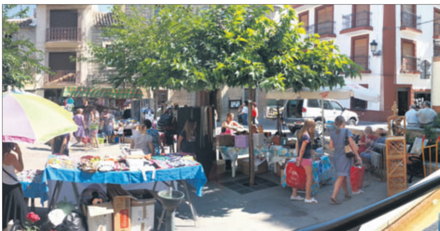
Feria del Comercio, celebrada en pleno centro de Los Villares.