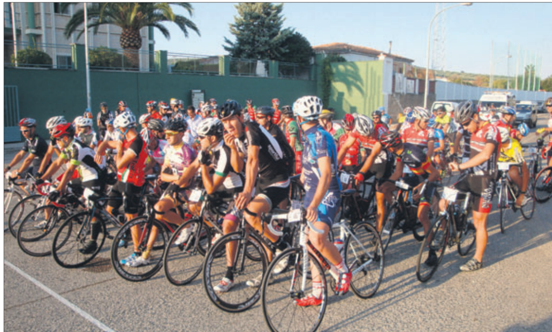
Participantes de la prueba listos para la salida.

Antes de coronar el Alto de La Pandera (situado a 1.872 metros de altitud), la ruta transcurrió también por los términos municipales de Fuensanta, Castillo de Locubín (donde se produjo una segunda salida para ciclistas con bicicletas de montaña) y Valdepeñas de Jaén pueblo en el que se congregaron numerosos vecinos y vecinas con la