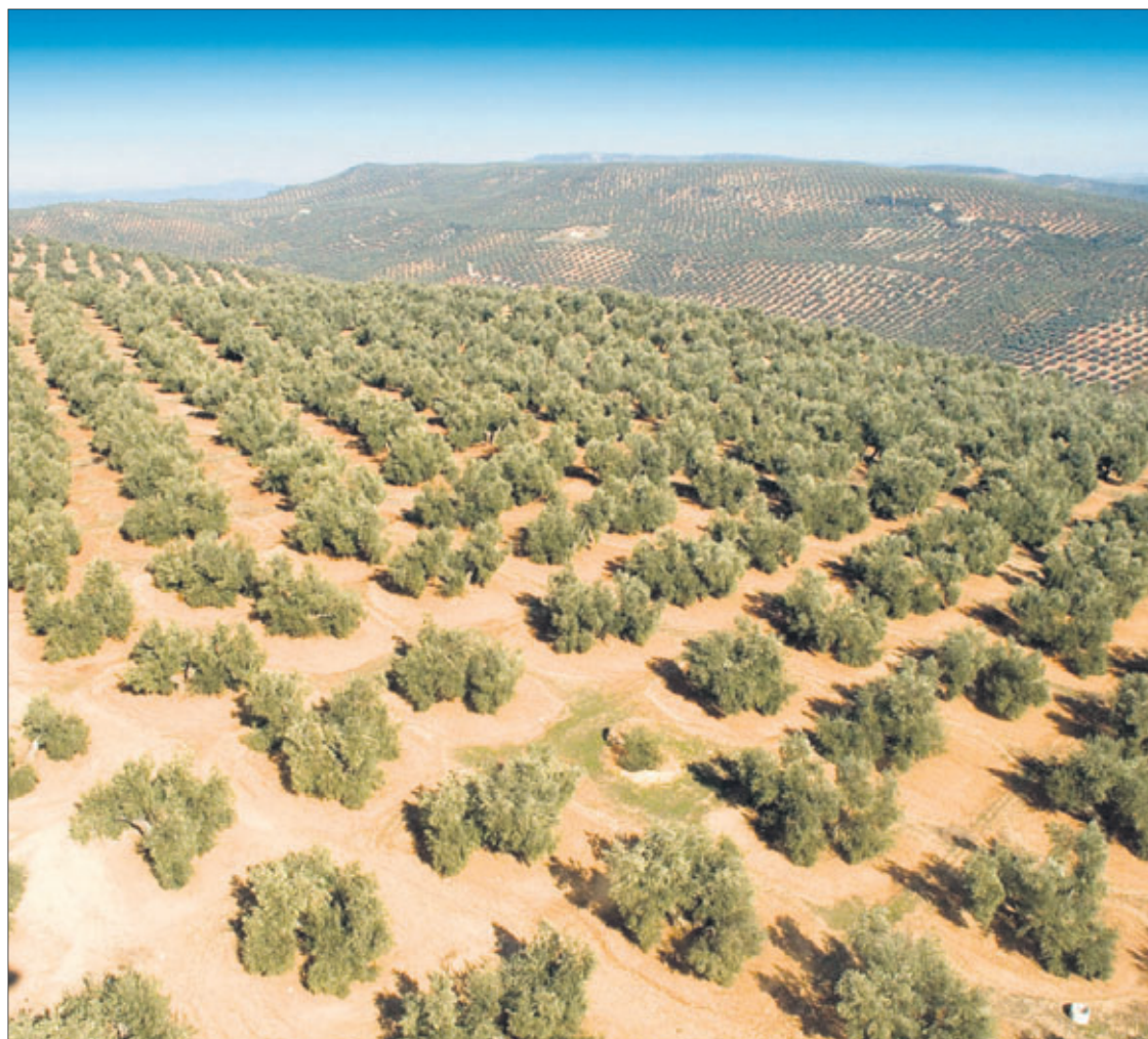
El olivar es el cultivo dominante en el amplísimo territorio de la provincia de Jaén.

Centrándonos ya en la provincia de Jaén, resulta importante que en una tierra eminentemente olivarera abramos el abanico a otros cultivos, sin olvidar que nuestro sector del aceite de oliva está consolidando su liderazgo internacional y que Andalucía produce más de una tercera parte —en torno al 40%— del aceite mundial.