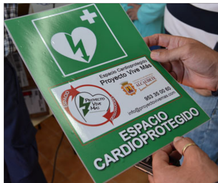
Distintivo del Proyecto Vive Más de Alcaudete.