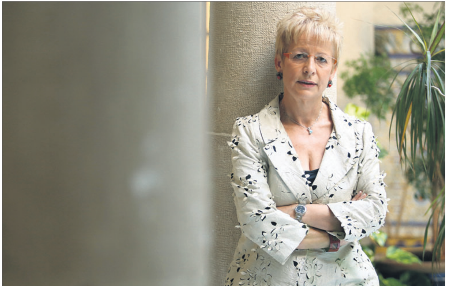
La consejera de Agricultura, Pesca y Medio Rural de la Junta de Andalucía, Elena Víboras Jiménez.

Y algo fundamental: el impulso empresarial de nuestros jóvenes. Hasta hace poco no veían futuro en el mundo rural, algo que la crisis está cambiando al ver nuevas oportunidades en el sector agrario. El carácter emprendedor de nuestra juventud necesita de una formación adecuada para canalizar todo su caudal, lleno de energía. Por ello, la Consejería cuenta con el Instituto de Formación Agraria y Pesquera de Andalucía (Ifapa) un importante instrumento con un amplio catálogo formativo.