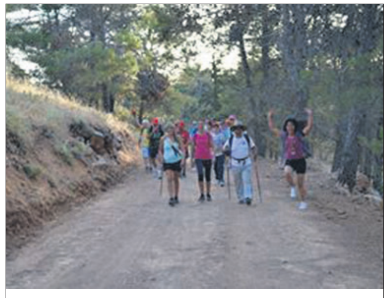
Ruta por el término municipal de Castillo.

El término de Castillo de Locubín destaca por su variedad medioambiental y por su riqueza paisajística, botánica y faunística. En el término se combinan el monte mediterráneo con los cultivos, incluidas áreas de huerta. Por otro lado, la abundancia de manantiales es otro de los alicientes para quienes visitan el municipio.