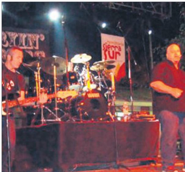
Concierto de pop-rock..