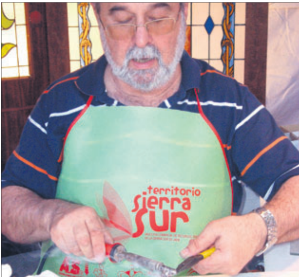
Artesano de las vidrieras.