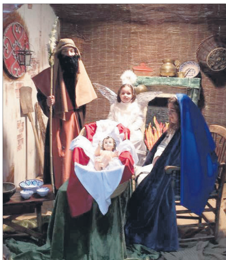
Tradicional belén viviente de Fuensanta.

Plan Provincial de Juventud, las bandas de música locales ("Filarmonía de Fuensanta" y "Maestro Antonio Carpio") pusieron la banda sonora a estas celebraciones especiales con sus conciertos de Navidad y de Año Nuevo respectivamente. Durante el día 1 de enero, Sus Majestades de Oriente visitaron Fuensanta para recoger la últimas cartas de los niños y las niñas del municipio. La programación de actividades continuó con la Cabaigata de Reyes Magos, donde asociaciones y particulares se volcaron para que las calles de Fuensanta de llenaran de color, luz e ilusión llevando los regalos a los más pequeños. El punto final de las celebraciones llegó de la mano del belén viviente en el que más de medio centenar de niños y niñas formaron parte de las diferentes escenas de esta tradicional representación.