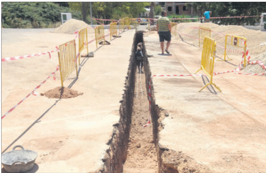
Obras de la conducción entre el sondeo y los depósitos municipales.