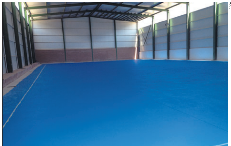
Aspecto del interior de la pista polideportiva cubierta

ríodos extremos de sequía, dado que no se producen pérdidas pues la conducción es cerrada, y, sobre todo, debido a que la toma se realiza directamente desde el sondeo. Por otro lado, al unificar las tomas en una única conducción, la gestión de los abastecimientos se simplifica y se abarata en su conjunto y al ser una tubería cerrada no se ven afectadas las características organolépticas.