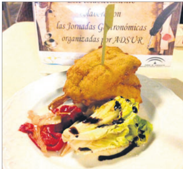
Tapa ofrecida en las Jornadas Gastronómicas.