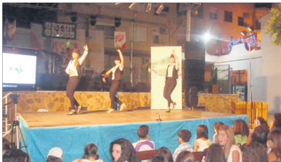
Actuación de baile durante la Muestra.