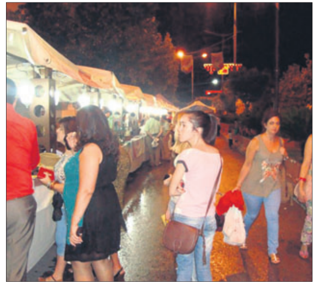
Mercado de productores agroalimentarios.