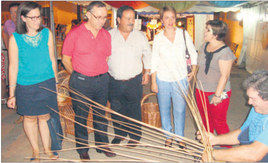
Autoridades en la inauguración de Jamilena.