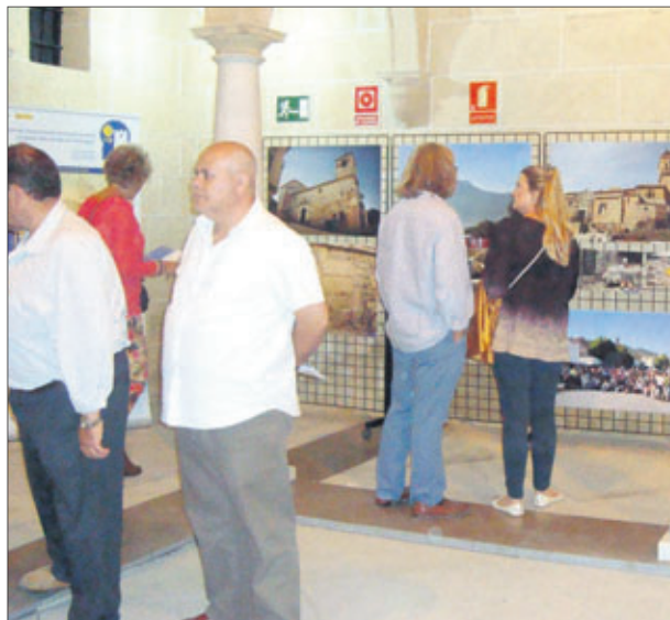
Exposición sobre el Camino Mozárabe de Santiago.