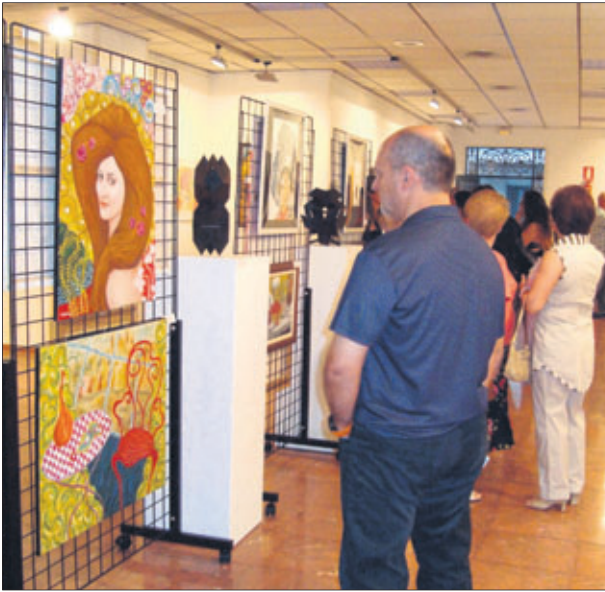
Exposición "Artesur 2013".