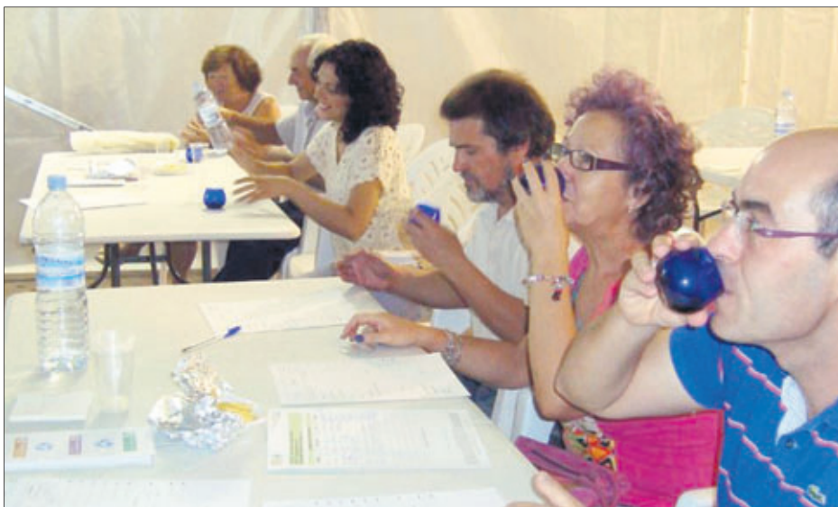
Taller de cata de aceite de oliva.