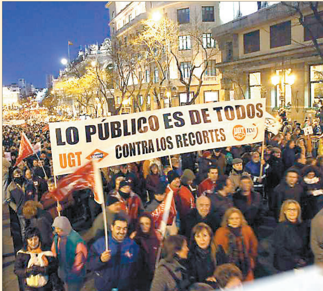
Protesta contra los recortes.

No me cabe más que pensar que quien realiza esta reforma desconoce la labor más que aceptable que realizan las administraciones locales y sus órganos de gobierno. La memoria presentada por el Gobierno habla de los millones de euros que se va a ahorrar en el gasto público, pero no dice nada de los millones de servicios prestados que van a desa-