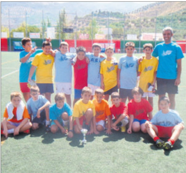
Torneo de fútbol 7.