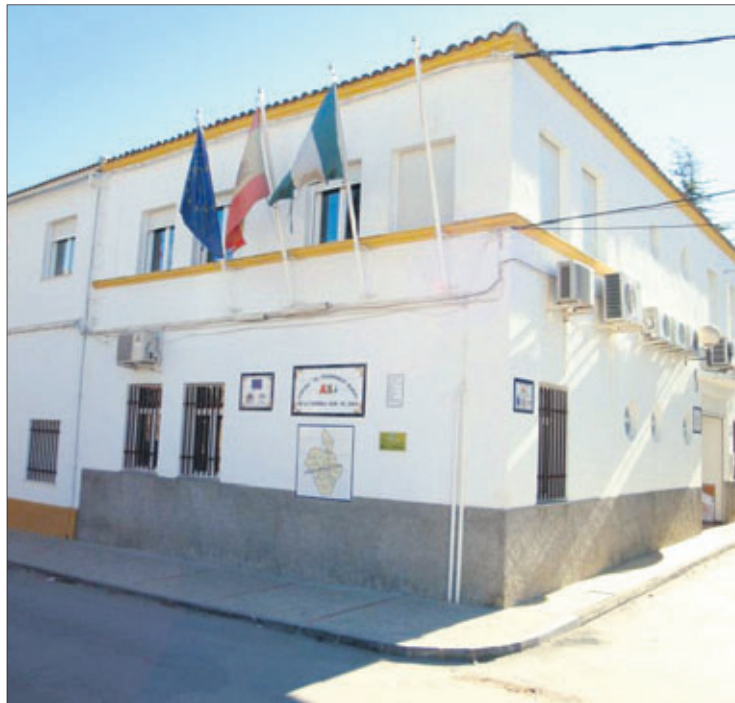
Sede de Adsur, en Valdepeñas de Jaén.

El Grupo de Desarrollo Rural de la Sierra Sur de Jaén, a través del Plan de Actuación Global, gestiona 6 millones de euros en ayudas, de los cuales ha sido comprometidos hasta la fecha el 85%. Ello supone, ayudas directas distribuidas entre pequeñas y medianas empresas, personas emprendedoras con ideas viables, ayuntamientos o asociaciones sin ánimo de lucro. El GDR