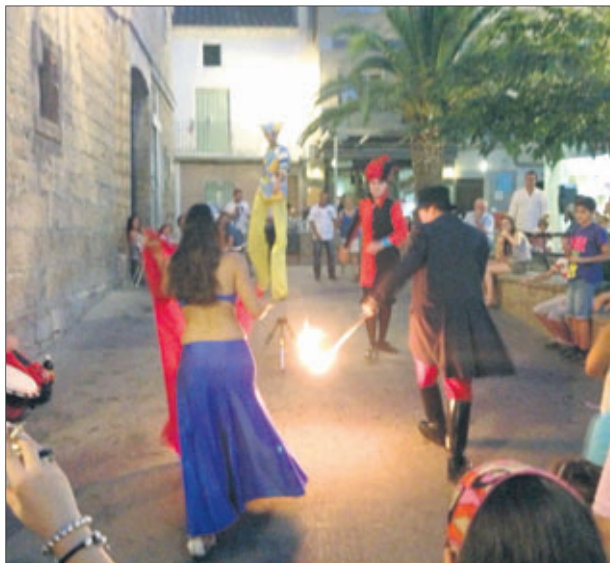
Pasacalles de animación.