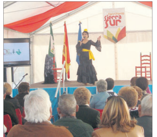
Actuación de cante.