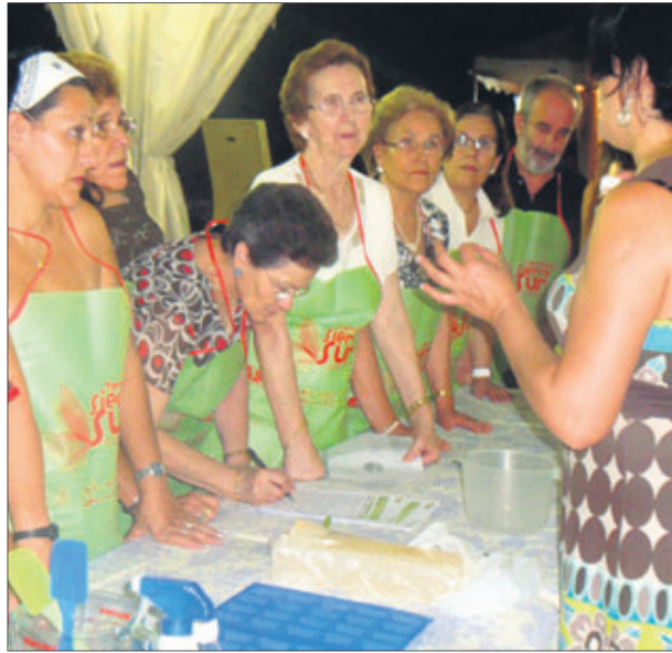
Taller de elaboración de jabones naturales.