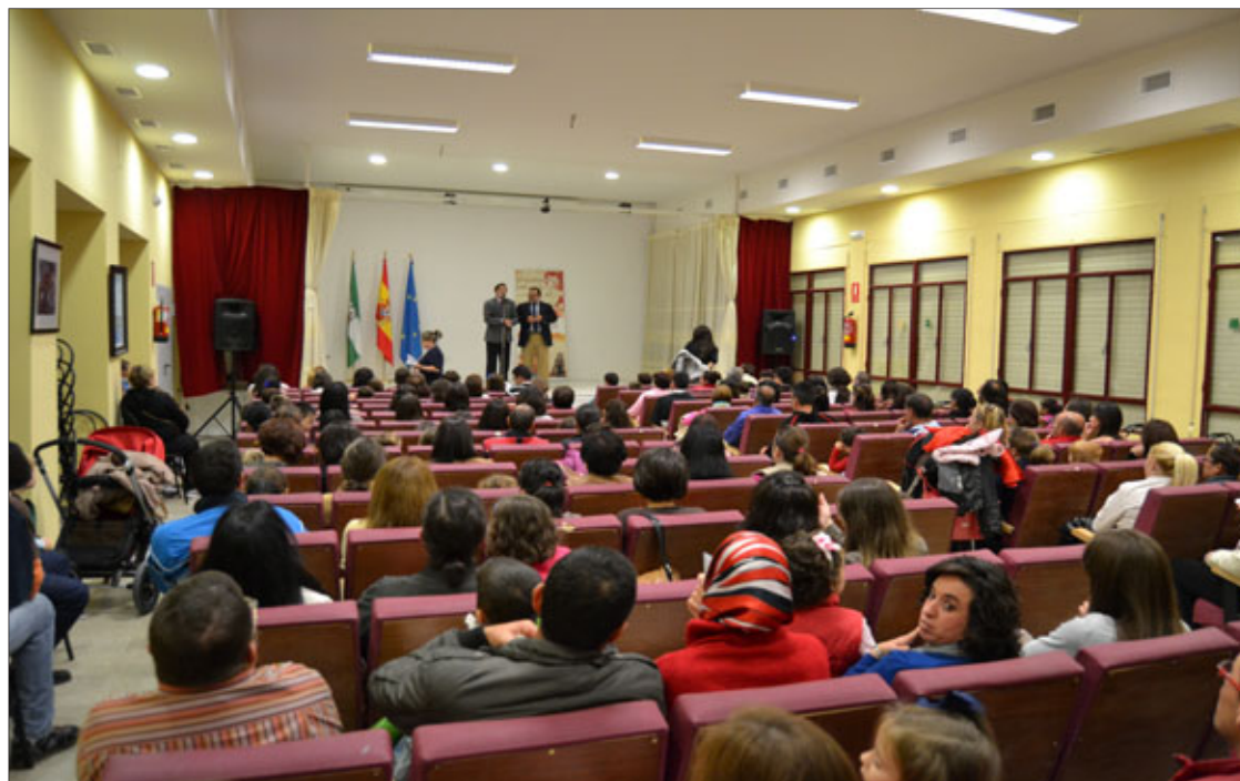
Asistentes a la reunión en la que las familias recogieron sus chequelibros.

La concesión del chequelibro 2013 ha estado regida por una serie de requisitos que permitiesen priorizar a las familias que más necesiten esta ayuda. El criterio exigido estaba basado en los ingresos