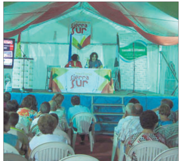
Presentación del proyecto Starlight.