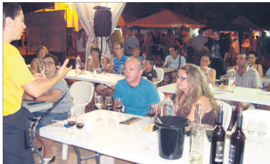
Taller dedicado a los vinos de la comarca.