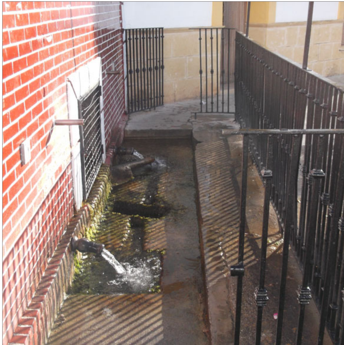
Aspecto actual de la Plaza del Nacimiento, en el casco urbano fraileño.

Está previsto que la intervención en el representativo y caudaloso manantial comience próximamente y que quede terminada a lo largo del presente año. Los vecinos y vecinas del municipio fraileño consideran acertada la intervención prevista, que permitirá que una de las señas de identidad de Frailes luzca más cuidado y gana en belleza.