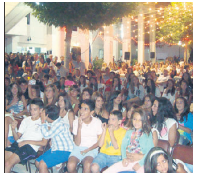
Asistentes a una de las actuaciones de la Muestra.