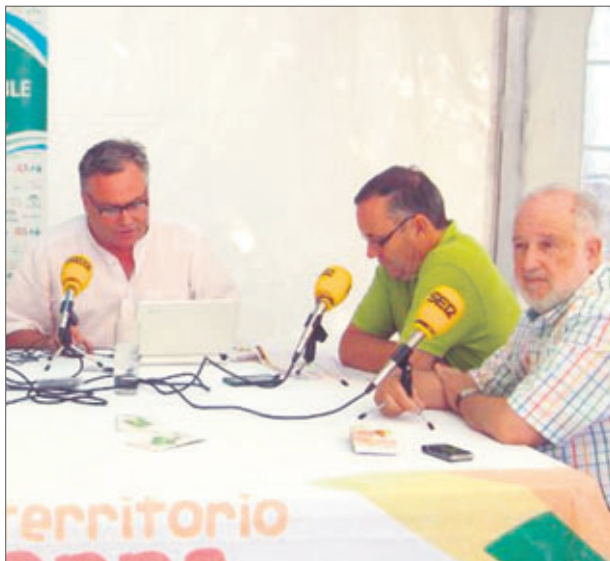
Programa de radio en Castillo de Locubín.