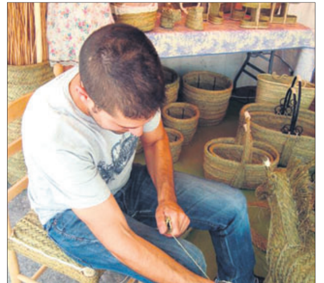
Artesano del esparto.