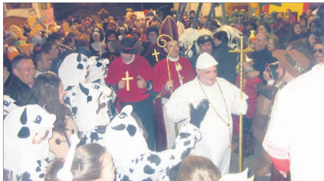
Ambiente en una anterior edición del Carnaval de Castillo de Locubín.